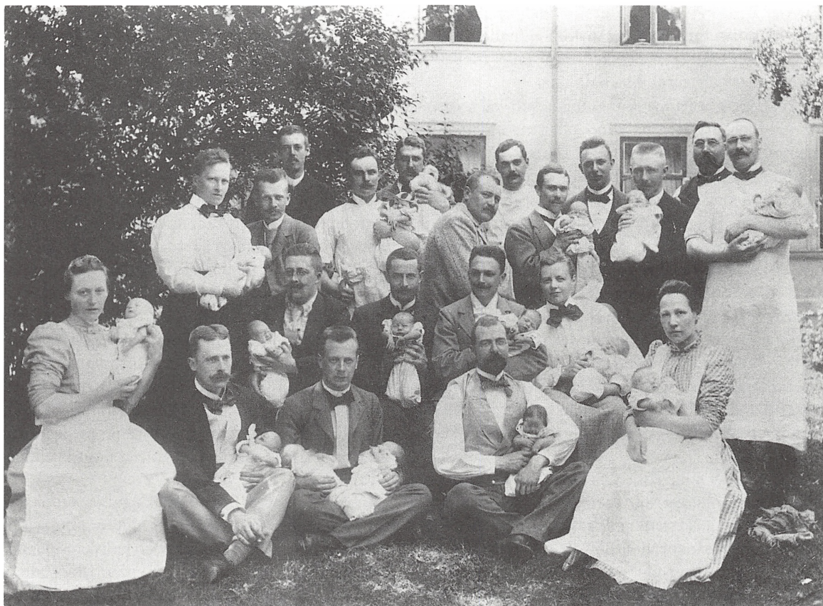
Under 1800-talet kom obstetrikerna att utgöra en allt viktigare del av läkarutbildningen. Gruppfoto avslöjar att det tidigare kvinnliga yrkesområdet vid seklets slut hade blivit ett statusfyllt manligt yrkesområde. Det är medicinare kandidatkursen som poserar med barn de själva förlöst i Allmänna barnbörds husets trädgård i Stockholm sommaren 1899. Foto Medicinhistoriska museet, Stockholm.

Vid mitten av 1800-talet existerade alltså en alltmer kvalificerad barnmorskekår, i numerär tillväxt, vars kvalifikationer på obstetriken område stod ungefär lika högt som läkarkårens. 31 Men läkarkåren började, med inspiration från andra länder, betrakta obstetrikerna som en intressant specialitet och manliga läkare började, tillsammans med barnmorskor, att anlitas vid förlossningar i städernas mest välmående familjer. Det var därmed bäddat för konflikter yrkena emellan.