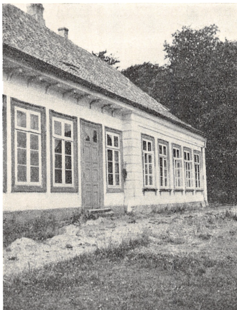
Sophienberg 1946. Fotografi.

nationsbrev af 19. Juli 1780 overdrog Christian VII ham i Stedet for Sophienberg med tilhørende Jord, ialt 31 Td. Land. Arealet blev senere betydeligt udvidet, idet den nærliggende Bukke-