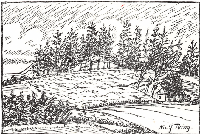
Stavnshøje, kaldet Stavlehøvene.