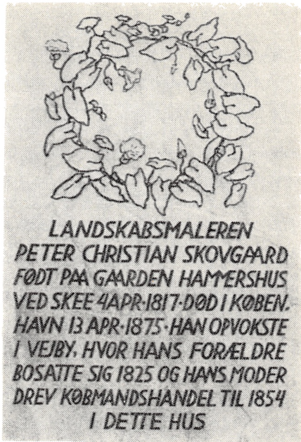
P. C. Skovgaards mindetavle i Vejby

som repræsentant for Vejby Borgerforening. Ved den smukke mindetavle ved kunstnerens barndomshjem i den gamle købmandsgård nedlagdes en krans fra selskabet, hvorefter et oldebarn af P. C. Skovgaard takkede for den smukke højtidelighed.