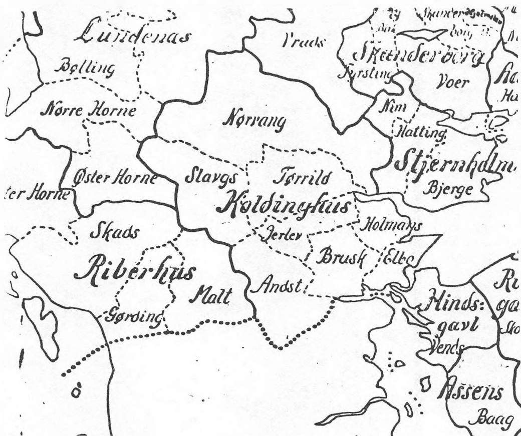
Amtsinddelingen før 1793.