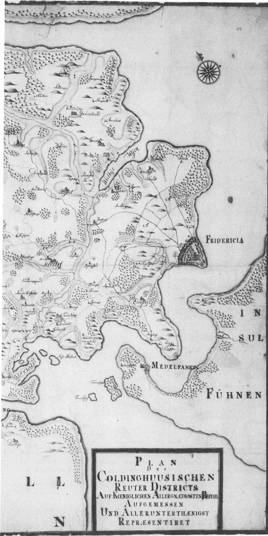
P L A N D E S COLDINGHUUSISCHEN REUTER DISTRICTS AUF KENIGLICHEN ALLERGNÄDIGSTEN BEFELH AUFGEMESSEN UND ALLERUNTERTHEENIGST REPRESENTIRET