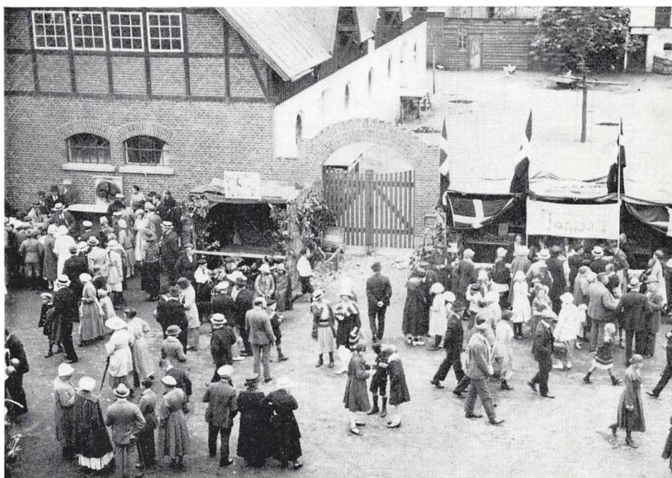
Trængsel på fjerne tiders festplads

dages weekend-begreber. Man havde i alle tilfælde noget at overveje – og udsatte den endelige stillingtagen til spørgsmålet 2-dages-fest. Et spørgsmål, der vitterlig – hvad tydeligt viste sig senere hen – var af ikke ringe betydning for indtjeningen ved festerne. Og fra 1934 blev lørdag-søndagene en realitet – samme år som soireernes ophør.