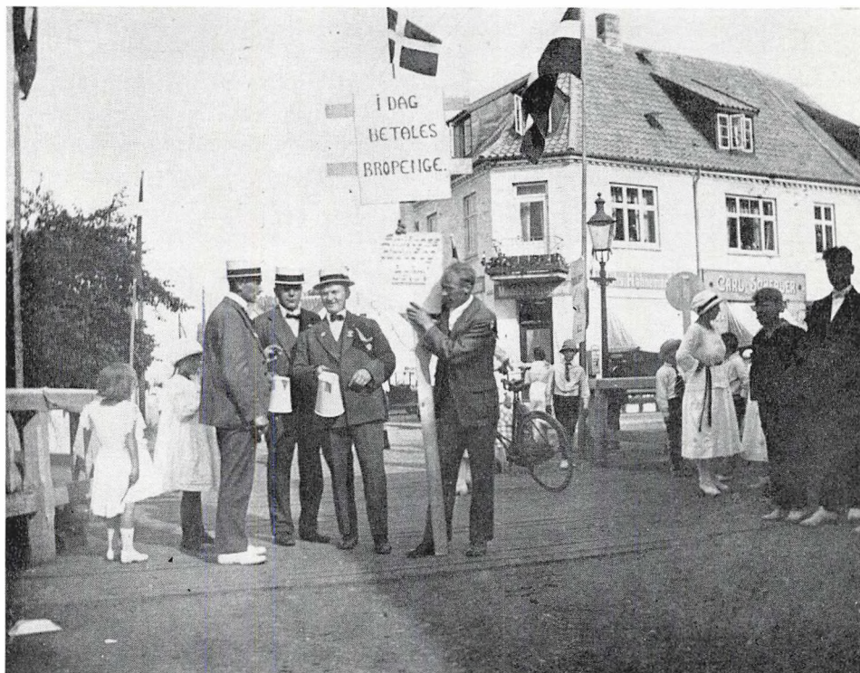
Der opkræves bropenge –

Pigecharme har vi skam ellers ikke manglet ved bakkefesternes programmer. Vi har haft parader af mange af de populære pigegarder såsom Helsingør,