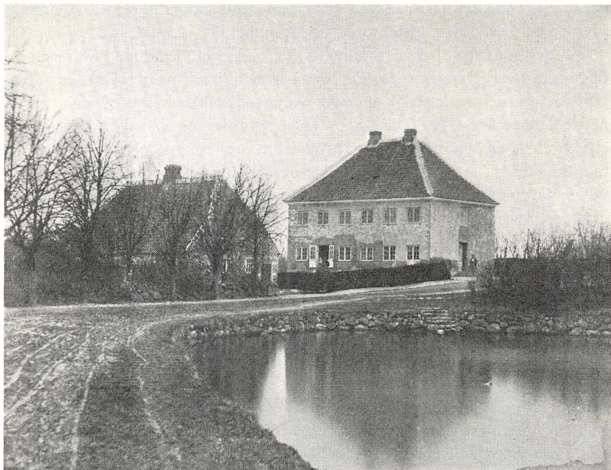
2. Uidentificeret bygning. Billedet (15 × 19,5 cm) er optaget ca. 1870 af den danske fotograf August Wilhelm Kirchoff (1822–1886), oprindelig instrumentmager og pianostemmer, der fra 1858 var omrejsende fotograf med hovedkvarter i København. Billedet, der i 1958 er købt uidentificeret hos en billedhandler, har trods mange anstrengelser hidtil ikke kunnet stedfæstes.

og meget mere. Af danske topografiske blade alle grafiske; håndtegnede som for danske kort anført, og fotografier i analogi hermed. Af udenlandske topografiske blade gengivelser af alle steder af international betydning eller af betydning for Danmark, alt i overensstemmelse med bibliotekets øvrige anskaffelsespolitik f. eks. inden for geografi og historie. Af danske og udenlandske historiske blade analogt med det for topografi anførte. Af danske portrætter alle grafiske foruden de håndtegnede, samlingen har, og de ikke alt for personelt ubetydelige, der i fremtiden kan skaffes; fotografier, dels »efter naturen«, dels efter malede og skulpterede portrætter eller efter portrættegninger i andres eje, i analogi hermed. »Danske« tages i videste betydning, og ved forskellig kontrol søges det sikret, at alle danske af nogen historisk interesse så vidt gørligt er repræsenteret. Af øvrige »blade« postkort, der emnemæssigt falder ind under de nævnte områder, med hovedvægten på