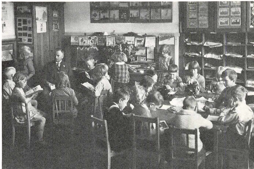
3. Vanløseforsøgene var 1920-ernes brud med den autoritære klasseundervisning. Børnene kunne som her arbejde i grupper eller individuelt med f. eks. læsning, skrivning, regning, tegning, håndarbejde og endog maskinskrivning. Forsøgene, der er en interessant forskningsopgave for Institutet, var et for dristigt pædagogisk eksperiment og blev indstillet i 1928.