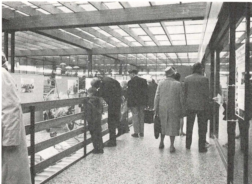
2. »Frilandsmuseet møder Rødovre Centrum«. Publikum ved udstillingen »Oldemors arbejdsdag«. Nogle står ved terrassens rækværk og ser på udstillingen, andre ser på butiksvinduer.

synes folk i gennemsnit at være forblevet ved udstillingen »Oldemors arbejdsdag« ca. 12 minutter, vist med tendens til længere ophold om aftenen (efter butikslukketid) og kortere midt på en travl indkøbsdag. Til belysning af, om Frilandsmuseet har fået nye kontakter til publikum gennem arrangementet, skal endelig nævnes, at ca. halvdelen af arrangementets busgæster efter det oplyste ikke tidligere har været på Frilandsmuseet. Blandt de adspurgte på udstillingen nåede man frem til, at ca. en trediedel skulle have været på et eller andet museum inden for det sidste år.