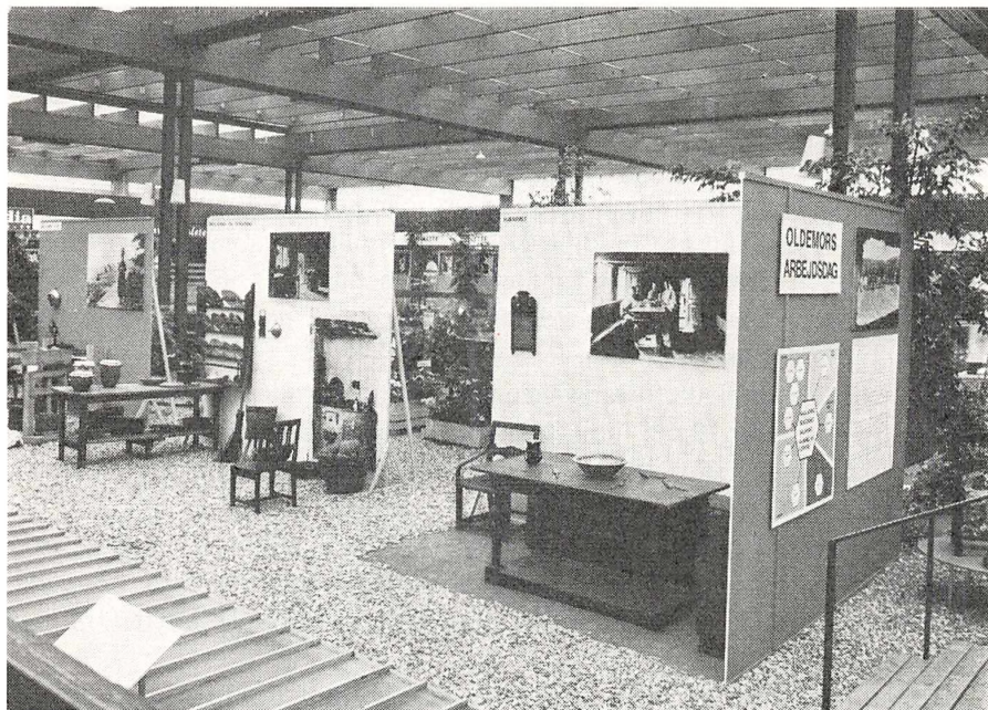
1. »Frilandsmuseet møder Rødovre Centrum«. Billedet viser et udsnit af udstillingen »Oldemors arbejdsdag«, indrettet i øvre etage af centrets grønnegård.

ikke flytte til Rødovre for en uges tid. Arrangementet »Frilandsmuseet møder Rødovre Centrum« søgte alligevel at besvare spørgsmålet: »Hvad er Frilandsmuseet?«