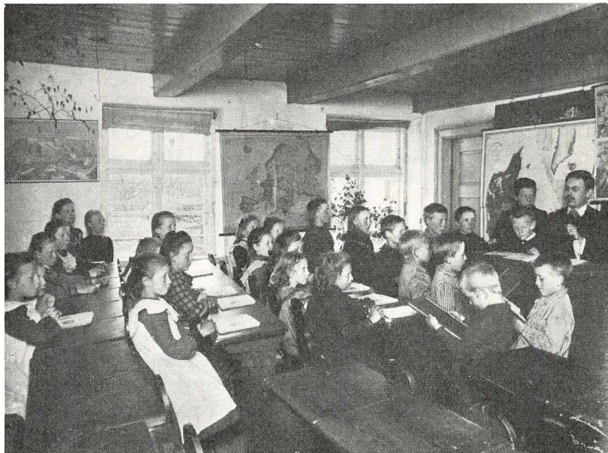
1. Med særlig opmærksomhed følger de 16 piger og 11 drenge undervisningen på årets første skoledag i Arnøje skole i 1905. Pigerne til venstre har læsning, medens drengene til højre tilsyneladende har regning på griffeltavle. Bag det høje kateder troner læreren i hvid skjorte og med hånden om den lange hvide porcelænspipe. – Blandt de forskningsområder som Institutet beskæftiger sig med indtager landsbyskolen omkring århundredskiftet en fremtrædende plads.

præget skolevæsenet ved siden af den enkelte personlige indsats fra befolkningens, lærernes eller de statslige myndigheders side.