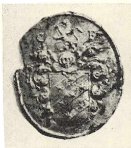
CHRISTEN FABRICIUS. 1753—1819. Sognepræst til Skanderborg-Skanderup-Stilling. Hofpræst. Stamtavlen Nr. 90.