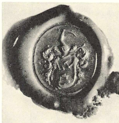
EDUARD FABRICIUS. 1809—1850.

Segl paa Brev af 19. Januar 1756 fra Bamble Præstegaard til Overinspektør Laurs Fabricius.