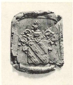
Ukendt Ejer. Segl i Rigsarkivets Seglsamling.