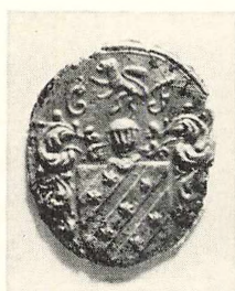
Ukendt Ejer. Segl i Rigsarkivets Seglsamling.