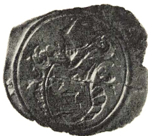
Samme Ejer som Signetet nedenunder.