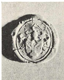
Ukendt Ejer. Segl i Læge F. B. Fabricius Seglsamling.