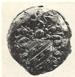
Ukendt Ejer. Segl i Rigsarkivets Seglsamling.