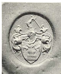
Ukendt Ejer. Segl i Læge F. B. Fabricius Seglsamling.