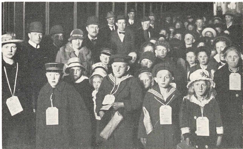
Det første Hold af sønderjydske Børn kommer til København den 26. April 1919.