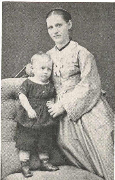
Min Moder og jeg.

Men saa kom den store Dag, da vi flyttede over Gaden og op paa første Sal, hvor vi fik som vi syntes, en herlig Lejlighed, kun med ubegribeligt mange Døre. Her var Lys og Luft og Plads til at røre sig. Og her boede mine Forældre i c. 16 Aar.