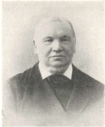
Pastor Fr. von Bodelschwingh.

og vise mig rundt. Samme Student, som bar Faderens Navn Friedrich , blev Faderens Efterfølger som Bethels Leder og en af Tysklands mest fremragende Præster. Det var ham, der skulde have været den første Rigsbiskop, men Hitler vilde ikke gaa med dertil. Siden hint Besøg i Bethel stod jeg i Forbindelse med ham, og jeg har under Verdenskrigene kunnet hjælpe Bethel fra dansk Side.