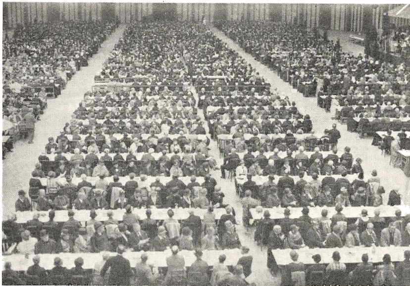
Et Kaffebord for 3500 Gæster.

men? Har De da saa meget?» Han smilede og bad mig følge med ud paa Lageret. Der pegede han paa Afdeling efter Afdeling med Kopper, Tallerkener og hvad der ellers stod paa vor Ønskeseddel, indtil jeg sagde: »Stop! Nu har jeg ikke mere at bemærke end en hjertelig Tak paa de gamles Vegne.« Direktøren tilbød yderligere at køre det hele ud til Forum og hente det igen. Alting var gratis, kun skulde vi erstatte, hvad der blev slaet itu.