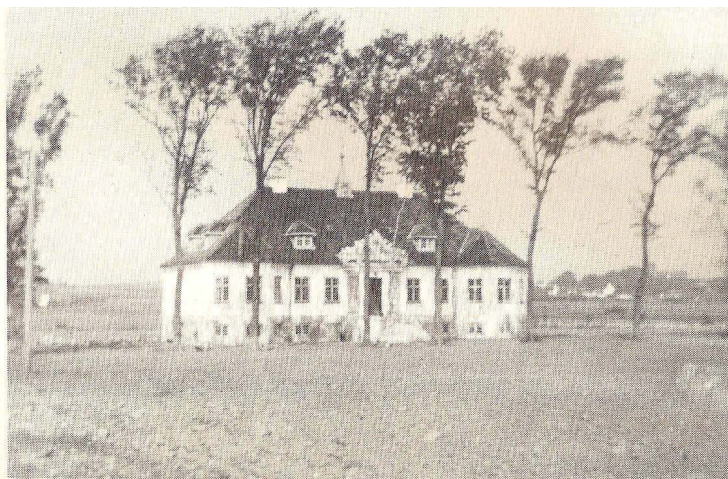
Gården lå stor og statelig med sit vældige tag af blinkende sorte teglsten.

Fik man lov til at komme indendørs, var der kun kostbare empiremøbler på begge etager i hele stuehuset, siges det, over kælderen, hvor han var flyttet ned, dengang hans kone døde, og antagelig beholdt de tre frakker og skægstubbene på, når han sov. Sådan så han ud.