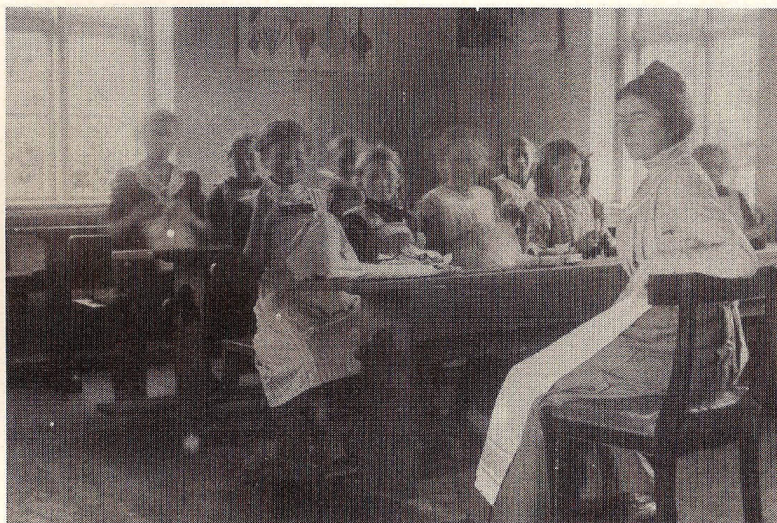
Nicolines systole - i Tibirke skole?

Da man ingen hest havde, foregik al transport fra huset med trillebør.