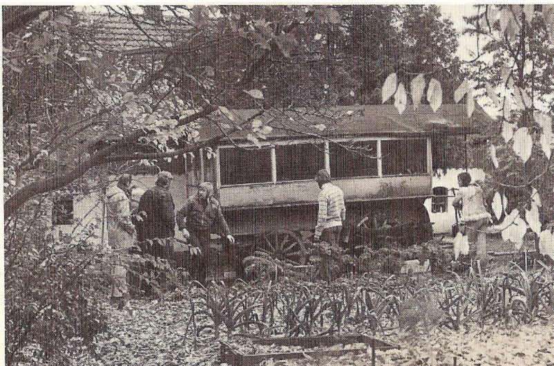
Sporvognen før sidste afgang fra Ørby i 1972.