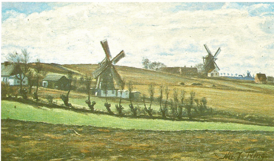
Ørby mølle, Taagerup mølle og Ramløse mølle. Malet af Nicolai Jensen Tving. Ca. 1940.