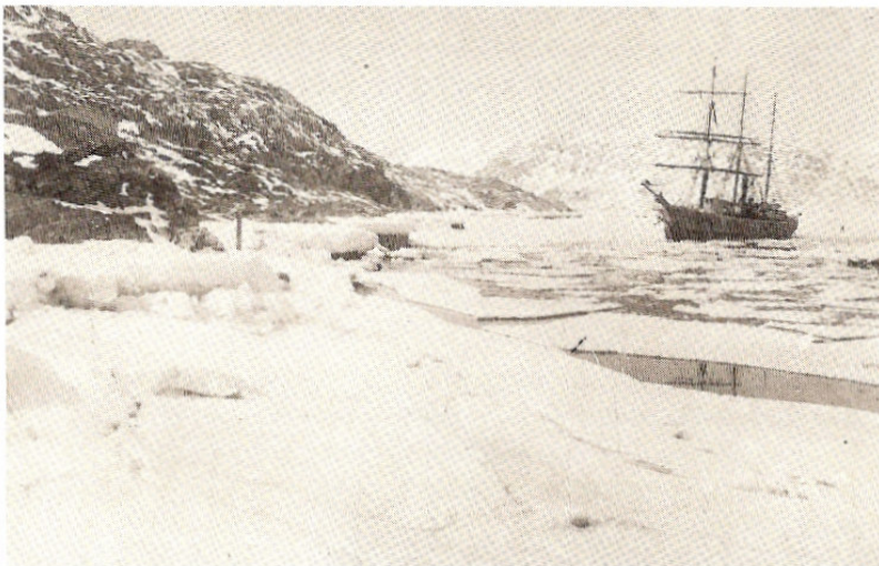
Fox i isen ved Ivigtut 1922.