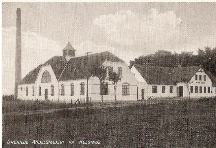
Ørekilde mejeri ca. 1925.