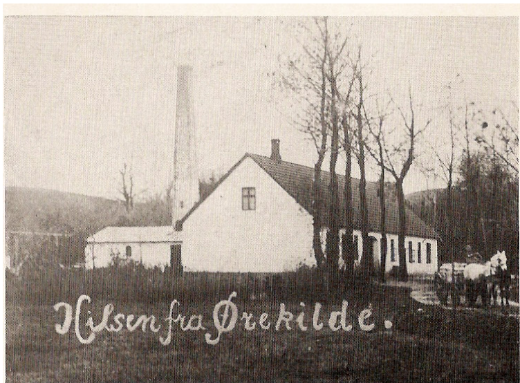
Ørekilde mejeri ca. 1890.