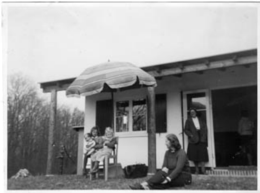
Malene og Lone under parasollen på terrassen – med en meget livagtig dukke.