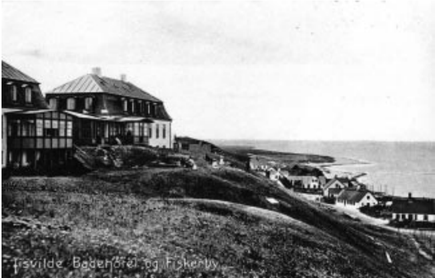
Tisvildeleje Badehotel på toppen af hotelbakken og i baggrunden området Ved Stranden, hvor Bent Fabricius-Bjerre fik hus.

den. Hvad skulle det ende med. Jeg var eneste drengbarn i den del af slægten, og nu så det ud til, at den akademiske linie blev brudt, og det hele endte op i øller, tobaksrøg og letlevende piger.