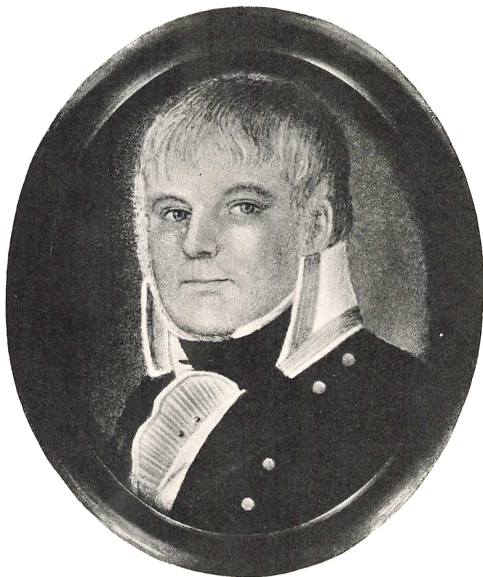
OVE FABRICIUS. 1762—1821. Ejer af Søbygaard. Kirkeinspektør paa Ærø.