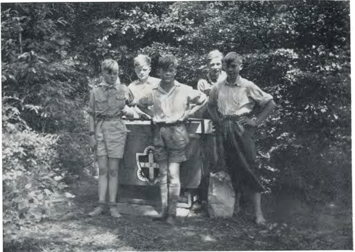
Fra pinsedagene. 1949.

Lejrporten er i 1949 her hos os blevet dyrket ivrigere end nogensinde før, og en af grundene hertil er vel nok den, at vi efterhånden har fået vort lejrmateriel således i orden, så vi nu har komplet udstyr til 8 patruljer, ca. 60 drenge, og det gælder både teltudstyr, kogegrejer, spise-grejer, rygsække o. s. v., intet mangler. Det er blevet benyttet meget nu i år, og der er også blevet passet på det, det repræsenterer jo efterhånden en stor værdi.