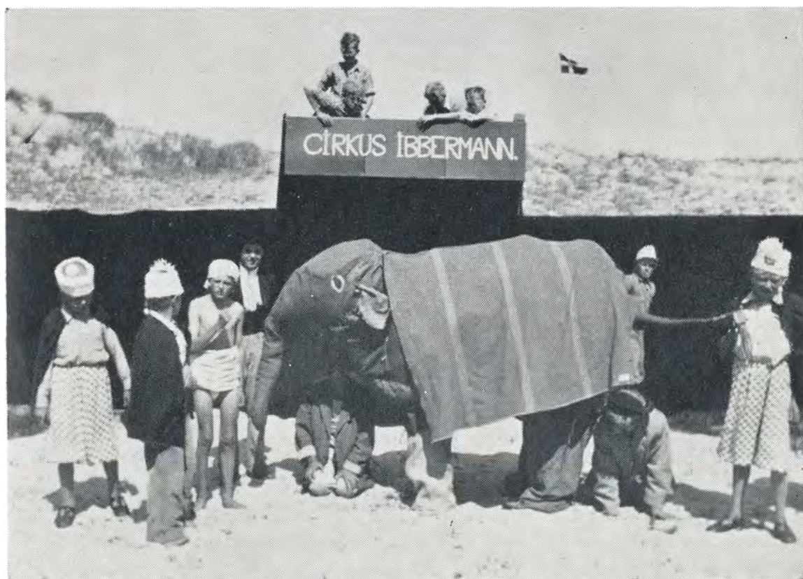
Sjældent eksemplar af indisk elefant. 1949.