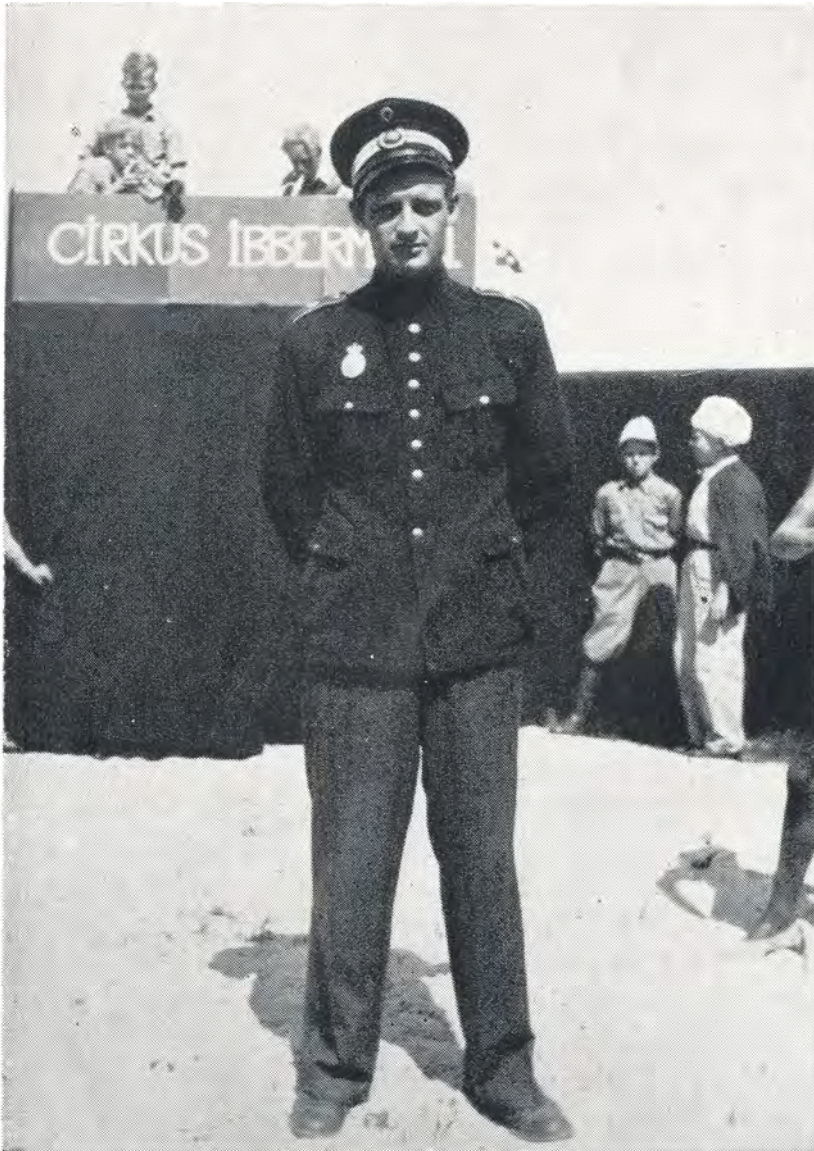
Politiet fører tilsyn i cirkus. 1949.

Det var dejligt vejr den aften, drengene var oplagte, særlig vore to uforlignelige klovner, men de træner jo også hver dag, og publikum var modtagelige og taknemlige, alt i alt syntes jeg selv at fornemme den rette stemning, den rigtige atmosfære over hele linien.