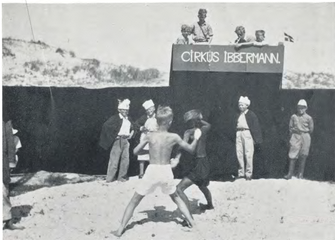
Boksekamp imellem hvid og sort. 1949.