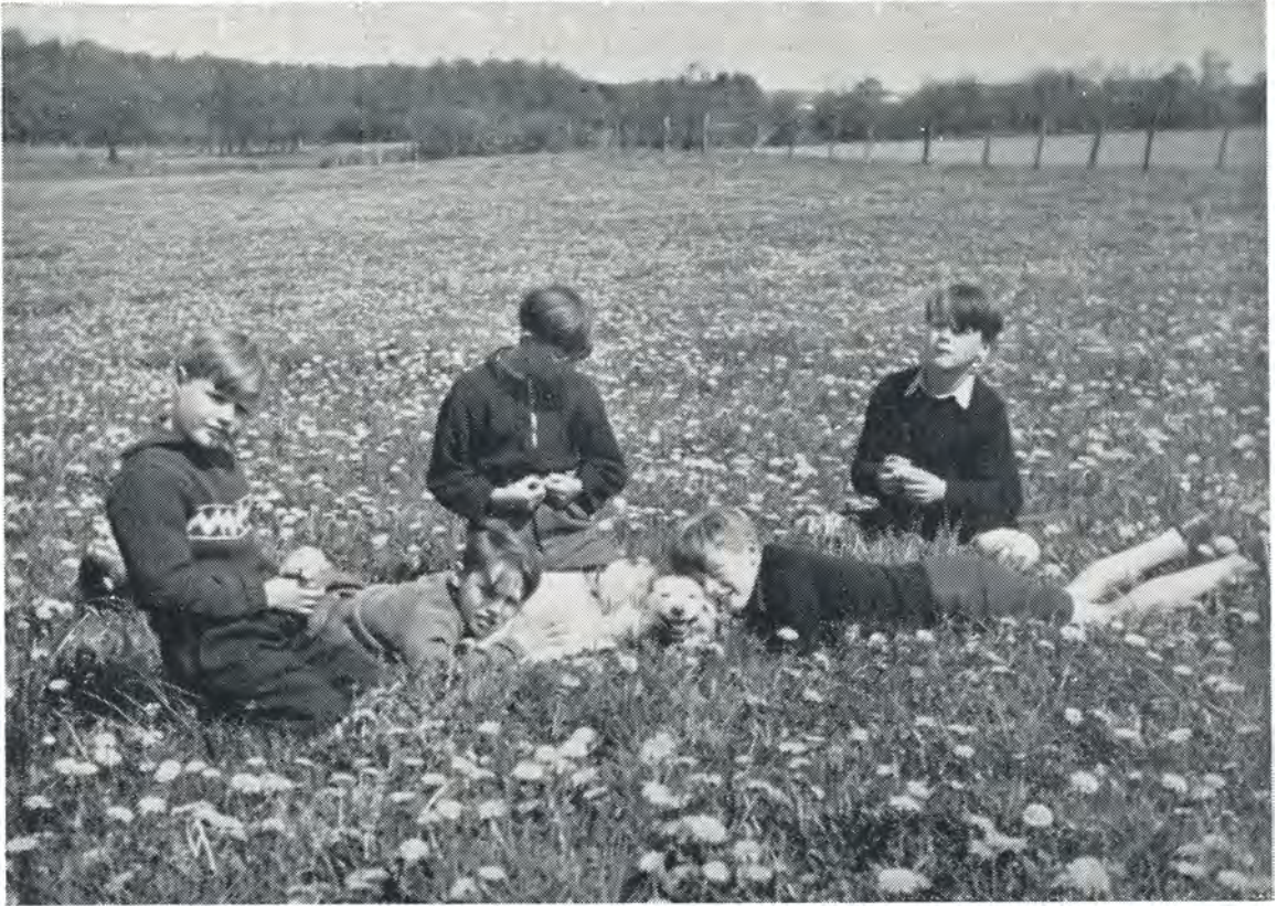
Forår ved Landerupgård. 1949.

blev efter nogle dages forløb indlagt på sygehuset, hvor han lå uden bevidsthed det allermeste af tiden, indtil han døde.