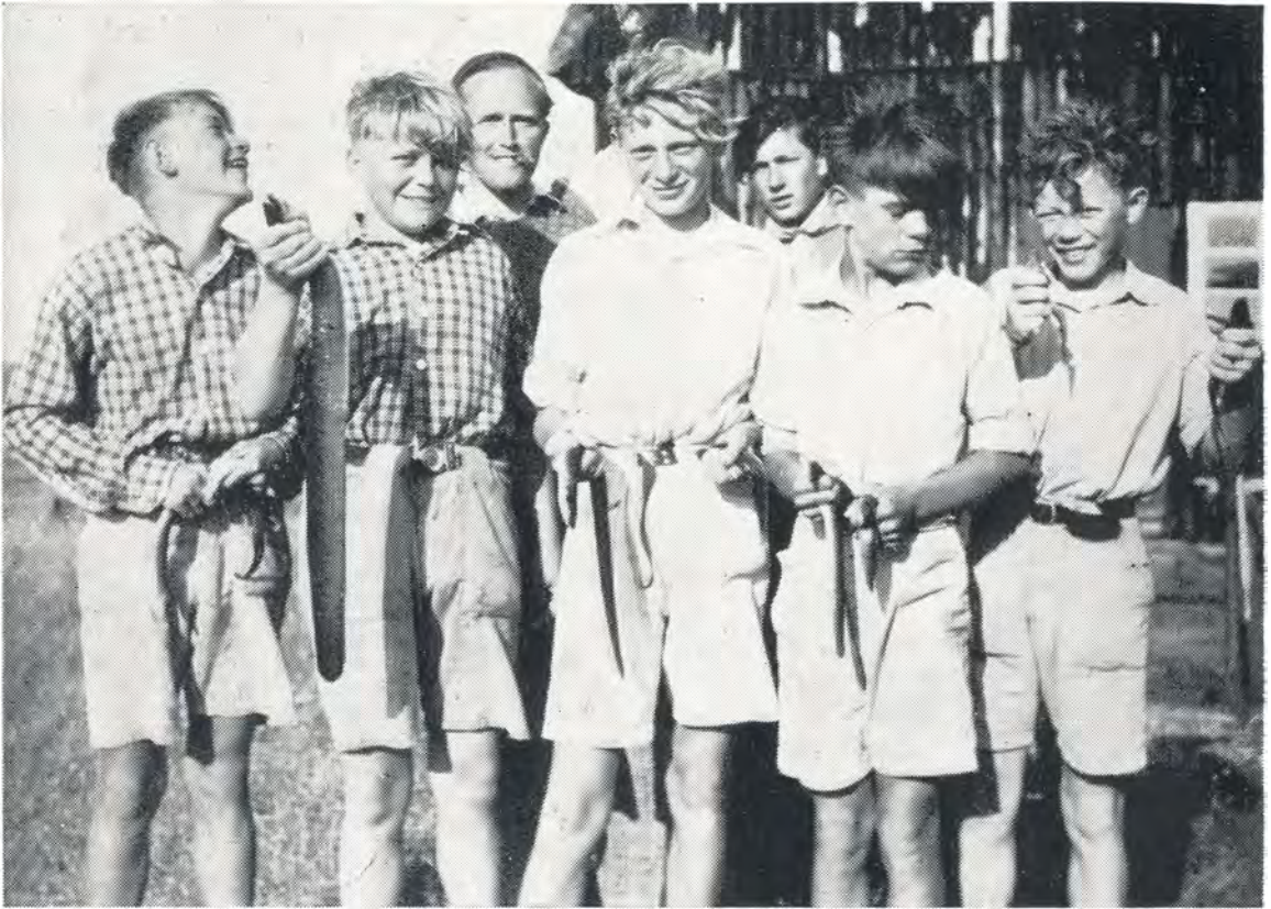
Dygtige ålefiskere. 1949.