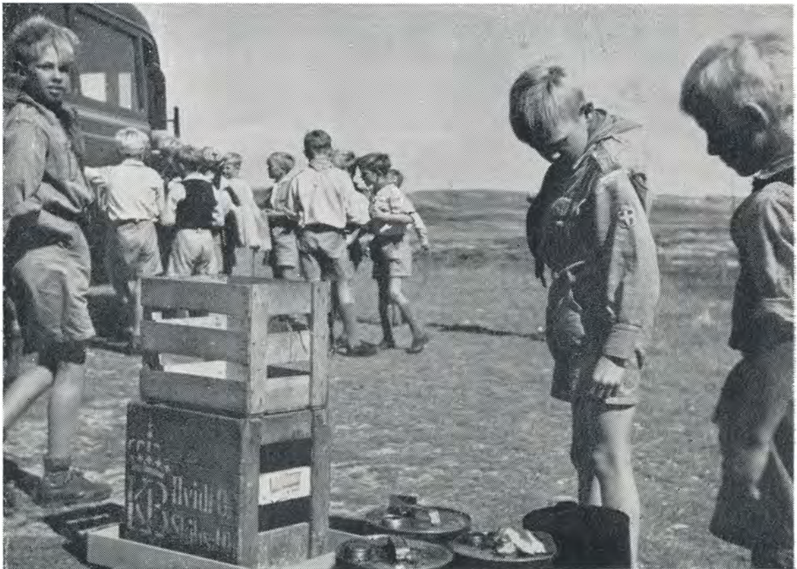
II. hold skal forlade lejren. 1949.