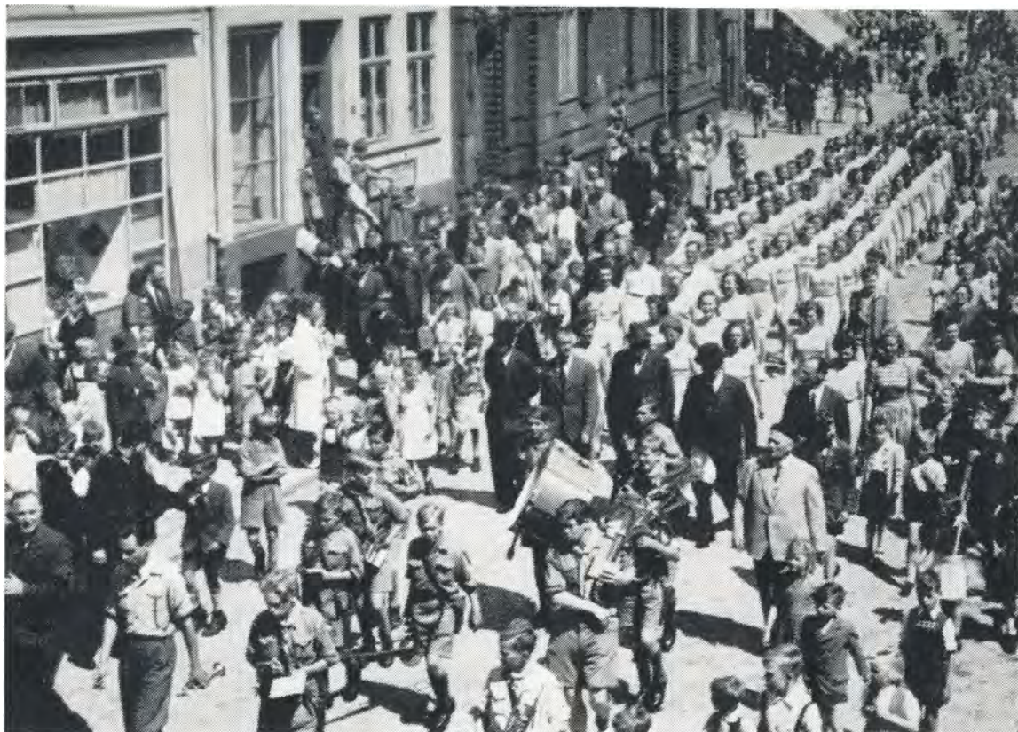
Fra det danske årsmøde i Husum 12. juni 1949.

sted, var der det overalt i Sydslesvig, og trods den strømmende regn var der overvældende tilslutning til møderne alle vegne. Men, hvordan ville vejret blive næste dag, når de store friluftsmøder skulle holdes i Flensborg, Slesvig, Husum, Tønning o. s. v., det tegnede ikke for godt! Og tænk, så vågnede Sydslesvig på årsmødedagen op til en strålende solskins-sommersøndag, og sådan holdt vejret sig hele dagen, det var vidunderligt!