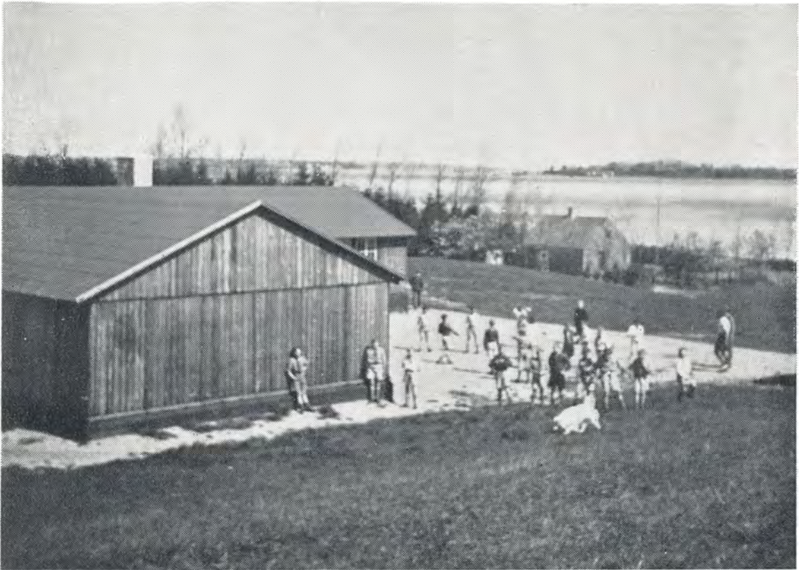
Fra week-end-lejren på »Lyngsborg«. 1949.

af patruljerne klarede det hele fint, kun en af dem glippede det lidt for. Fjorten dage senere var der atter tilrettelagt en orienteringsøvelse, men denne gang ved dagens lys, og heri deltog 6 patruljer.