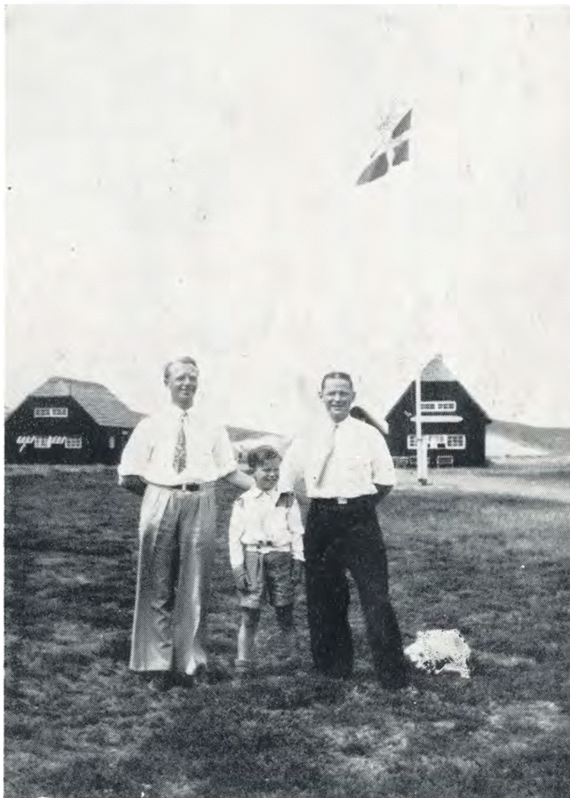
Far og søn nyder opholdet i lejren i lige høj grad. 1949.

Det største øjeblik blev dog, da Kong Frøderik den IX viste sig på balkonen! Det store folkehav jublede, Kongen holdt en kraftfuld tale og