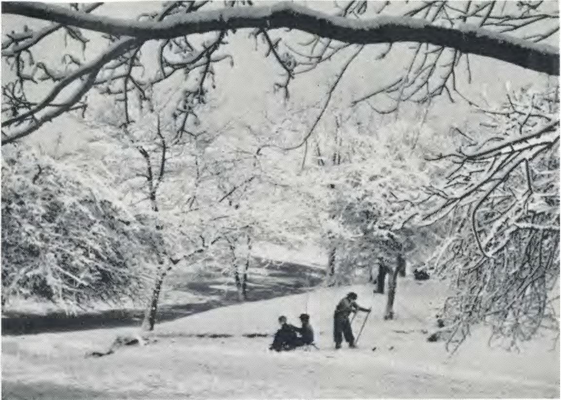
Fra parken ved vintertid. 1949.