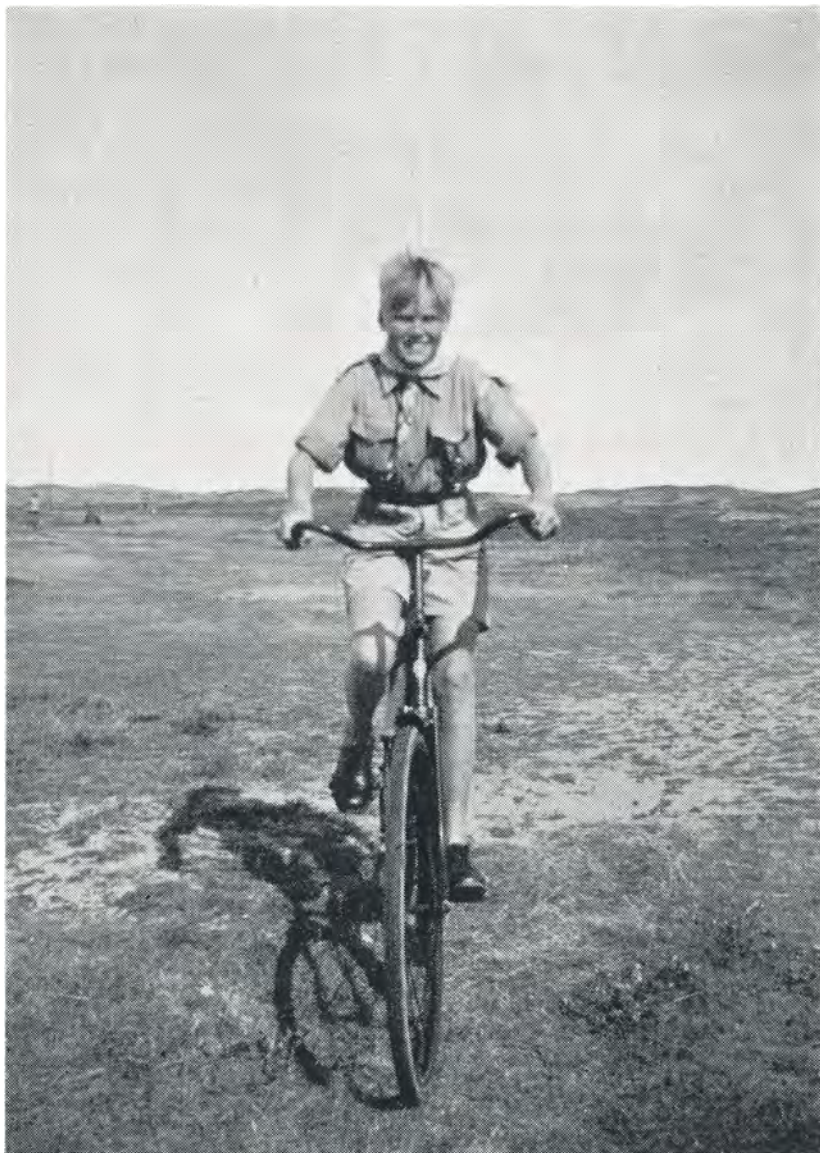
Så nåede vi derud. 1949.

Det er tidligt en søndag morgen. Alt ånder fred og ro, endnu ligger duggen og glimter i solskinet, og de eneste lyde, man hører, kommer fra kostalden, hvor der skramles med mælkejunger. Lidt efter kommer flere lyde til, og pludselig åbnes et vindue, og tonerne af »Den