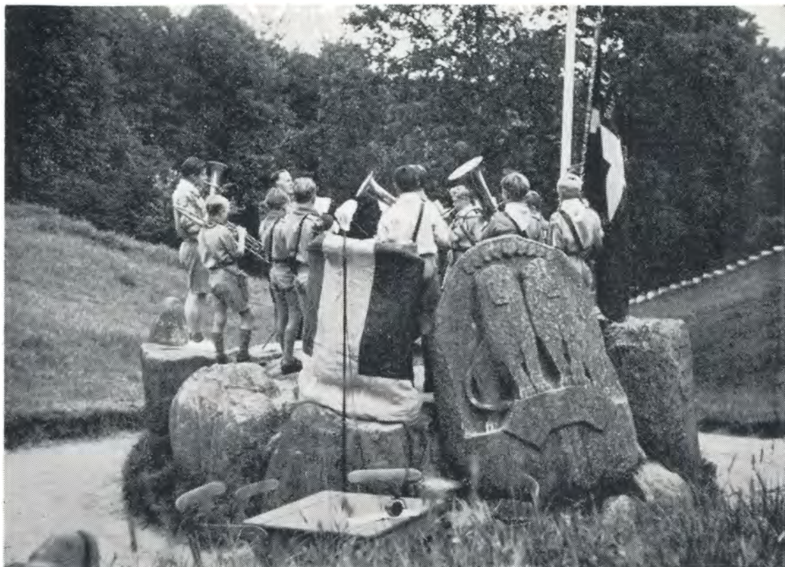
Vort orkester spiller ved talerstolen på Skamlingsbanken. 1949.

drengene, indtil de små rykkede ind og tog lejren i besiddelse. Ind imellem havde vi besøg af en mængde gamle drenge, adskillige med deres koner og nogle med både kone og børn og foruden dem mange andre gæster. Vi var som sædvanlig på besøg med drengene både i Bjerregård og i Haurvig, og til sommerlejrefesten stævnede folk til gengæld ned til os. Da vi lukkede lejren, var vi enige om, at der ikke findes et bedre sted end »Bjærgborg«.