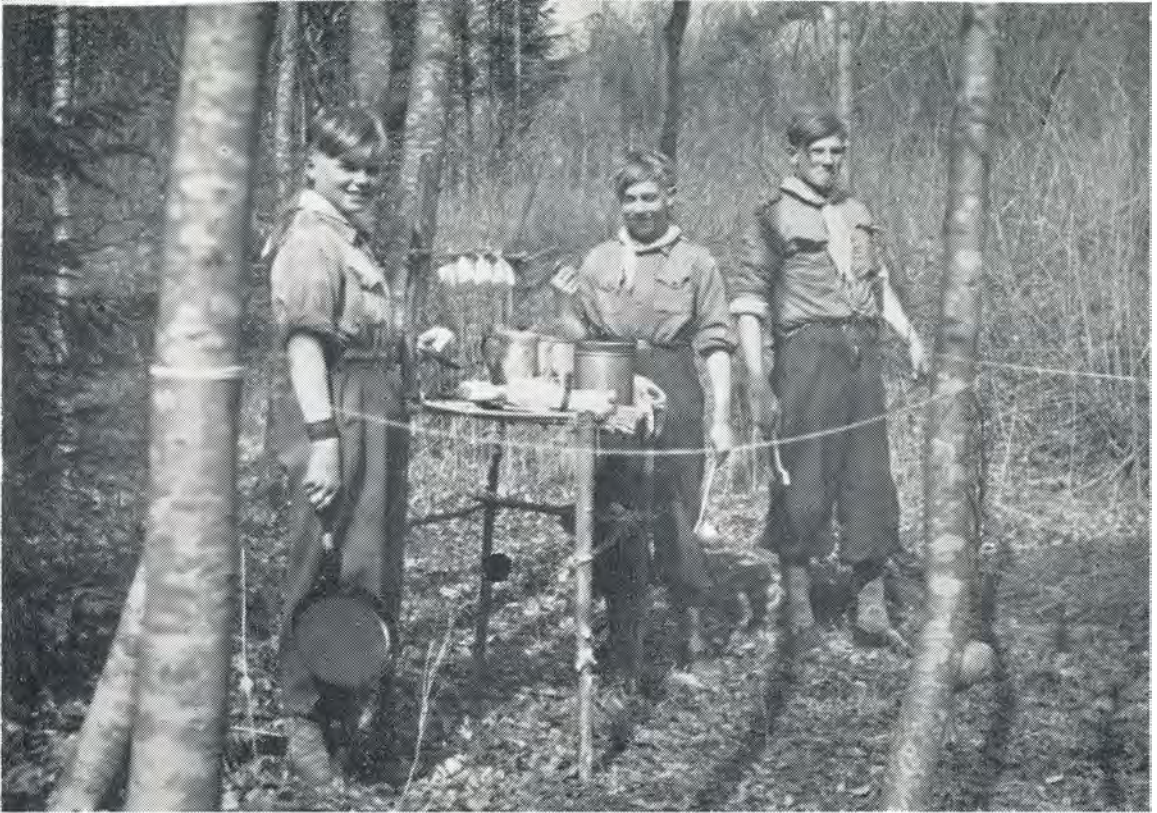
Lejrspot i tidligt forår. 1949.