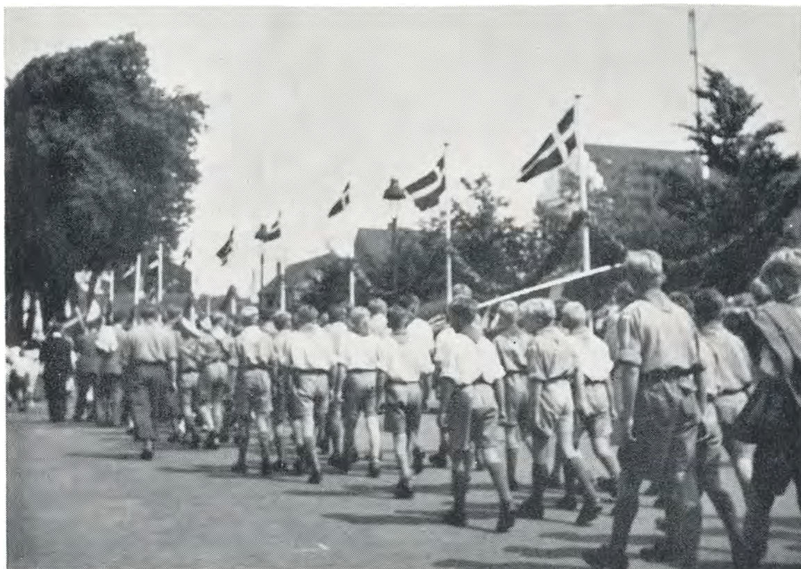
Vort lille korps passerer krigergraven i Fredericia 6. juli 1949.