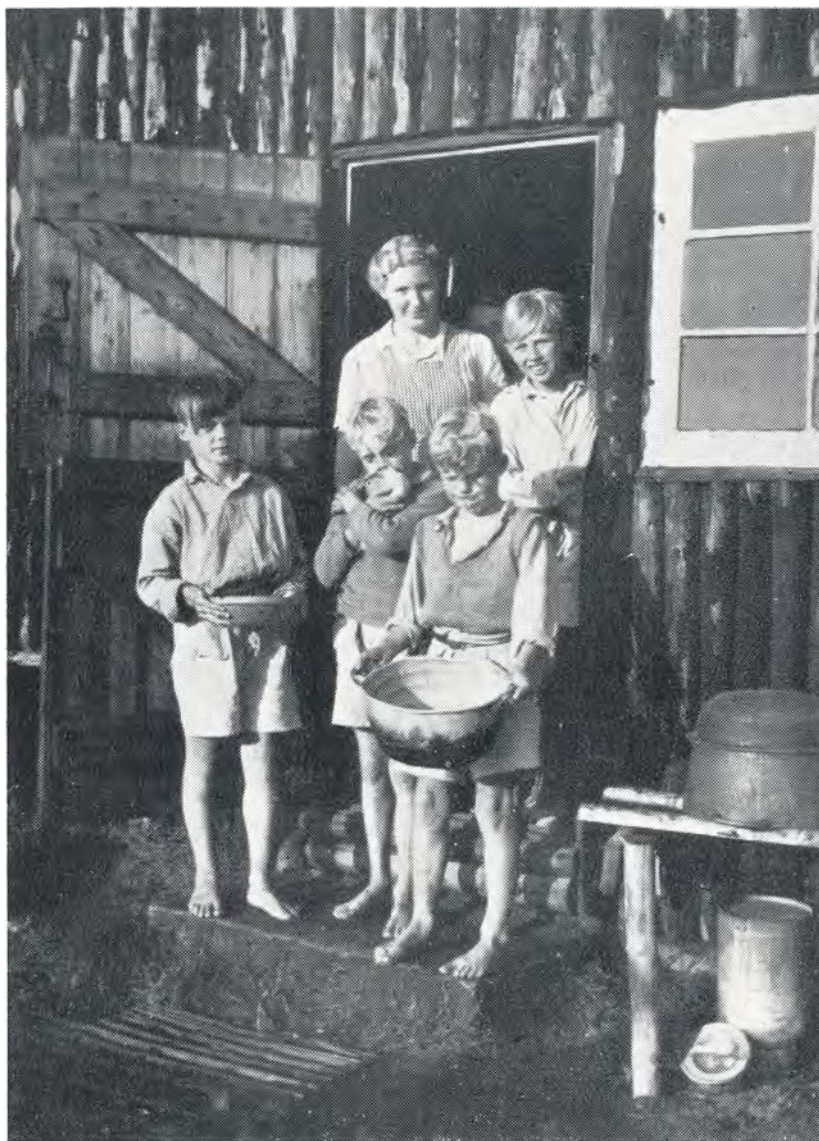
Køkkendrene i arbejde. 1949.

spillede orkestret et par nationale sange. 6 faner paraderede ved mindestenen, og efter at mindepladen var afsløret, blev der nedlagt mange smukke signerede kranser bl. a. fra den danske hær, fra Sdr. Vilstrup kommune, soldaterforeningerne i Kolding, Grænseforeningen, DAF og