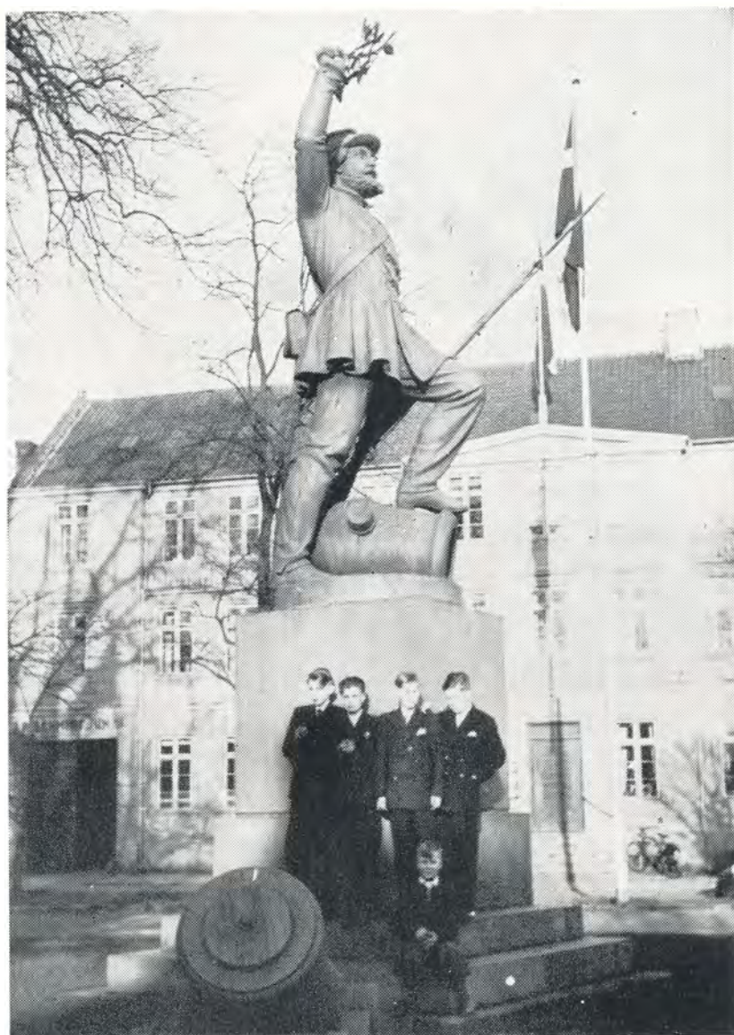
Ved »Landsoldaten«. 1949.