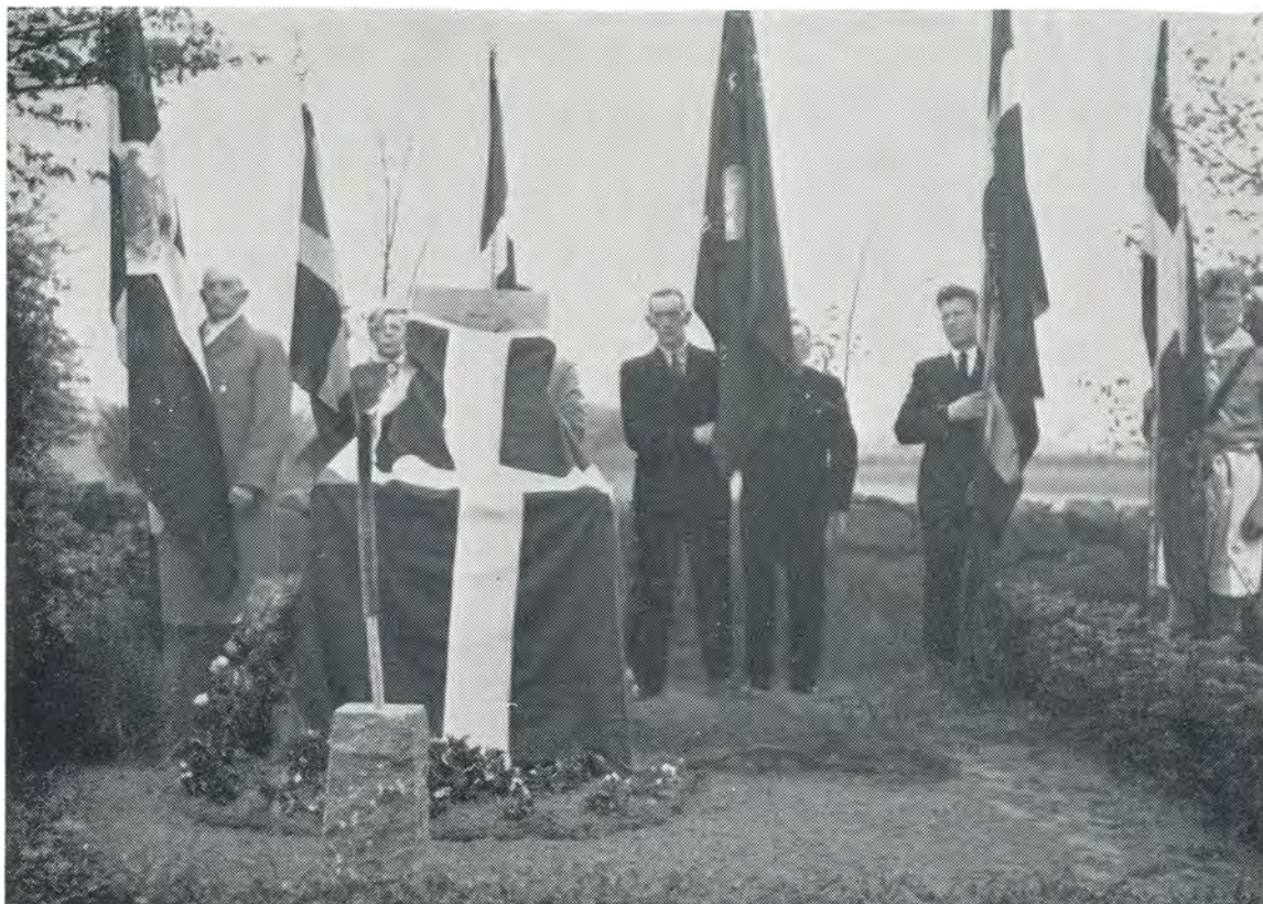
Ved krigergraven på Sdr. Vilstrup kirkegård 7. maj 1949.