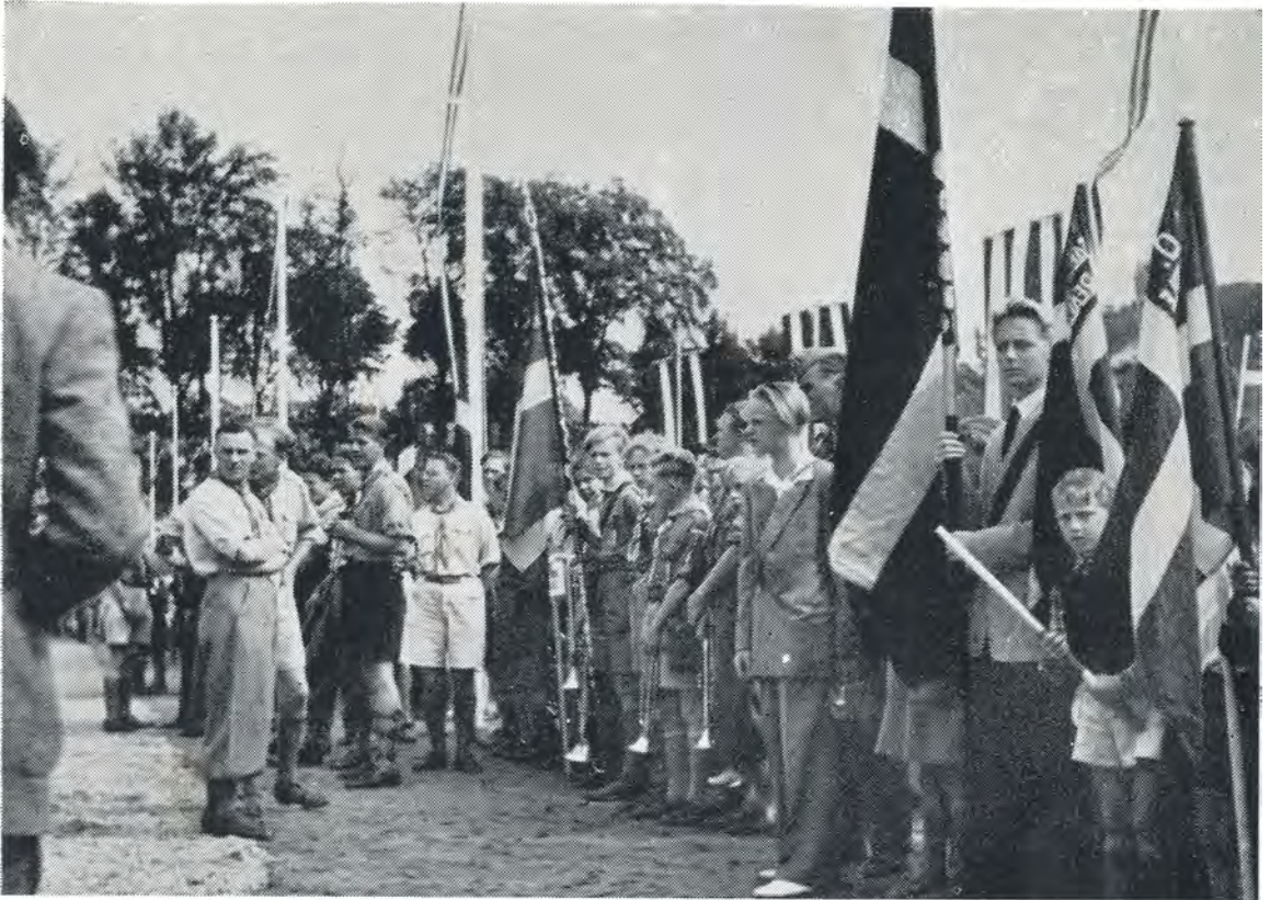
Medens der ventes på kongen. 6. juli 1949.