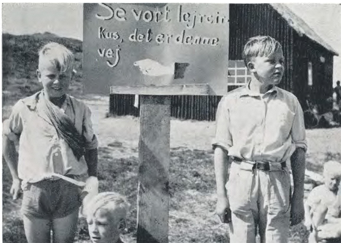
Vil I med i cirkus? 1949.