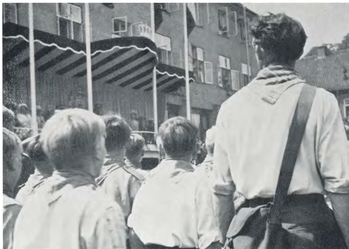
Honnør for Hans Majestæt Kongen. 6. juli 1949.