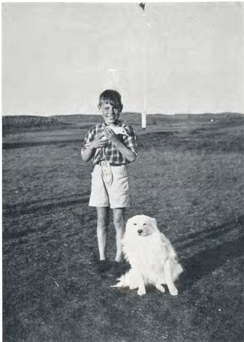
Vi har fanget en mågeunge. 1949.

gik i land, og det blev det ved med at være hele dagen. Efter kongens ankomst marcherede ca. 50.000 mennesker op igennem byen med masser af faner og med flere musikkorps, og her var vi med i toget. Først passeredes Olaf Ryes monument, hvor en afdeling norske soldater stod æres-