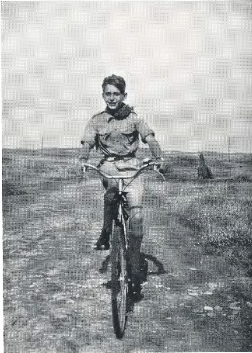
Er det ikke en flot cykel, jeg har? 1949.