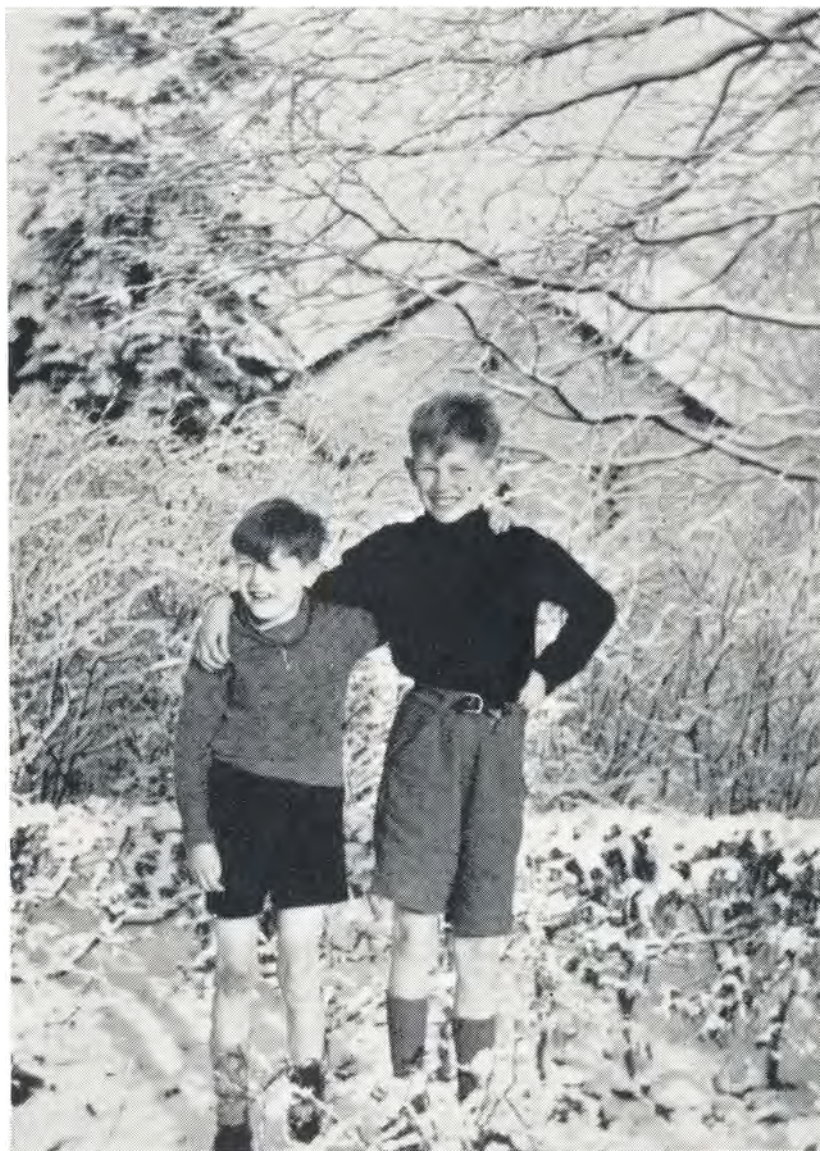
I tror da vel ikke, at vi fryser? 1949.