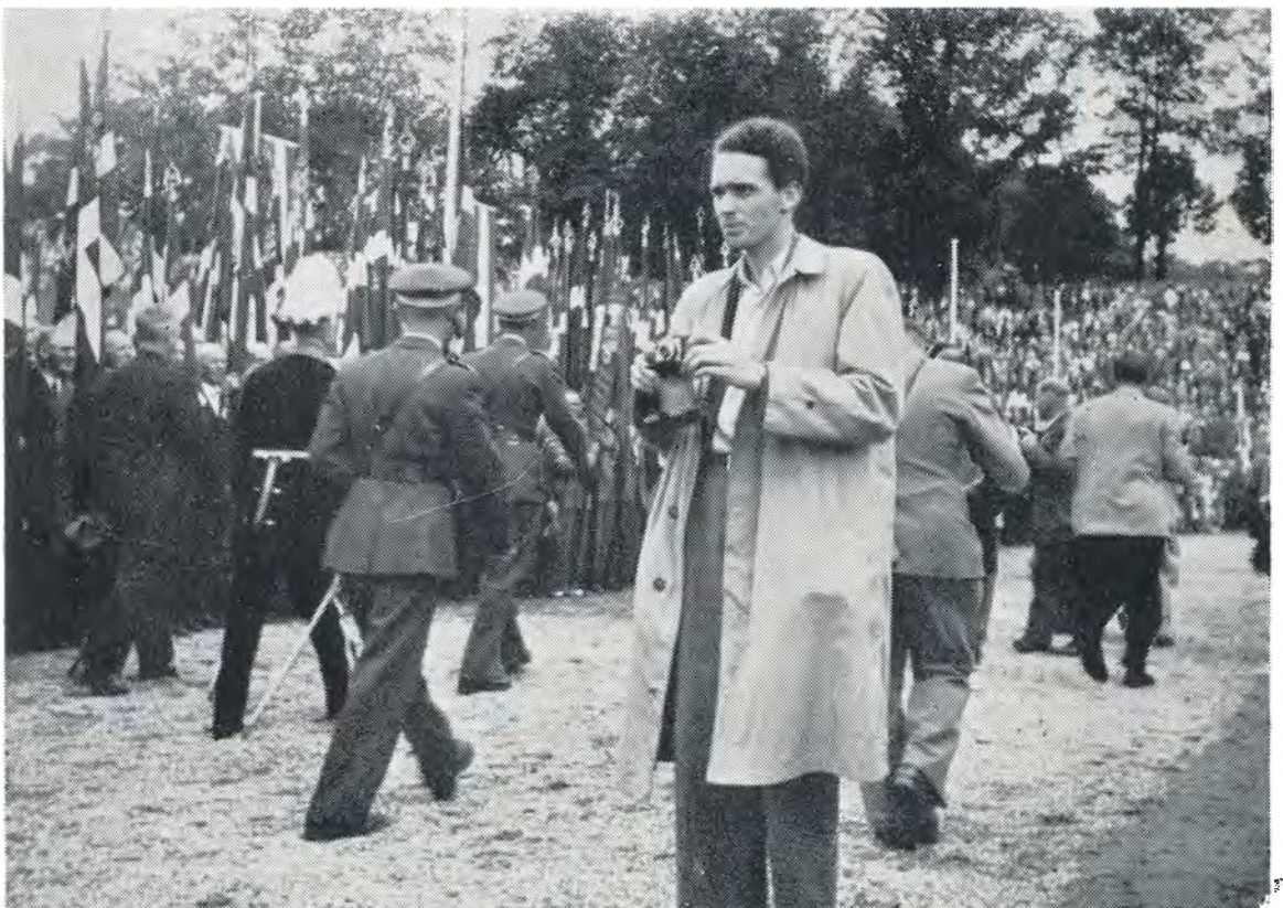
Hans Majestæt Kong Frederik IX passerer vor front 6. juli 1949.