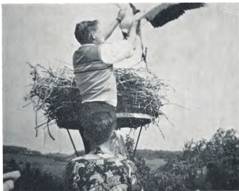
Storkeungerne ringmærkes. 1952.