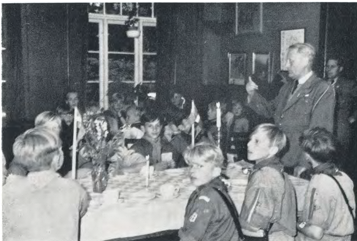
Fra vort drengesforbunds 40 års fest 15. juni 1952.