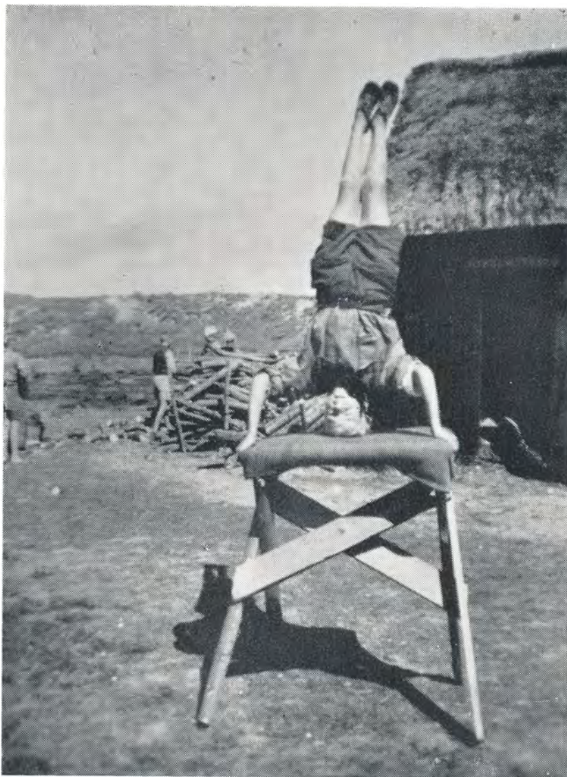
Vor hjemmelavede buk. 1952.

Den 13. og 14. september deltog vi i F. D. F.s distriktsstævne i Vejle