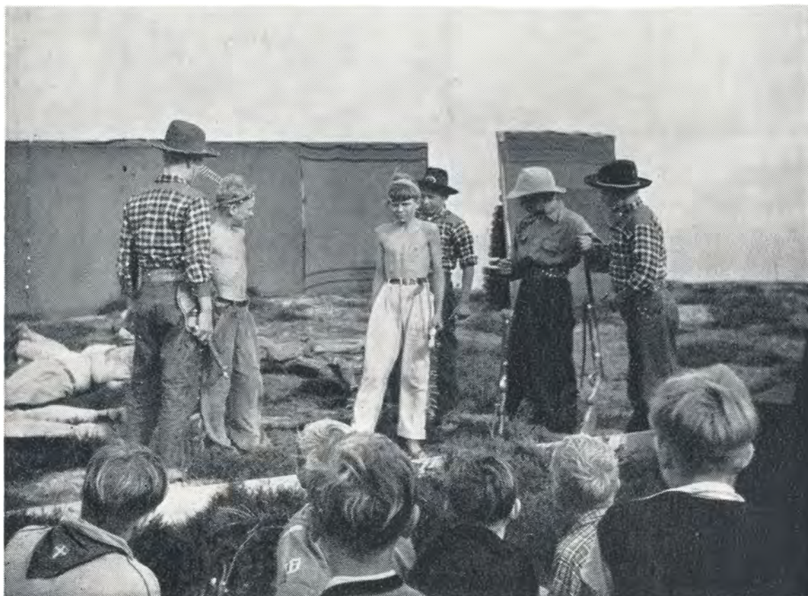
Generalprøve på »Smilende Øje« — wild-west komedie i 7 akter. 1952.

blev nødt til at blive der en dag længere. Det var lige noget, der passede dem, de havde det allesammen så dejligt, hvor de var. Endelig næste formiddag kom vi af sted; men da vi var kommet forbi Haurballegård, var det håbløst for rutebilen at komme videre, og resten af turen blev tilbagelagt tværs igennem terrainet, vejene var fuldstændig spærrede af mægtige driver. Orkestret håber på, at vejret skal blive ligeså godt, når vi nu snart skal derned igen.