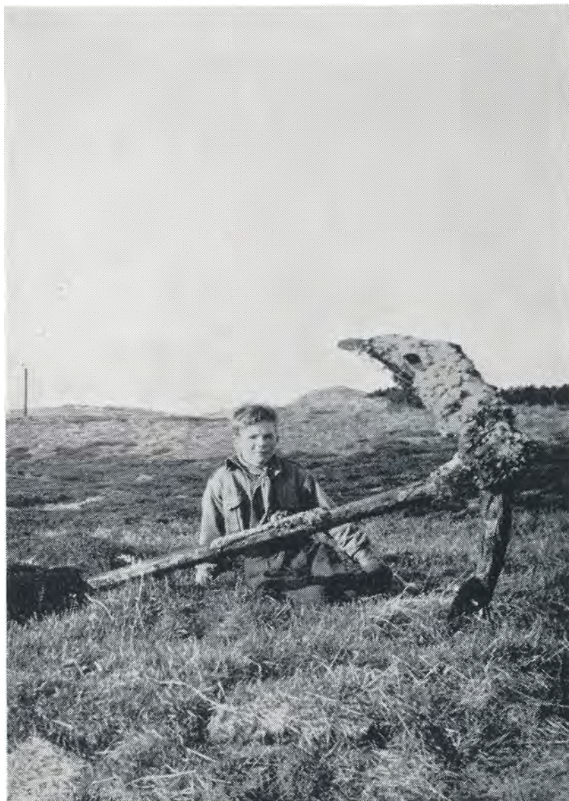
Det gamle skibsanker, som blev fisket op af havet lige vest for sommerlejren.

den flade marsk til Nymindegab. Da måtte »Peter Madsen holdet« have forstærkning af de øvrige, da vejene var fulde af sand. Styrmandene kom også på prøve, da der på begge sider af vejen, der ikke var ret bred, var dybe grøfter, og der skulle vi jo helst ikke have »Peter Madsen« ned. Turen op ad Holmslands klit har jo altid sit særlige præg.