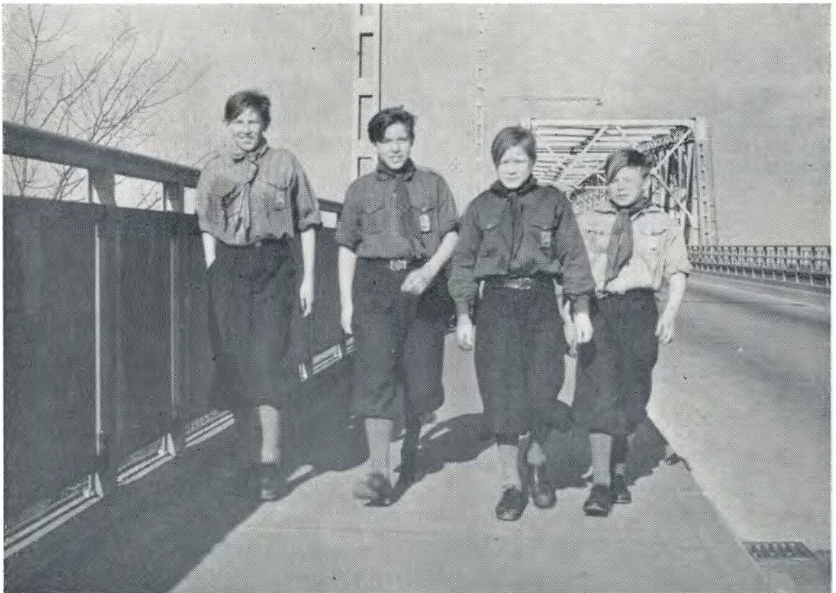
På fodtur til Lillebæltsbroen. 1952.