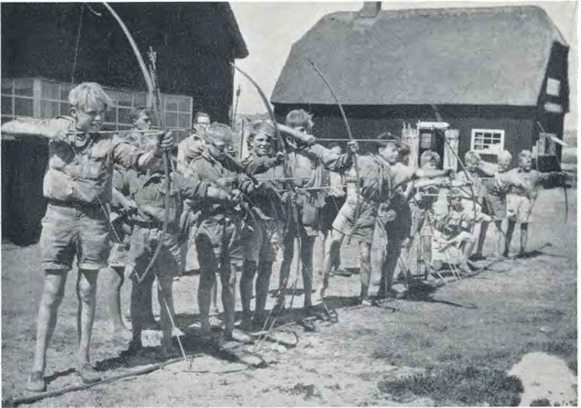
Konkurrence i bueskydning. 1952.

klæder, bindehoser og andet husgeråd dekorativt anbragte sig på og rundt om os.