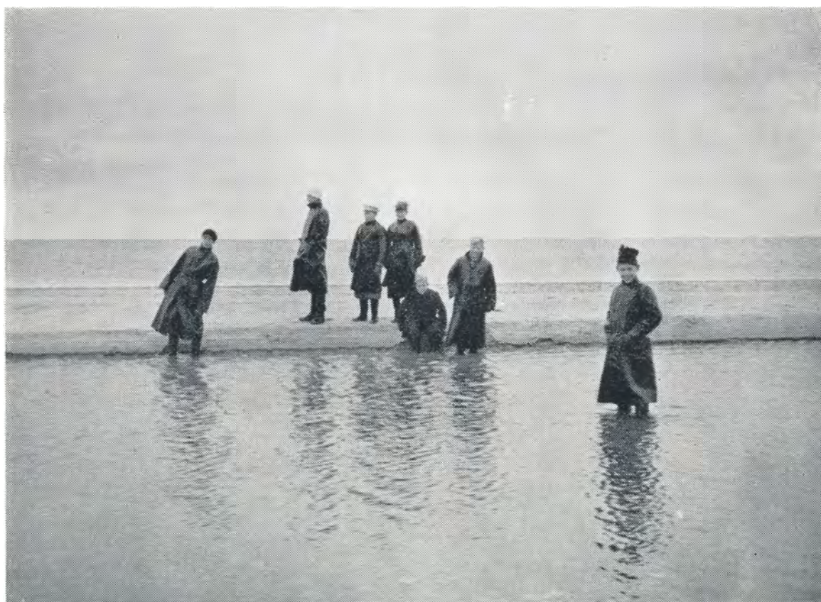
Vesterhavet i stilhed. Efterårsferien 1952.