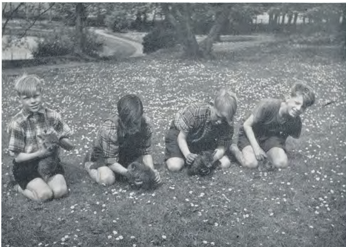
Fire drenge med hver sin ræveunge. 1952.

det samme. Hans kone og moster blev allarmeret, og imens skubbede mester og jeg dodgen op midt på vejen med snuden i den rigtige retning og gjorde klar til indladning. Ved en ølkasses hjælp kom de op, og så kom det spændende øjeblik, om den vilde gå, det er næsten lige så spændende som at få julegaver.