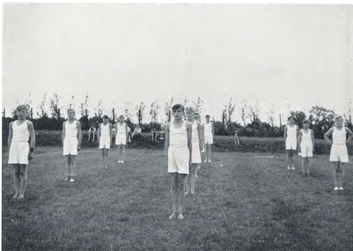
Ved skoleidrætsstævnet i Hejls. 1952.

eneste dreng opnåede det bedst mulige resultat, idet der blev givet points efter en særlig pointstabel, således at hver centimeter, eller tiendedels sekund kunne blive afgørende for os. Da alle prøver var aflagt, de enkelte drenges points regnet ud og det hele sammenlagt, blev det hele indsendt til trekampens sekretariat, og vi havde nu ikke andet at gøre end at vente og håbe.