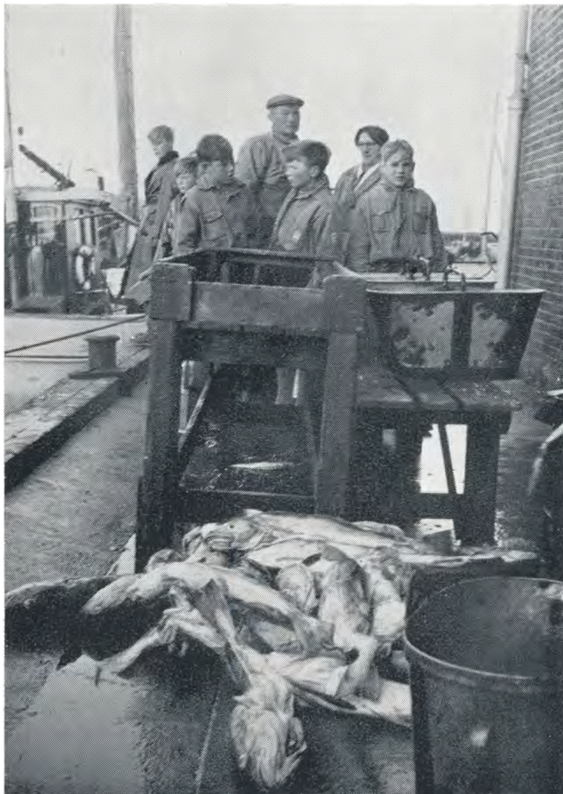
Torsken bringes i land ved Hvide Sande. 1952.

Efterårsferie. Også i år gik turen til sommerlejren, vi cyklede fra gården kl. 7, og havde første uheld i Sdr. Vilstrup, hvor to torpederede