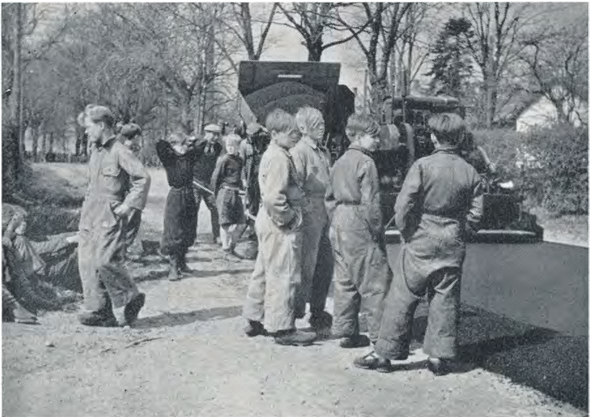
Det store øjeblik, da vejen til Landerupgaard blev asfalteret. 1952.