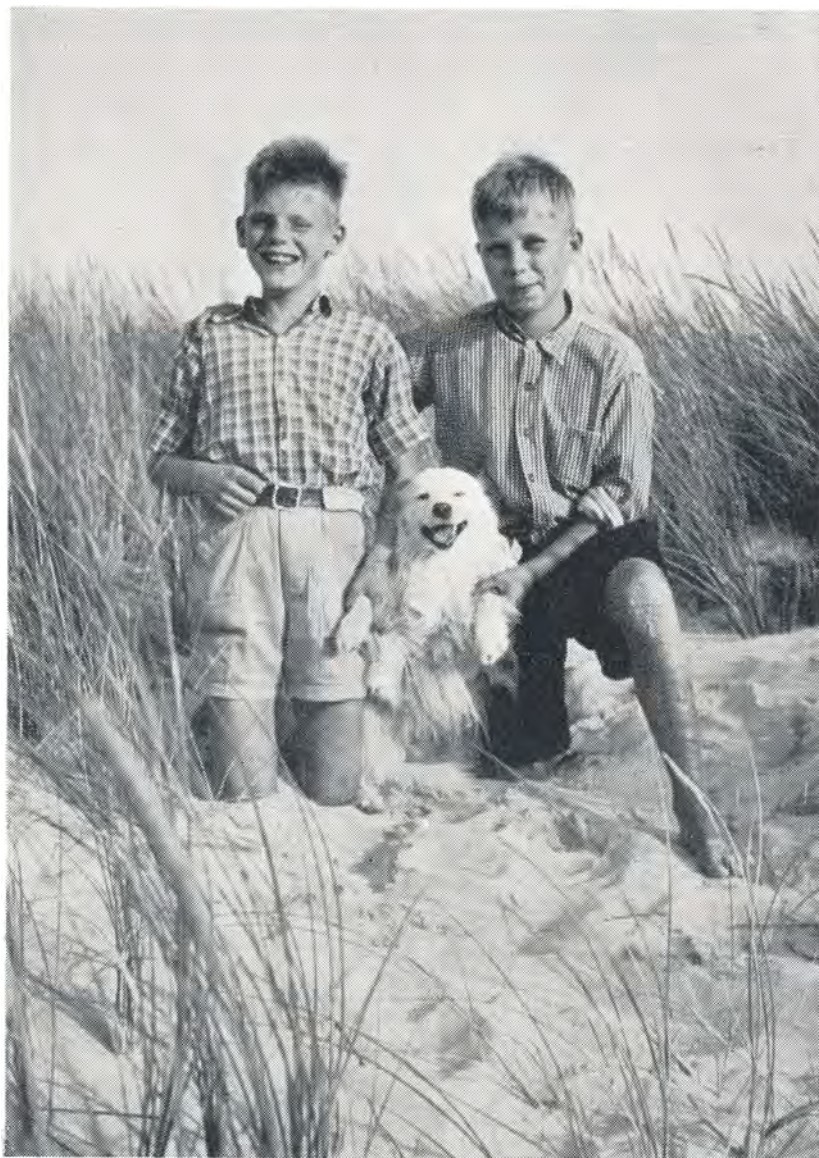
Tre gode venner. 1952.

torvet, hvor faklerne blev kastet i et bål. Byens borgmester talte, og aftenen sluttede med, at alle fremsagde løsnet »Altid rank og sand«. Det var en fin aften, som vi sent vil glemme. Klokken var ca. 12, da vi nåede ud til eksportstaldene, hvor vi skulle sove. Det var med en klam fornem-