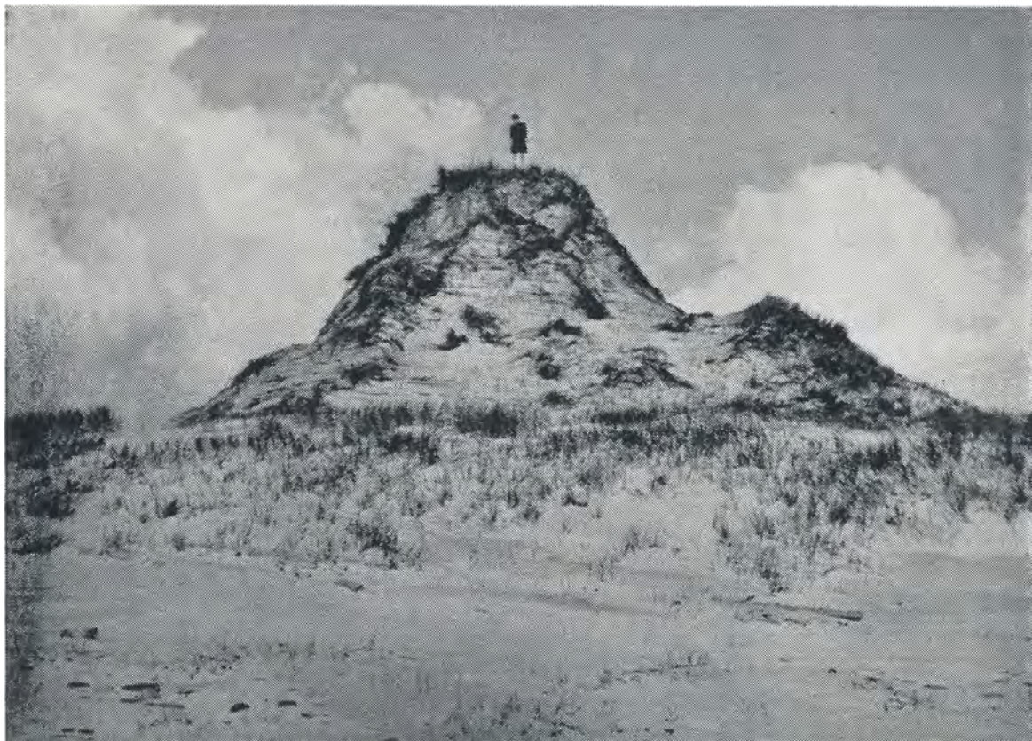
Klitformation på lejrens grund ved Vesterhavet. 1952.