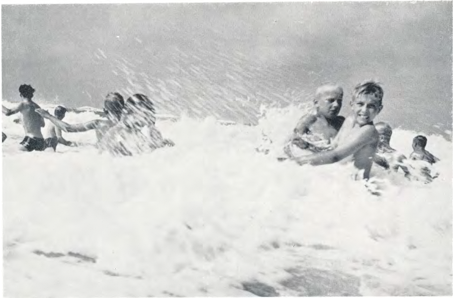
Vesterhavet viser tænder. 1952.