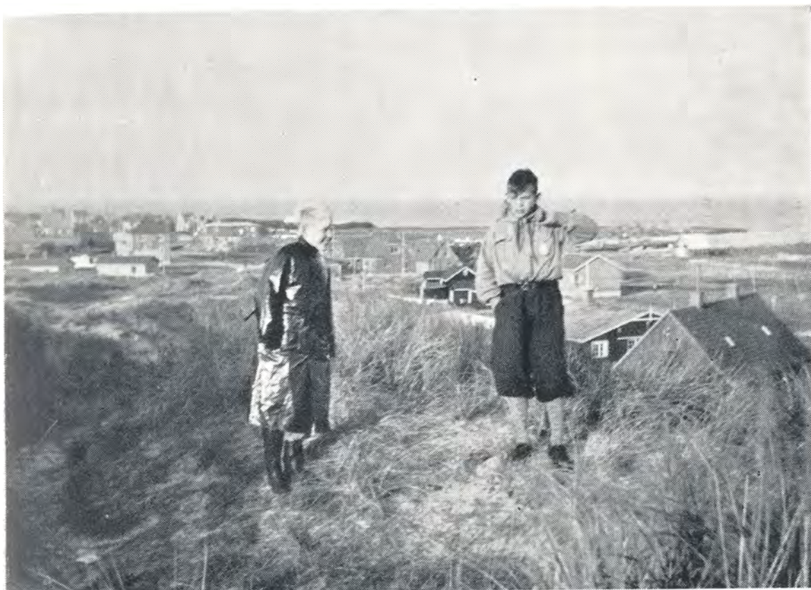
Udsigt over Hvide Sande. 1952.

Eller går du? Bruger du dine ben hver dag til andet end at slæbe dig fra middagsbordet og hen til divaneseeren?