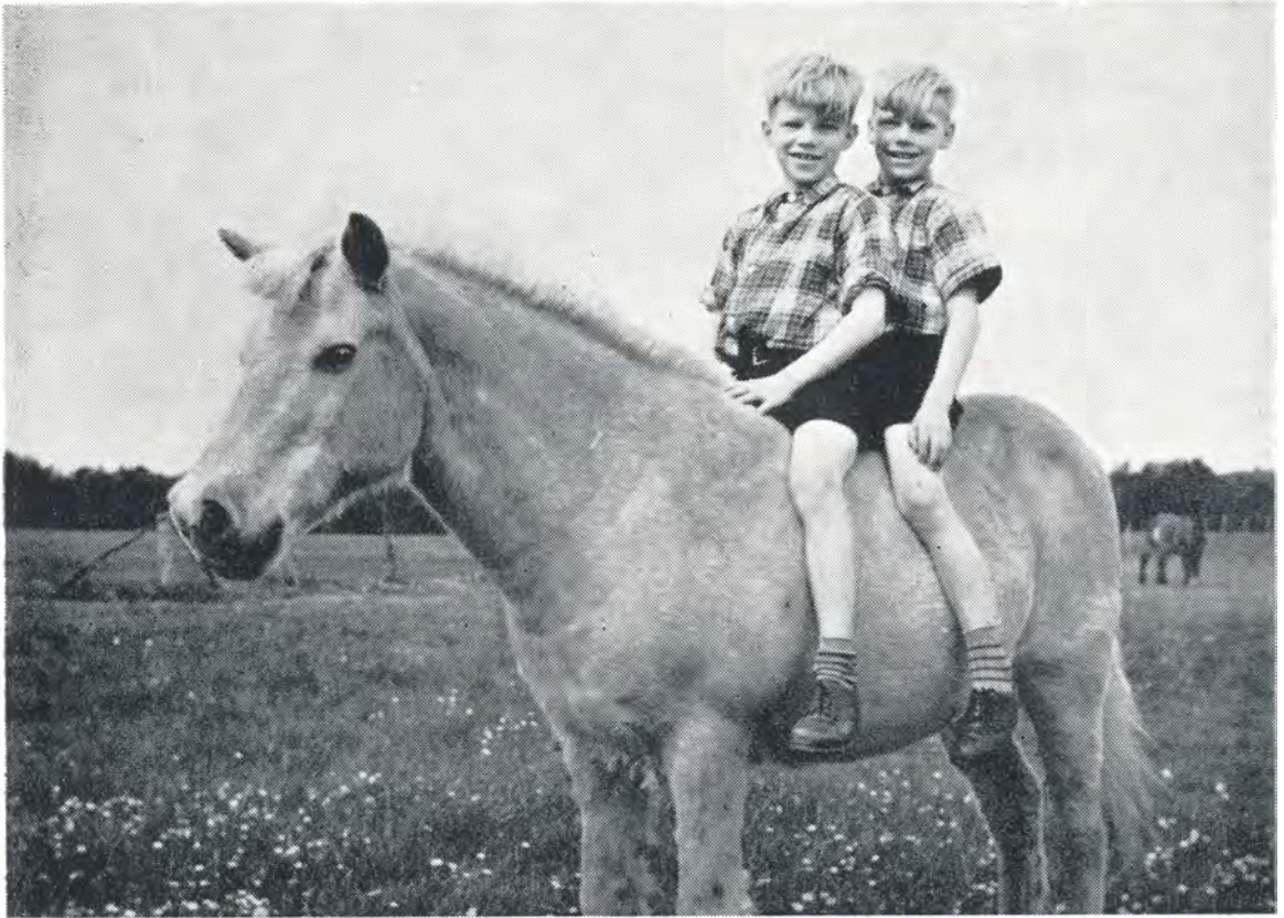
Tvillingerne på ryggen af »Tot«. 1952.

lejrøvelse, hvori deltog indianere, cowboys, beduiner og pelsjægere, ialt 5 patruljer, og i oktober og november har drengene atter dyrket lejrlivet flere gange, men da var ikke teltene, men hytterne i brug.