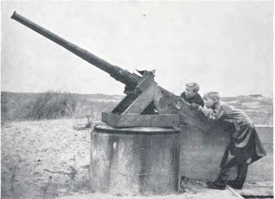
Ude i klitterne står endnu en luftværnskanon — efterladt af tyskerne. -