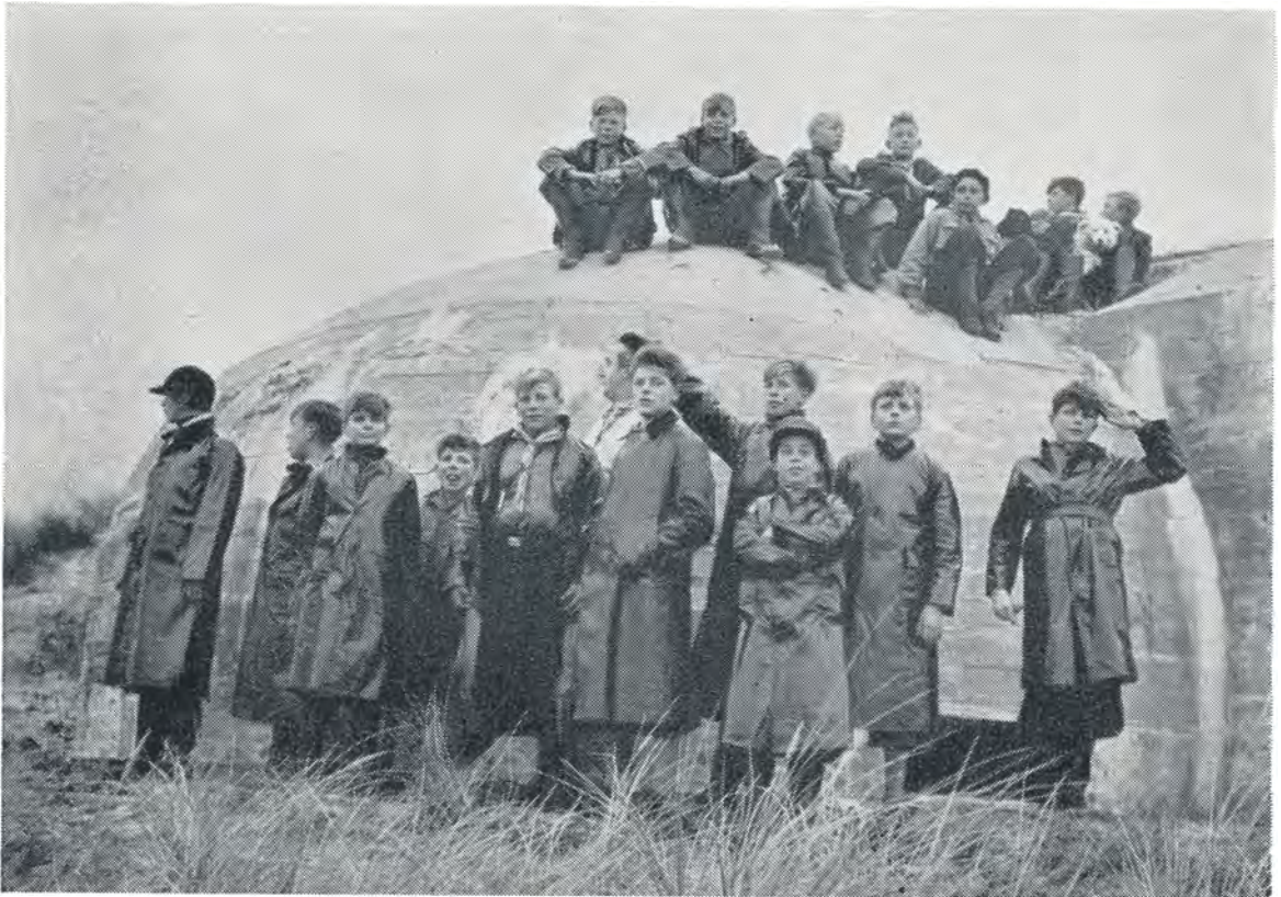
Besøg i fæstningsværkerne ved Nymindegab. Efterårsferien 1952.