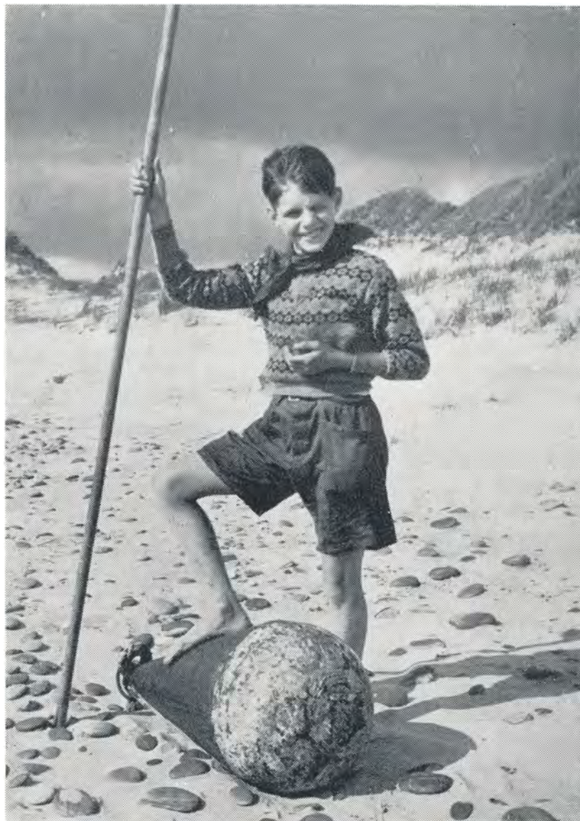
Ved Vesterhavet. 1952.

idrætsstævne i Lunderskov, ved Herslev Husmoderforenings møde i Hvandlund skov, ved Distrikts-idrætsstævnet i Vejle, ved skoleidrætsstævne i Hejls og så naturligvis ved alle vore egne kortere eller længere marchture. Ser jeg protokollen over FDFs arbejde igennem, viser den,