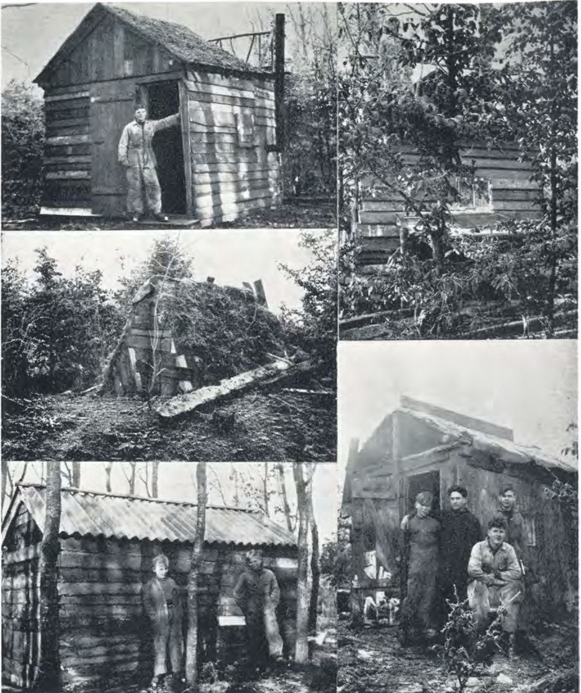
Nogle af hytterne i skoven. 1952.

Turen til Anslet den 10. februar havde sin ganske særlige charme i år, takket være vejret. Medens aftenfesten fandt sted i forsamlingshuset, satte det nemlig i med en vældig nestorm, og da vi næste formiddag skulle af sted, var snestormen på sit højeste, alle veje var blokerede, og tilmed lå rutebilen, hvormed vi skulle have kørt til Kolding, væltet i en grøft. Det var i det hele taget ganske umuligt at komme derfra, og jeg måtte fra mit kvarter hos familien Lindberg ringe rundt til alle de store gårde, hvor de forskellige drenge var indkvarteret og sige til dem, at de