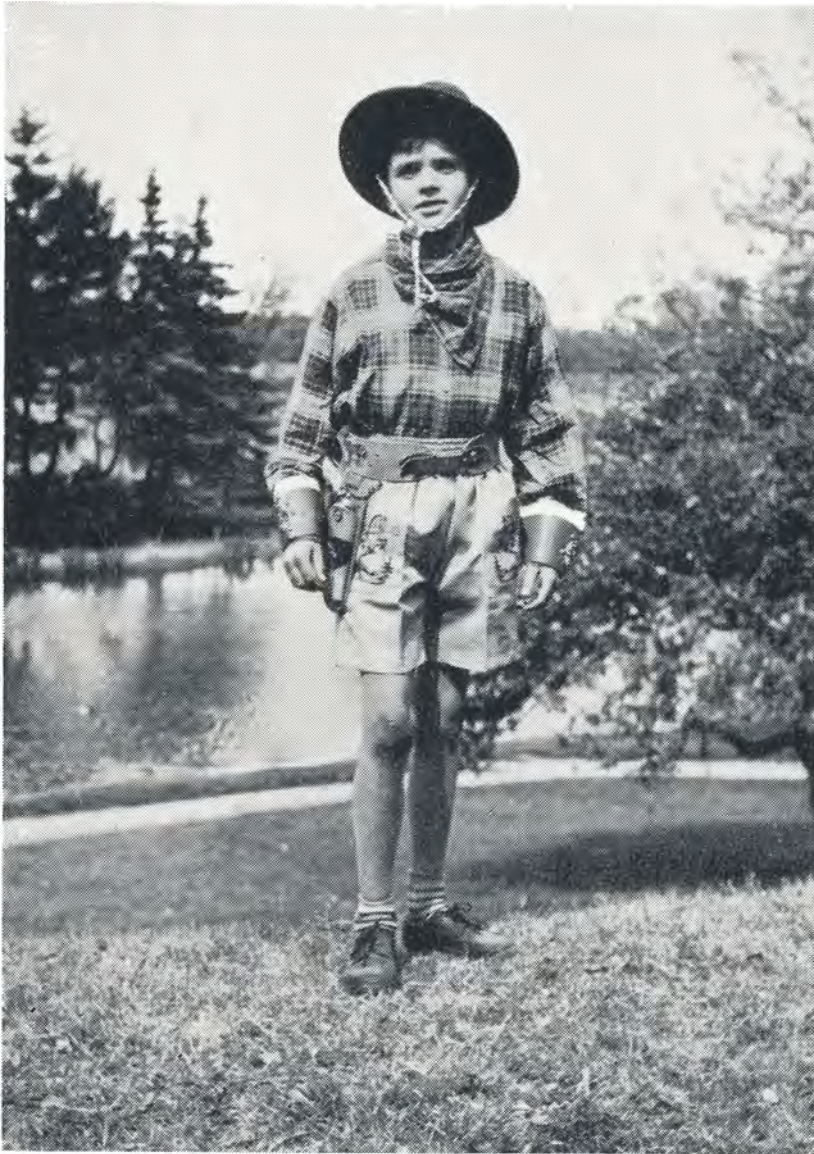
Sheriffen Hopalong. 1952.

Her blev han fundet ud på aftenen af en togmand og afleveret på kontoret. Ved opringning hertil fik vi aftalt, at han skulde stige ud i Eltang, og Slothus blev allarmeret.