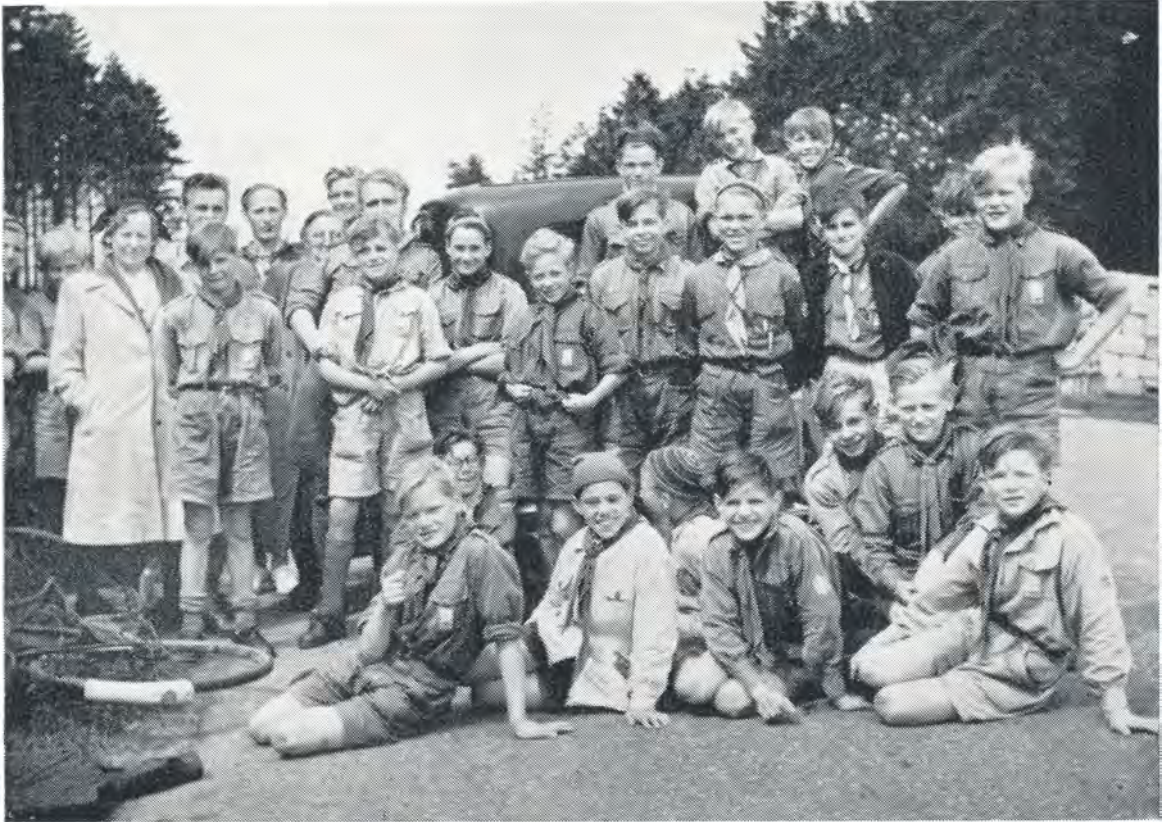
Hvil på pinseturen til sommerlejren. 1952.

måtte gøre holdt lidt. Mens vi ventede, gav orkesteret et nummer for arbejderne, som til tak samlede 20 kr. ind til os. Den slags er med til at gøre turen til en uforglemmelig oplevelse.