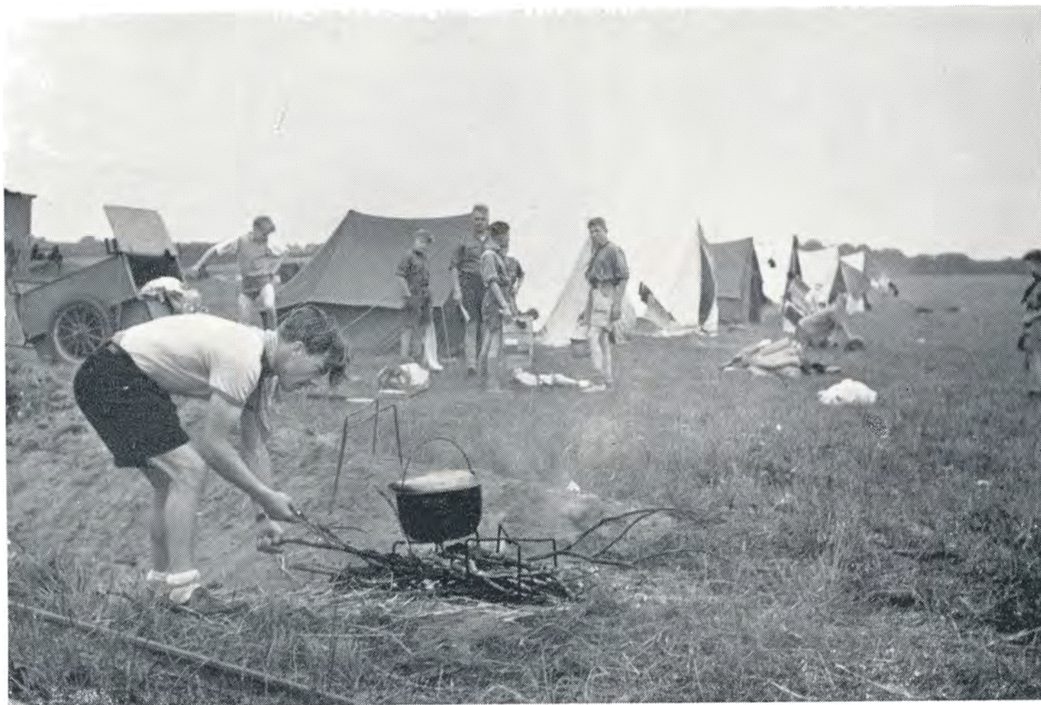
På vej til Vesterhavet, 1952.