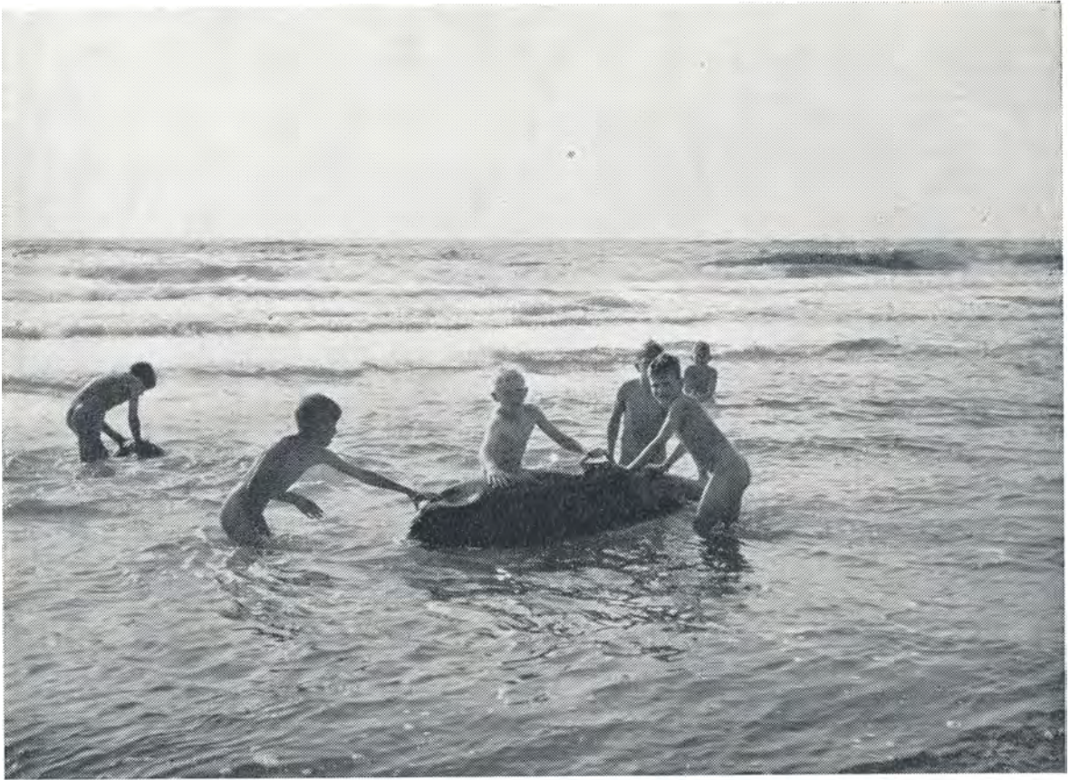
Leg i havstokken i den synkende sol. 1952.