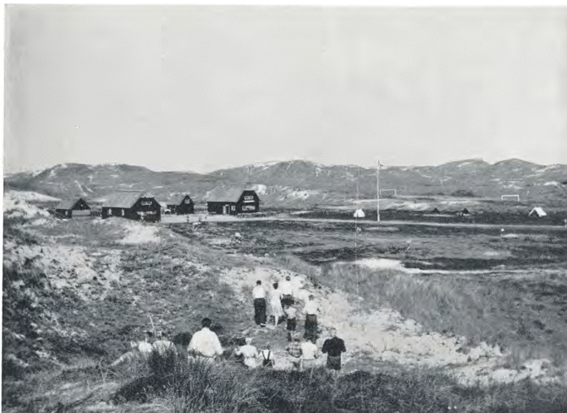
Hjem fra morgensang på Slogbjerg. 1952.

I, der var med, glemmer f. eks. næppe den aften, da vi, efter at drengene var gået til køjs, lå lejrede en stor flok om bålet i den stille sommeraften. Da følte vi rigtig, at vi var hjemme i vor egen lejr, Bjærgeborg, følte, hvordan også denne plet er med til at binde os sammen.