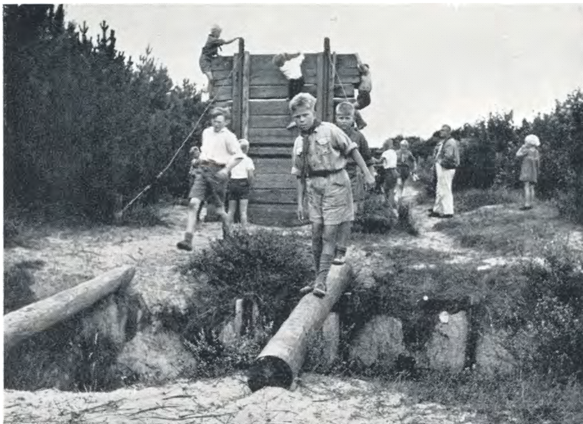
Drengene prøver soldaternes feltbane. 1952.