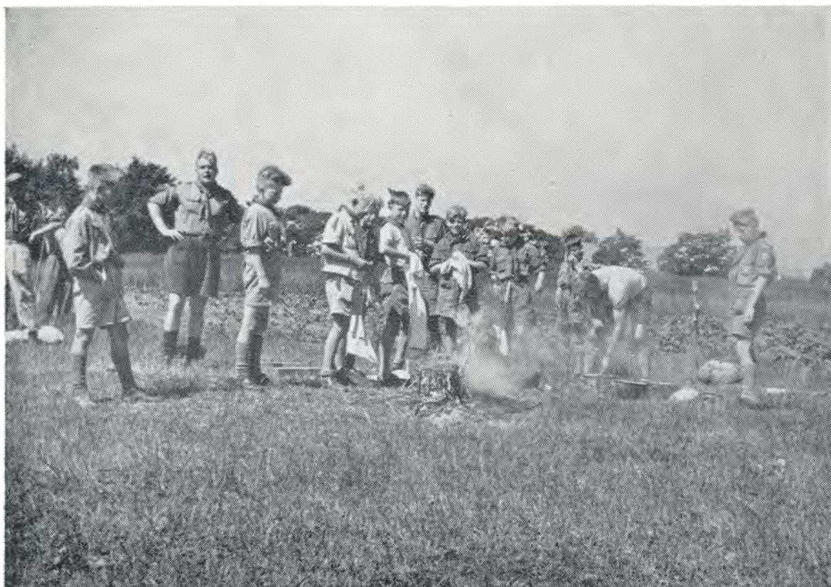
Fra Vesterhavsturen. 1952.

hare, så det var nemt. Om aftenen var der underholdning, men drengene var trætte, så vi skulle tidlig i seng.