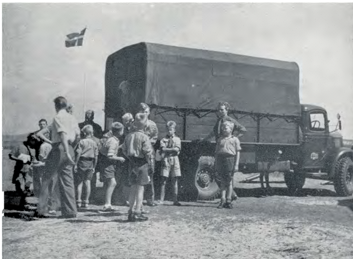
De små drenge afhentes i en stor militærbil. 1952.