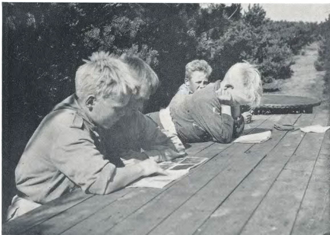
En rolig stund i plantagen. 1952.

Og nu, da julen atter er rykket nær, er gaverne derovre fra den anden side af jordkloden igen begyndt at indfinde sig, og jeg er sikker på, at der vil blive nok at glæde sig over i den retning også i denne jul.