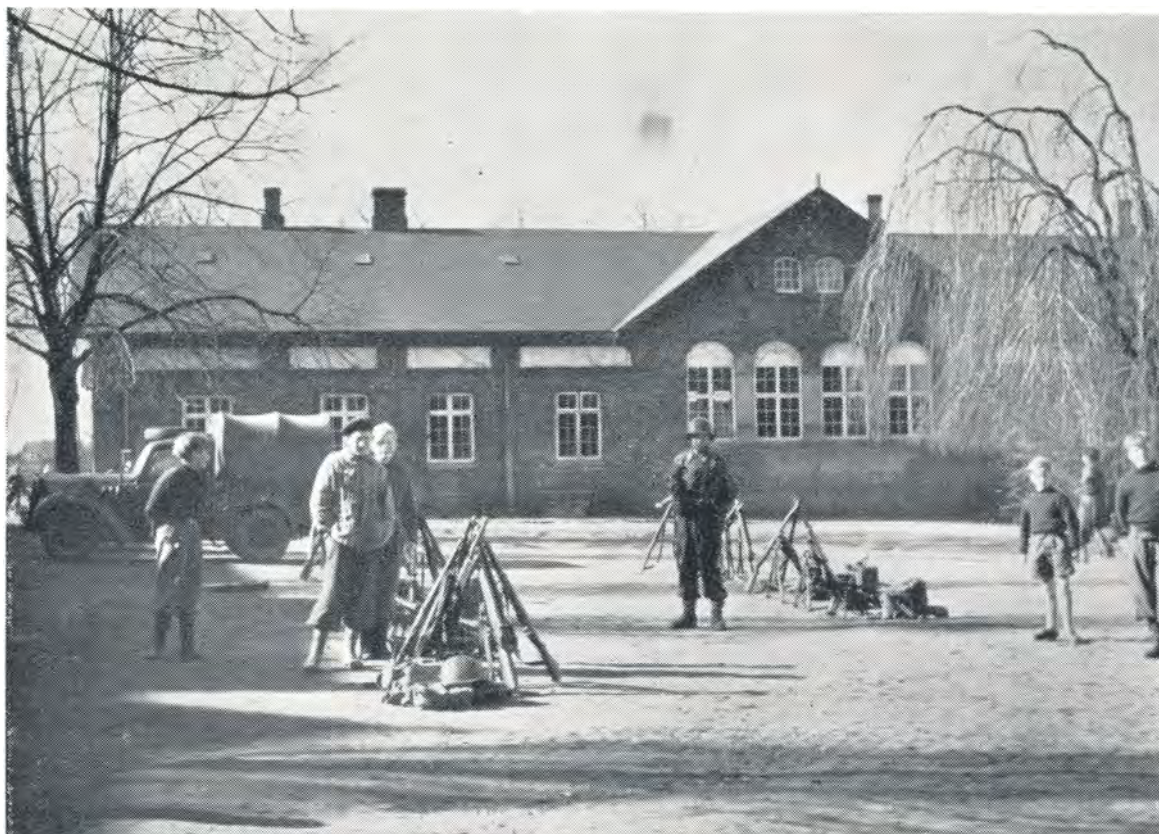
Fredericiasoldaterne holder hvil hos os. 1952.

Det var morsomt at se vore drenge smutte ud og ind imellem de lange soldaterben og snappe bolden lige for næsen af dem. Soldaterne spillede i deres store støvler, som de slet ikke kunne styre eller stå fast med. Opbremsning var næsten umulig for dem. Var de først kommet i fart, var de næsten nødt til at fortsætte lige ud, i den mere eller mindre heldige retning.