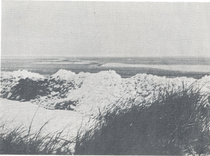
Ved Ringkøbing fjord, Februar 1958.