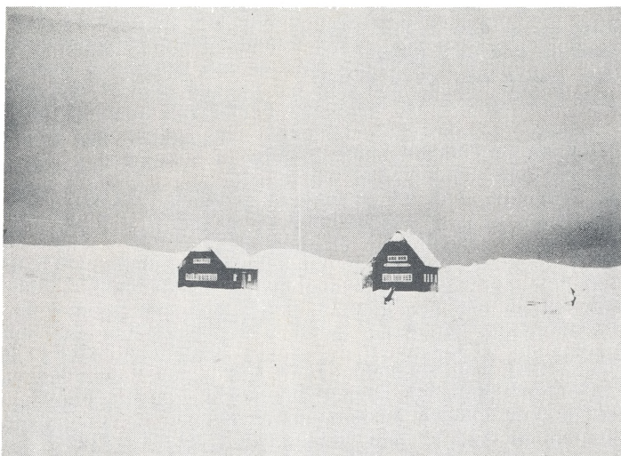
"Bjergeborg", Februar 1958