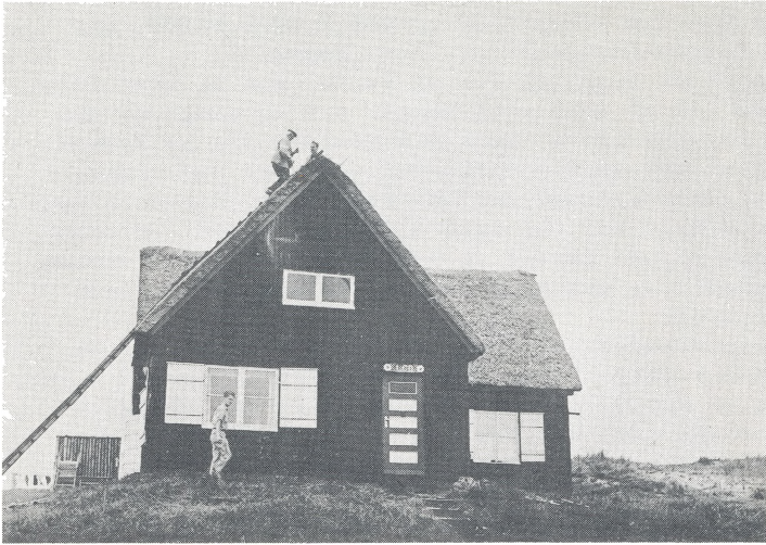
Tækkemanden i arbejde.1958.

tens komme omkring med kone og børn, og i regelen er telt og kogegrejser jo også med. Andre er kommet i lejet bil eller på motorcykel eller knallert, derimod kun nogle ganske få på almindelig cykle, men jeg tror, at disse sidste ofte får mest ud af turen. -