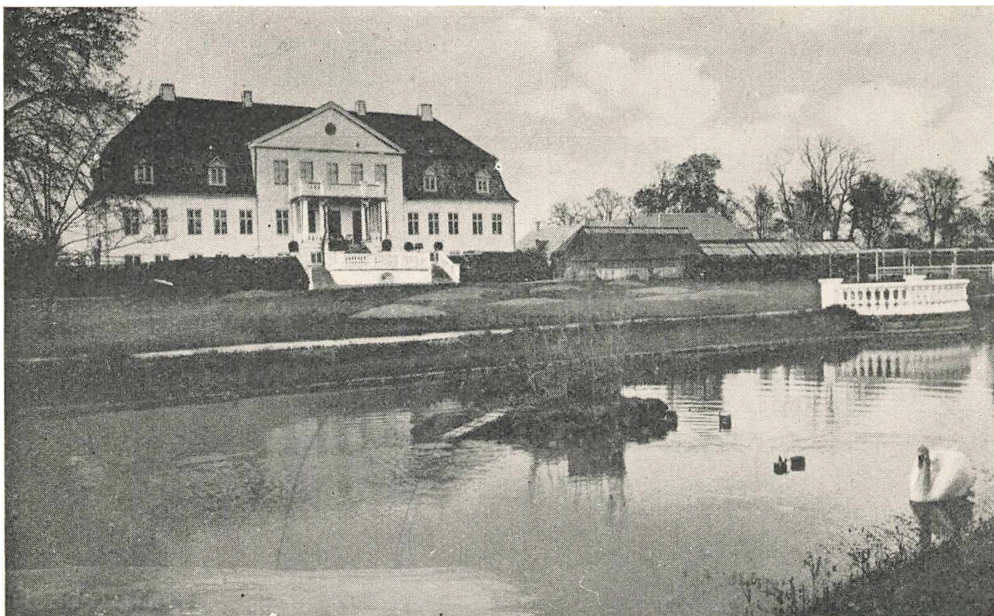
Lundsgaard — Avlsgaarden, hvor Forpagteren boede, i Baggrunden.