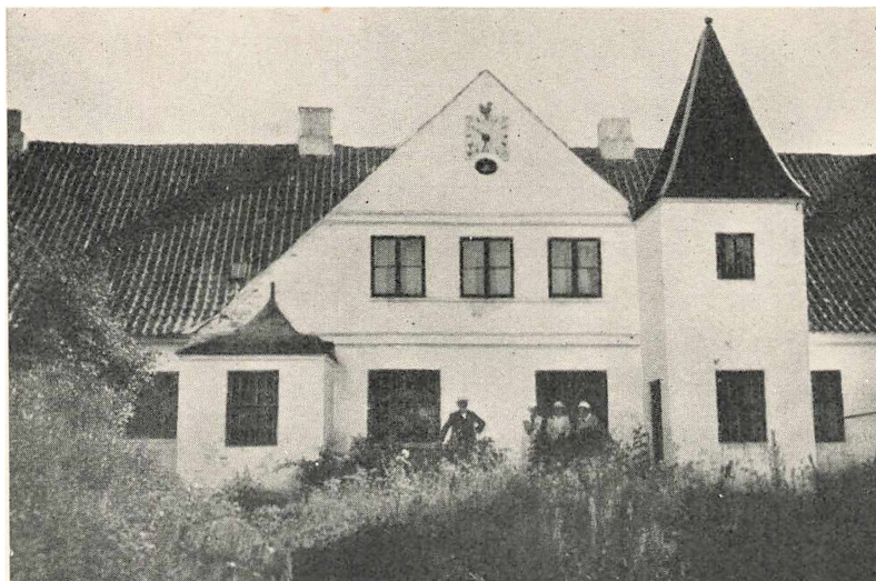
Egensekloster set fra Haven.