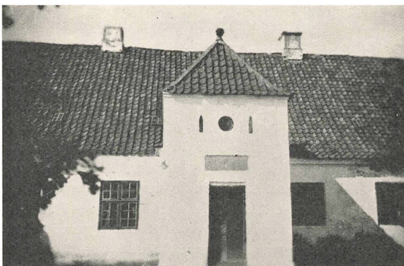
Egensekloster set fra Gaarden

Paa Sandstenspladen, der ses over Døren, staar: „Conv. sor. frat. monast. Mariager clastr. Egense anno MDIX p. c. fund.“ — hvilket er Forkortelse af: „conventus sororum fratrumque monasterii Mariager clastrum Egense anno MDIX post Christum fundavit“, som betyder: „Søstrenes og Brødrenes Samfund i Mariager Kloster grundlagde Egensekloster Aar 1509 efter Christus“.