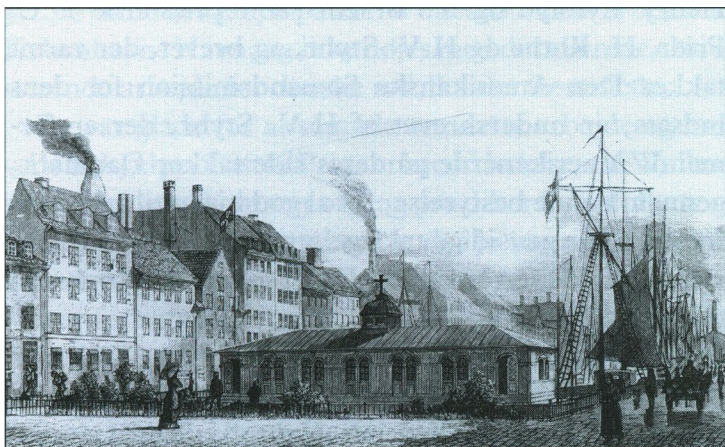
Nyhavn og Bethelskibet ved Kongens Nytorv.