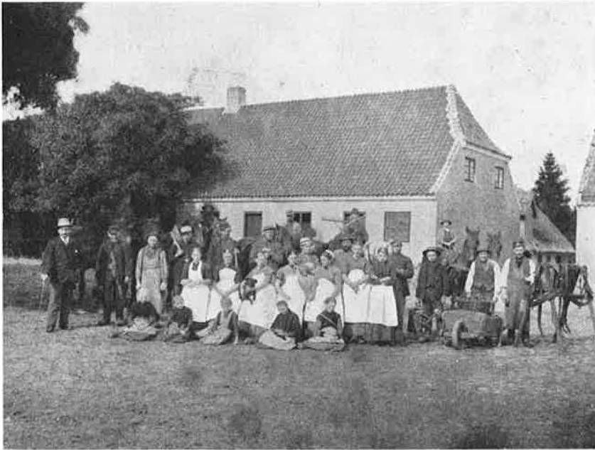
Gaardens daglige Arbejdere

med dannebrogfarvet Kokarde og bred Sølvtrøse, og dertil hvide Handsker. Fader, der ellers var saa bange for at vække Opsigt, vilde alligevel gerne have, at Folk skulde lægge Mærke til hans smukke Køretøj. Og naar da Kusken med den stramme Holdning og de hvide Tømmer i Haanden sad paa Bukken af den kønne lille Glaskarét, som Fader havde foræret Moder til deres Sølvbryllup, og naar de raske, brune Køreheste, der hed Per Olsen og Niels Persen efter de Gaardmænd, de var købt hos, travede henad Vejen, vendte mange sig om og saa efter den Selleberg Vogn. — Foruden den egentlige Kuskjetjeneste skulde Kusken ogsaa udføre Arbejde i Huset paa anden Maade, f. Eks. pudse Fodtøj, bære Brænde op og staa bi ved Hovedrengøring o. s. v., hvorved han fik sin Gang oppe i Stuerne ligesom Stuepiggen; derfor var der ogsaa næsten Tradition for, at hun og Kusken skulde være Kærester; i alt Fald blev de det tidt.