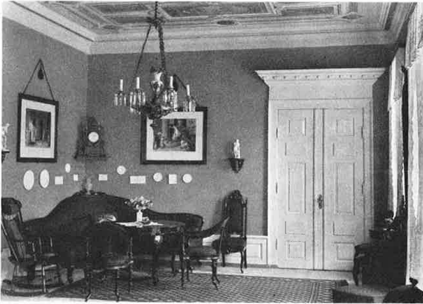
Hjørne af Havestuen