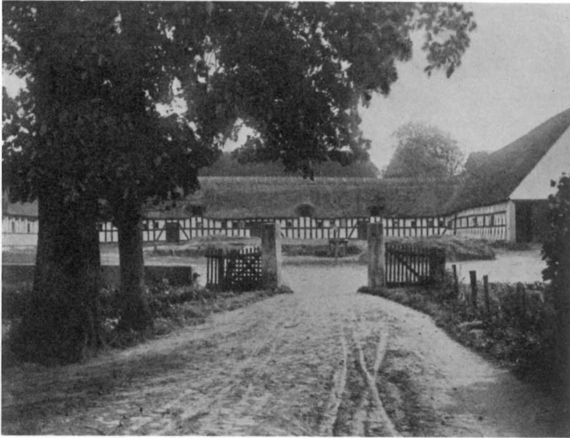
Fig. 3. Gelskov Ladegaard før 1912, set fra Opkørslen til Borggaarden

gen paa Gelskov, bad Tømreren først om Træ til Naglerne, hvorover Herremanden blev forskrækket og ikke turde lade ham bygge videre. Først da han ved et Mesterhug havde vist sin Duelighed, fik han Lov til at fortsætte Arbejdet. 66