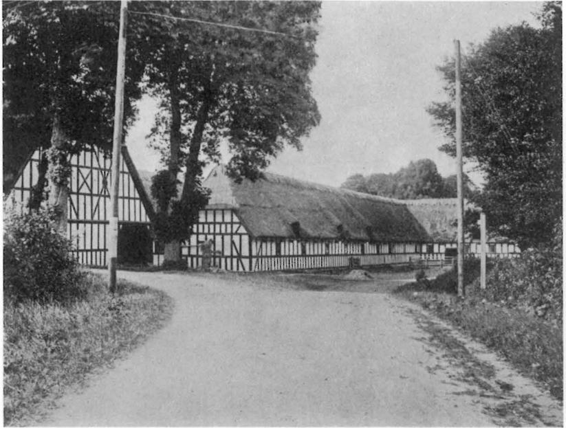
Fig. 2. Gelskov Ladegaard før 1912, set fra Sydøst

ogsaa betyde en helt ny Bygning. Det maa være den Stald, som senere kaldes Øksenladen og i nyere Tid er blevet brugt til Ungkreaturer.