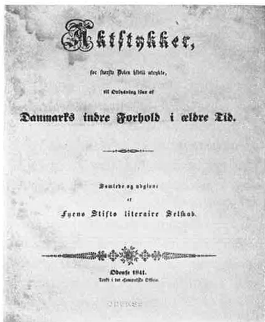
Titelblad fra 1841.

det kongelige videnskabselskabs register over trykte aktstykker og dernæst bede selskabet om at bevilge honorar til en kyndig mand, der kan skaffe de nødvendige oplysninger fra dette register. — I Robmanns skrivelse hedder det, at den beretning, komitéen skulde aflægge om sit arbejde ved mødet i januar 1840, allerede nu er færdig og herved indsendes. 287 dokumenter, dels originaler, dels kopier, er gennemgaaet; der er foretaget fuldstændige afskrifter af 124, skrevet indholdsfortegnelse af 82 og register over 81. De ældste manuskripter er fra 1400-tallet, og de yngste fra 1700-tallet. Komitéen er overbevist om, at der kunde tilvejebringes en langt større samling, hvis der blev foretaget en nøjere undersøgelse af arkiver og samlinger. Men ud fra det, som er indsamlet, udtaler den: