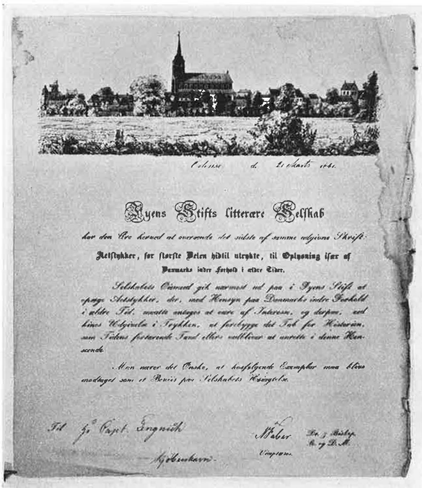
Følgeskrivelse med Actstykker, 1841.

Fra 1842 var Paludan-Müller og Rohmann saaledes alene om arbejdet med at udgive aktstykkerne.