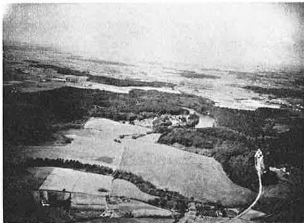
Nedkastningspladsen ved Langesø.

mere om en ejendommelig episode i forbindelse med denne modtagelse: 80) „Den sending, der skulle til „Alfred“, blev imidlertid afleveret paa „Anton“, Langesø. Der kom 12 beholdere ialt. Disse blev kørt til et depot i Sdr. Gaarde, og under aflæsningen her skete følgende: Der var ialt 7 mand til at læsse af, og de havde efterhaanden faaet alle beholderne paa nær 2 baaret ind i gaarden. Der opstod da et øjeblik, hvor føreren var alene tilbage ved vognen. Han var netop i færd med at trække en beholder frem, da der pludselig fra et vejsving ca. 25 m fremme kom 6–7 mand raabende og skrigende ned mod ham. Samtidig med, at føreren naaede at komme ind i førerhuset, hvor hans „sten“ (maskinpistol) laa, naaede de op paa siden af vognen og begyndte at bearbejde føreren med lange stokke, hvorunder vindspejlet og ruderne blev knust. I mellemtiden havde han faaet fat i sin „sten“ og opfordrede dem til at forsvinde, da der ellers ville blive skudt. Da dette ikke hjalp, affyrede han et par salver med det resultat, at de straks forsvandt. Herefter løb føreren ind i gaarden for at faa fat paa de andre, men de var ingen steder at finde. Han fortsatte saa eftersøgningen paa den anden side af gaarden, men stadig uden resultat. Pludselig hørte han vognen blive startet og søgte derfor ad omveje tilbage til