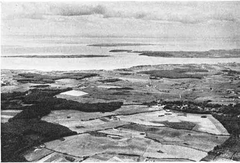
Nedkastningspladsen ved Holstenshus.

iøvrigt genfremsættes i december. London svarer herpaa d. 24.10.44: „vil prøve at flyve til alle punkter samme nat med fireogtyve containers hvert punkt plus eureka pakke paa vera og tito“. 83) Vigtigere end den teoretiske forsikring var det naturligvis, at man fra London i praksis fulgte markens ønske, hvilket tydeligt vil fremgaa af det følgende afsnit. D. 26. november kom 3 pladser paa programmet, „Rosalie“ ved Krengerup, „Vera“ ved Holstenshus og „Tito“ ved Lykkesholm. Ved de to sidstnævnte modtagelser modtoges hvert sted 24 containers samt 1 pakke; ved Krengerup blev resultatet 18 beholdere og 1 pakke (indeholdende en eureka). Detaillier fremgaa af rapport om aftenens forløb til Fynsledelsen og af rapport fra Bent Rune om modtagelsen ved Lykkesholm. 84)