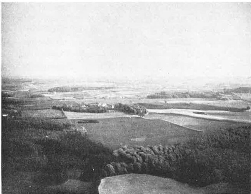
Nedkastningspladsen ved Rugaard.

holdepunkter for en præcis datering: Der er fuld overensstemmelse hos alle 3 berettere om, at der ved denne operation blev anvendt den saakaldte S-phone, et apparat, der tillod samtale mellem flyve-maskinens pilot og modtageholdet under og umiddelbart før modtagelsen, naar afstanden mellem de to parter var tilstrækkelig kort. Modtageholdet kunne derved dirigere maskinen til det nøjagtige punkt, give piloten meddelelse om særlige forhold af betydning for nedkastningen: Vindstyrke, vindretning o. s. v., ligesom naturligvis den direkte og øjeblikkelige radiokontakt kunne skabe sikkerhed for, at operationen ikke var blevet afsløret i sidste øjeblik, at pladsen ikke var, hvad man i datidens sprog kaldte „kompromitteret“. Endelig kunne piloten meddele nøjagtigt, hvad han kastede og i hvilken rækkefølge, og han kunne, saa længe radiokontakten under bortflyvningen kunne bevares, faa de første oplysninger om resultatet af kastet. Fordelene ved apparatet var helt indlysende.