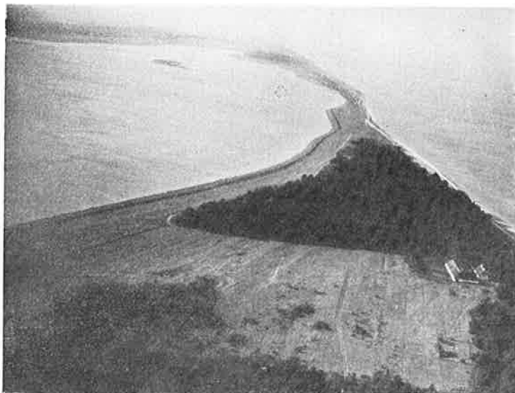
Nedkastningspladsen paa Enebærodde.

direkte og personlige problem: Hvad bliver speakerens slutbemærkning. Den lød: „Lyt igen kl. 21.15“.