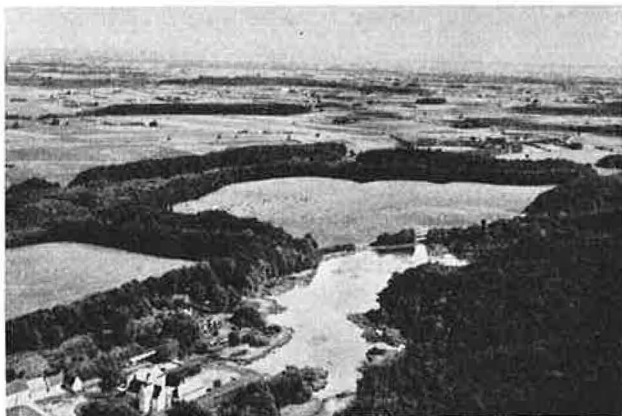
Nedkastningspladsen ved Lykkesholm.

Nu satte vinteren ind, og de følgende maaneder blev stille maaneder med mørke, kulde, sne og talrige skuffelser i forgæves forsøg paa at overvinde vanskelighederne. Kun en enkelt godt gennemført modtagelse skulle lyse op i en lang række af uheld. Telegrammerne fyldes af korrespondance om tilrettelæggelse af operationer, der saa alligevel ikke i praksis lod sig gennemføre. Et par almene træk skal lige anføres.