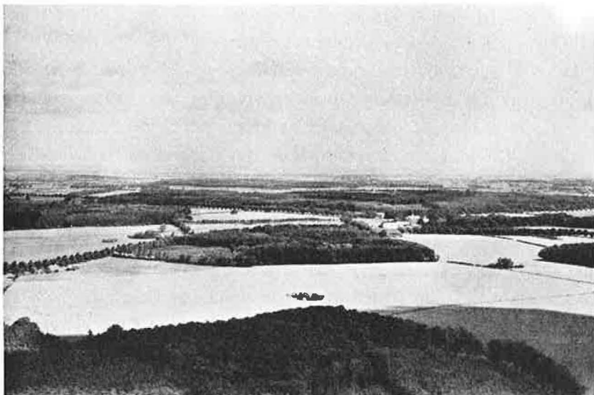
Nedkastningspladsen ved Ryslinge.

Natten havde været en fiasko – derom var ingen tvivl, og begivenheden fortæller baade om manglende erfaring og om de sidste uheldige rester af den tidligere sammenblanding af modstandsarbejdets funktioner.