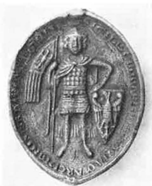
Markgreve Conrad Is Segl. 1/2. Efter Afstøbning i Rigsarkivet.

bestod der det bedste Forhold mellem de to Markgrever Johan I. og Otto 3., som regerede deres Land i Fællesskab og stadig udvidede og befæstede Brandenburgs Magt. Først mod Slutningen af deres Levetid – de døde henholdsvis 1266 og 1267 – delte de Landet imellem sig af Hensyn til deres Efterslægt. Ærø, som var Johans Privateje, fulgte dennes Linie. Han efterlod sig flere Sønner, af hvilke Johan 2., Otto 4. „med Pilen“, 5) der er kendt som Minnesanger, og Conrad 1. regerede i Fællesskab. Under disse fortsattes