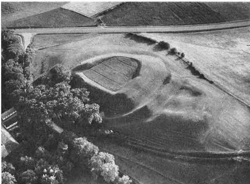
Voldstedet ved Søbygaard.

sere Landet. Der kan næppe være Tvivl om, at de ogsaa paa Ærø i de omtrent 100 Aar, de beherskede Øen, har afsat sig Spor. Det har maattet være magtpaaliggende for dem at sikre deres fjerne Besiddelse mod fjendtlige Overfald, og det maa anses for givet, at de har haft stærkt befæstede Støttepunkter paa Øen. De to Lokalteter, som nævnes i Brevet 1277, Seboy og Grosbol, har utvivlsomt som før nævnt været saadanne Borge. Ved Søbygaard ligger endnu det store Voldsted, som efter Anlæggets Karakter maa gaa tilbage til en endnu tidligere Tid. Det maa henføres til Venderkampene i 2. Halvdel af 12. Aarhundrede, 18) men har uden Tvivl i Brandenburgernes Tid været i fuldt forsvarsdygtig Stand. Det ejendommelige Dobbeltvoldsted ved Drejet, „Volden“, der er af en noget senere Type og har haft brede vandfyldte Grave, maa derimod snarest formodes at stamme fra Brandenburgerne. 19) Selve Øens Købstad Ærøskøbing, der har en udpræget nordtysk Byplan, skylder utvivlsomt Brandenburgerne sin Tilblivelse. 20) Brandenburgernes Periode