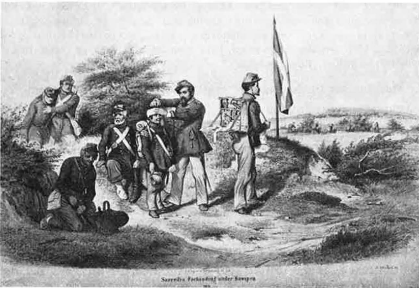
Såredes forbindelse under kampen. Maleri af N. Simonsen.

ligt, at han flere steder i sin dagbogs notater anfører, at han keder sig. – Han skriver bl. a. dette søndag den 27. september :