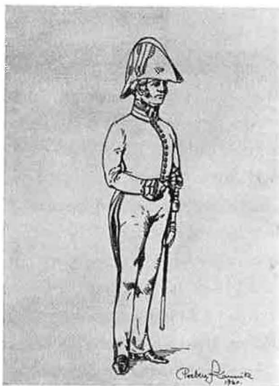
Tjenestenniform for hærens overlæger 1846 Efter tegning af konservator Kannik.

Denne gang var manøvrerne kun en prøve („supponerede“) – to år senere blev de blodig alvor. For vort indre blik kan vi se de lange kolonner, der efter 14 dages lejrLiv går hver til sin garnison og snor sig hen ad de sandede veje, der på grund af regnen var lettere at marchere på. 65 ) – Men nogle af tropperne foretog hjemturen med jernbanen. Det var 5. Jægerkorps fra Kiel og 4. Jægerkorps fra Slesvig, – og „forsøget med denne transport var fuldkommen tilfredsstillende“. (5. Jægerkorps benyttede her jernbanen fra Wrist til Kiel og 4. Jægerkorps fra Nordtorf til Rendsborg.) 66 )