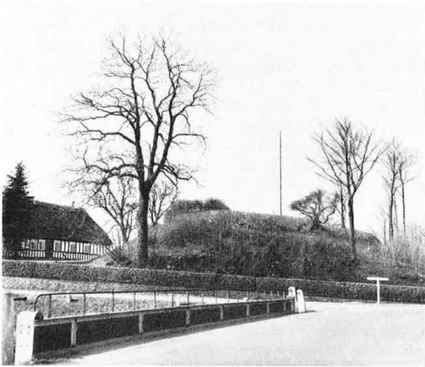
Fig. 3. Voldstedet set fra øst, fra broen over Odense å.

At den skulde høre til vore ældste oftest enkle Borganlæg fra 12. Aarhundrede, synes mindre troligt. Snarere turde man tilskrive det vort Borgbyggeris store Tid, 13. Aarhundrede, vel i saa Fald Tiden efter Valdemar Sejrs Død. Men hvilken Konge der har taget Initiativet til at opføre en Borg her, og hvorfor, lader sig ikke afgøre. Man kunde naturligvis tænke paa en anden Periode, hvor Fyen var Krigsskueplads. Det var 1246 og 47, da Hertug Abel her kæmpede mod sin Broder Erik Plovpenning, og Krigen rasede baade i Odenseegnen og i Sydfyen. Der kunne i og for sig for Kongen, netop i disse Aar være god Grund til at sikre sig et fast Punkt midt i Fyns Land. Skulde det være Erik Plovpenning, der har ladet Borgen her opføre ved 1250?