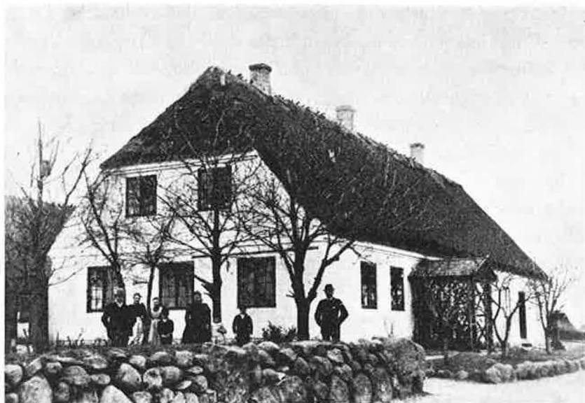
Refsvindinge skole 1870

mælkestue, ligesom man heller ikke kunne gå ud fra, at kommunen skulle være pligtig til at betale den favn brænde, som forbruges mere efter skolestuens deling, end før dette var tilfældet, eller at betale koste til skolestuernes fejning. «