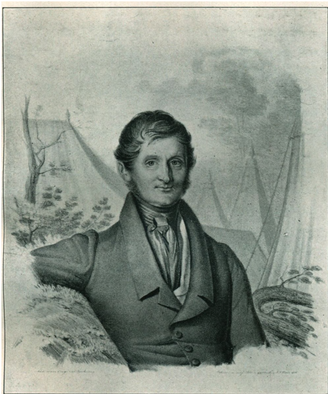
HERTUG VILHELM AF GLYKSBOG EFTER ET SAMTIDIGT LITOGRAFI