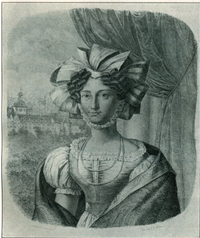
HERTUGINDE LOUISE AF GLYKSBOG EFTER ET SAMTIDIGT LITOGRAFI