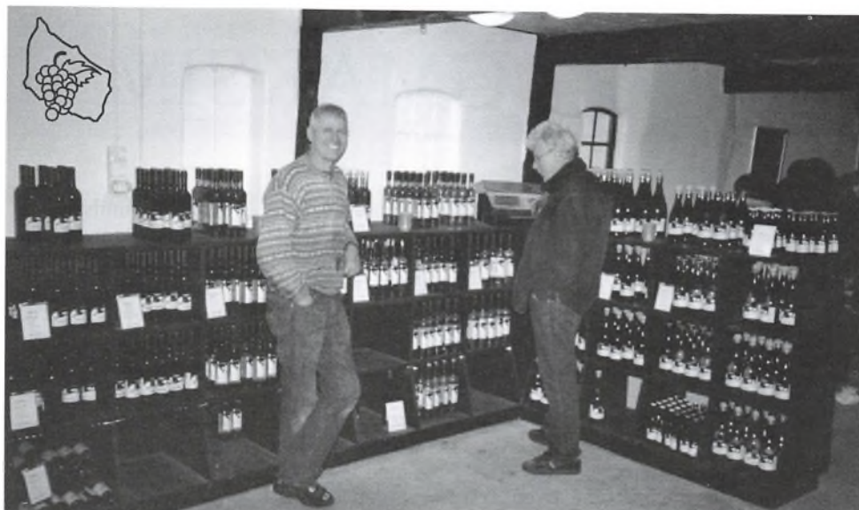
Fra gårdbutikken, der inspirerer til sanselig lyst og glæde.