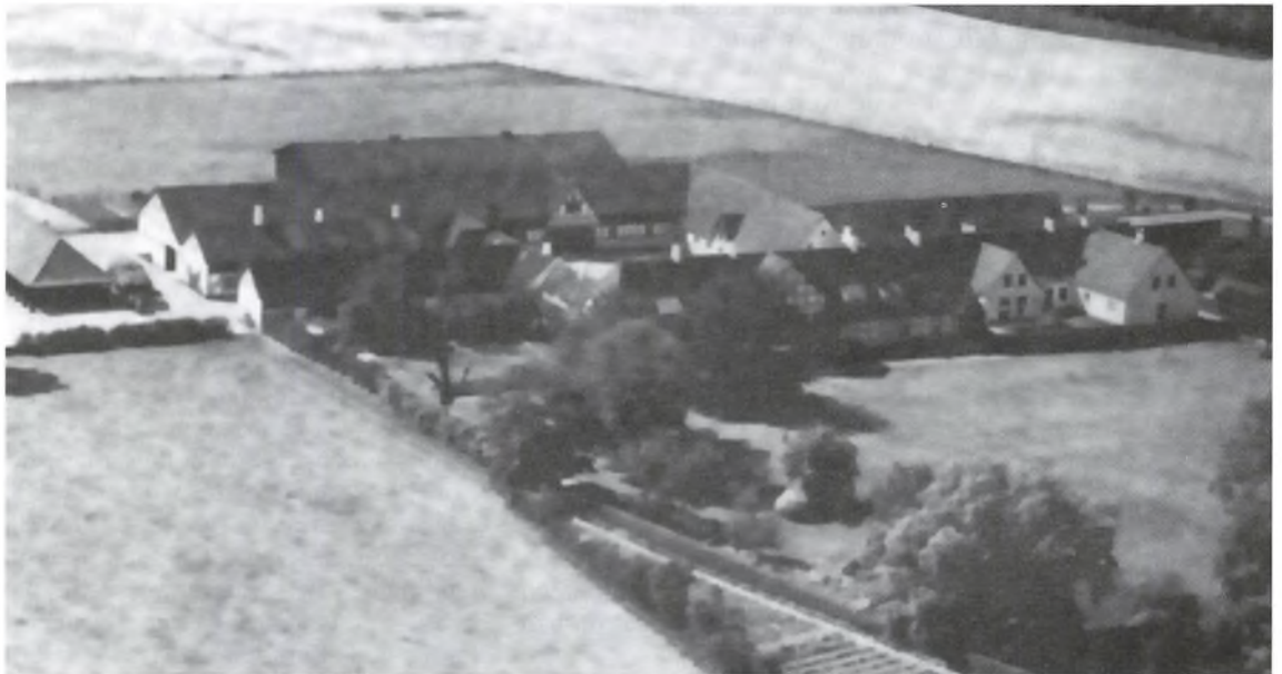
Kejrups før branden i 1984.

Den første tid vi var på Kejrups, var vi fire der såede lidt korn, noget staldfoder og ellers kårloer, foderroer og sukkerroer. Først blev der harvet med traktor og tromlet med heste. Så blev der sået med såmaskine forspændt 3 heste. Såmaskinen