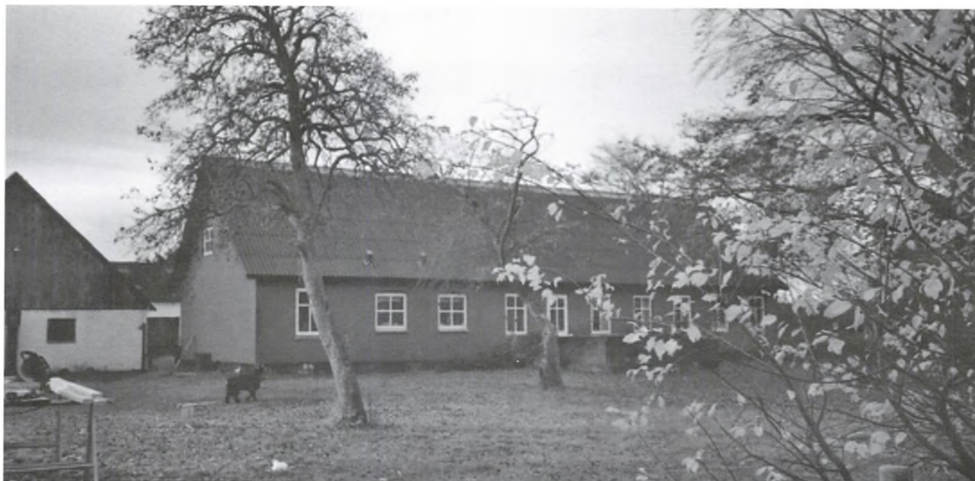
Stuehuset er en enkel og smuk bygning fra 1912.

En gedebuk holder græsplænen, men den kan også beundres af børnene.