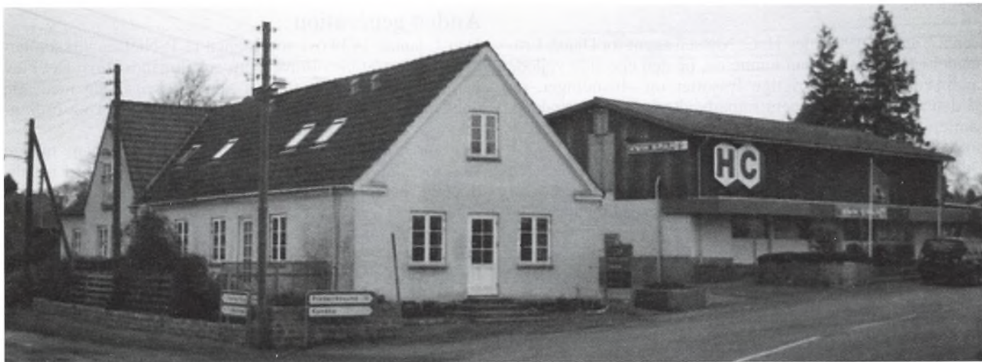
Handelshuset H. C. i Venslev begyndte i 1904, som en traditionel købmandsforretning. Ved siden af den oprindelige forretning ligger det moderne supermarked, og på modsatte side af vejen er både byggemarked og afdelingen med korn, gødning og foderstoffer.

Der er ikke kun gårde, der vandrer gennem generationerne, der findes også handelshuse, som har været i slægten gennem flere generationer.