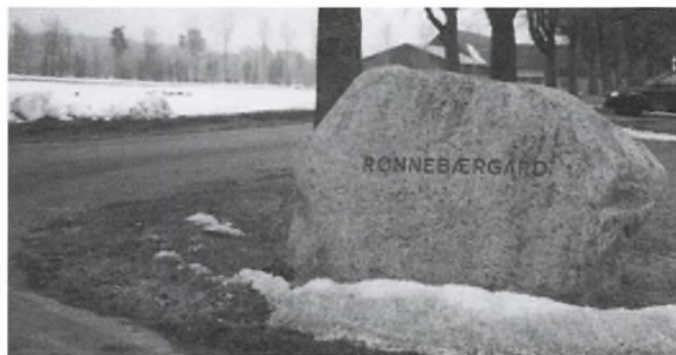
Ved indkørslen står en stor sten med gårdens navn. (Kan evt. beskæres, så det grimme hus til højre forsvinder. Kan også helt udelades om der mangler plads.)