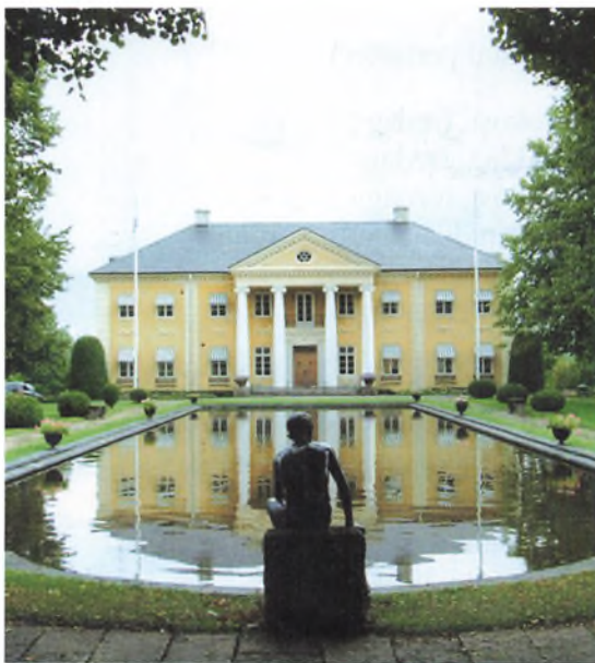
Rottneros Herregård og park