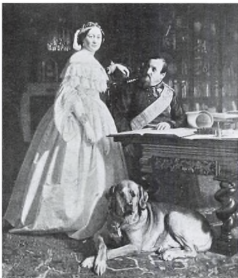
Grevinde Danner og Frederik VII

hans rejsedagbog fra 1787-88. Den 4. marts, hvor sneen ligger meterhøjt, kommer han til Jægerspris, og på trods af de høje snebunker, som gik han til over knæene, kæmpede han sig vej fra Julianehøj og helt ud til Benedict. På vejen beser han også monumenterne for Ferdinand, Absalon og Bugenhagen. Han nåede at se i alt 32 mindestøtter, og af dem alle dem med et frimurerisk symbolsprog.