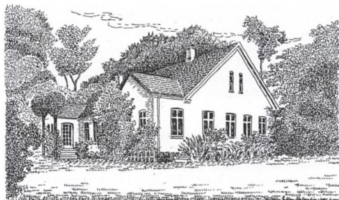
Birkemosegårds hovedbygning. Tegnet af Ellen Valentin.

Birkemosegård var omtalt i Slægtsgårdsbladet nr. 355.