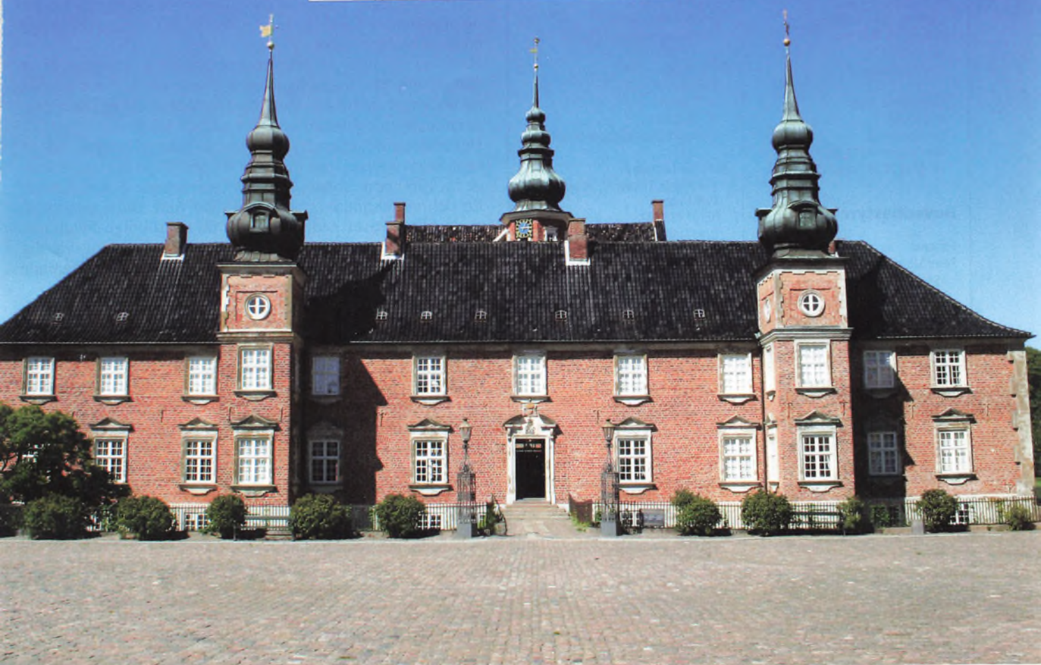
Jægerspris Slot i Hornsherred

Frederiksberg Bibliotek Hovedbibliotekets Læsesal