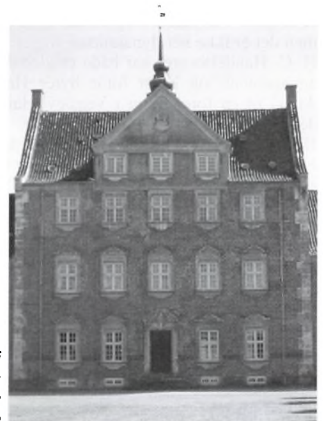
Den nordlige fløj indeholder stadig det oprindelige Abrahamstrup

Struenseetiden kom til at sætte et skel med hensyn til forholdene på godset. Stutteriet og fasaneriet blev nedlagt. Bøn-