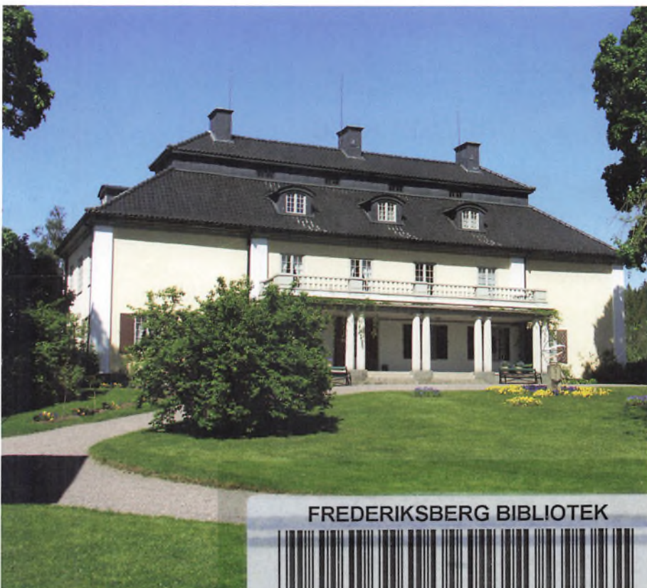
Selma Lagerlöfs hjem Mårbacka i