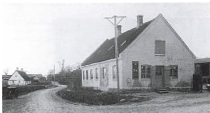
Hvor det hele startede i 1904