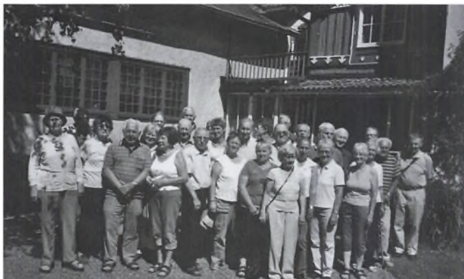
Hele selskabet samlet foran tegneren Carl Larssons hus i Sundborn