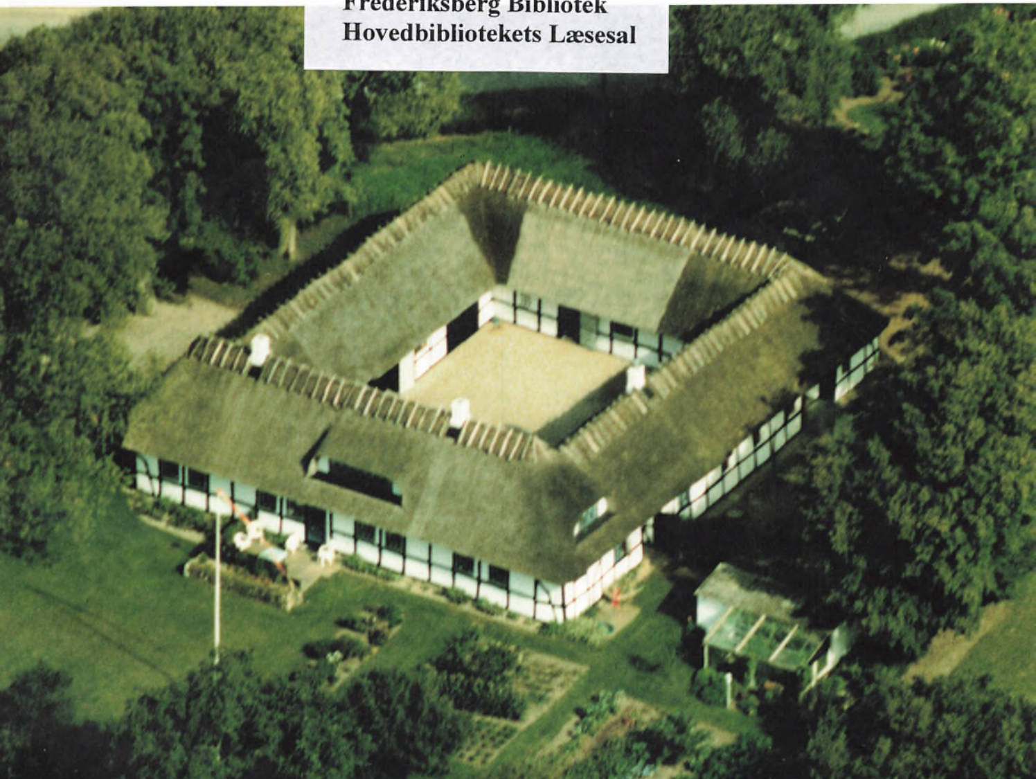
Krogsbøllegård på Nordfyn