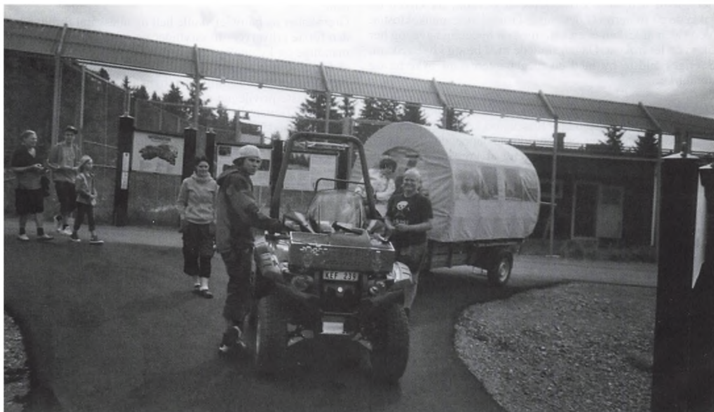
Fra besøget i Grønklit Bjørnepark. Man kunne gå langs hegnene eller blive kørt i et køretøj, der var vildmarken værdig.

Turen fortsatte til vandfaldet Stygfossen. Området har fået sin særlige karakter efter et meteornedslag for 360 millioner år siden. Ved at gå ned langs det relativt beskedne vandfald, fik vi en fortræffelig fornemmelse for områdets helt særlige natur. Vi fortsatte til den gamle by Tällborg, hvor vi fra en højt beliggende hotel nød såvel frokost som udsigten over Siljansøen.