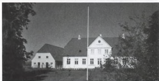
... og i dag

På halvøen Røsnæs, der er nordsiden af Kalundborg Fjord, ligger Dyrehøjgård, eller som den nu kaldes Dyrehøj Vingård.