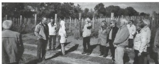
Fra Vestsjællandskredsens besøg i vinmarken.