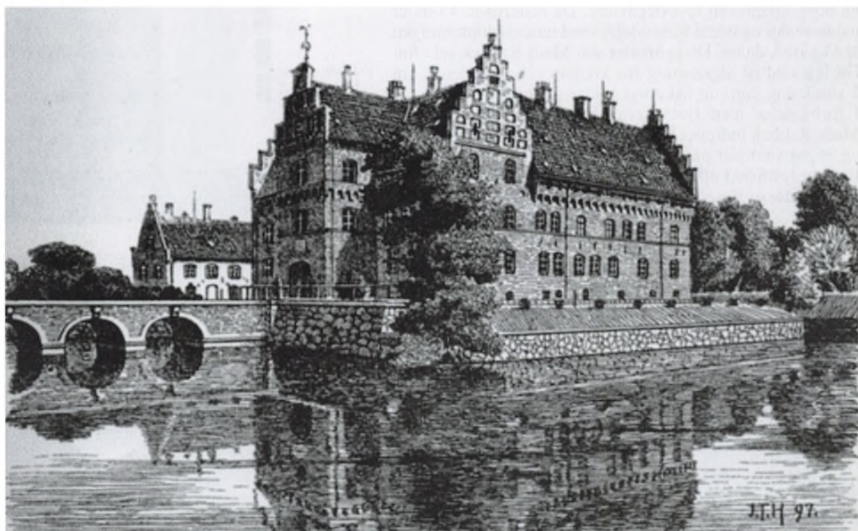
Peder Oxes borgagtige hovedbygning på Gisselfeld.

Modgang og hårde arbejde tærede voldsomt på hans kræfter. Som 55-årig, i oktober 1575 døde han på Frederiksborg Slot. Han havde, sammen med Gisselfeld, erhvervet Tølløse, Holmegaard og Løgismose. To år før sin død indgik han et mageskifte med Frederik II på gods i en række sjællandske byer. I et pergament dateret 10. november 1573 kundgør kongen at have indgået et mageskifte med Oxe, og overdraget ham bl.a. 17 gårde i Haslev 1 .