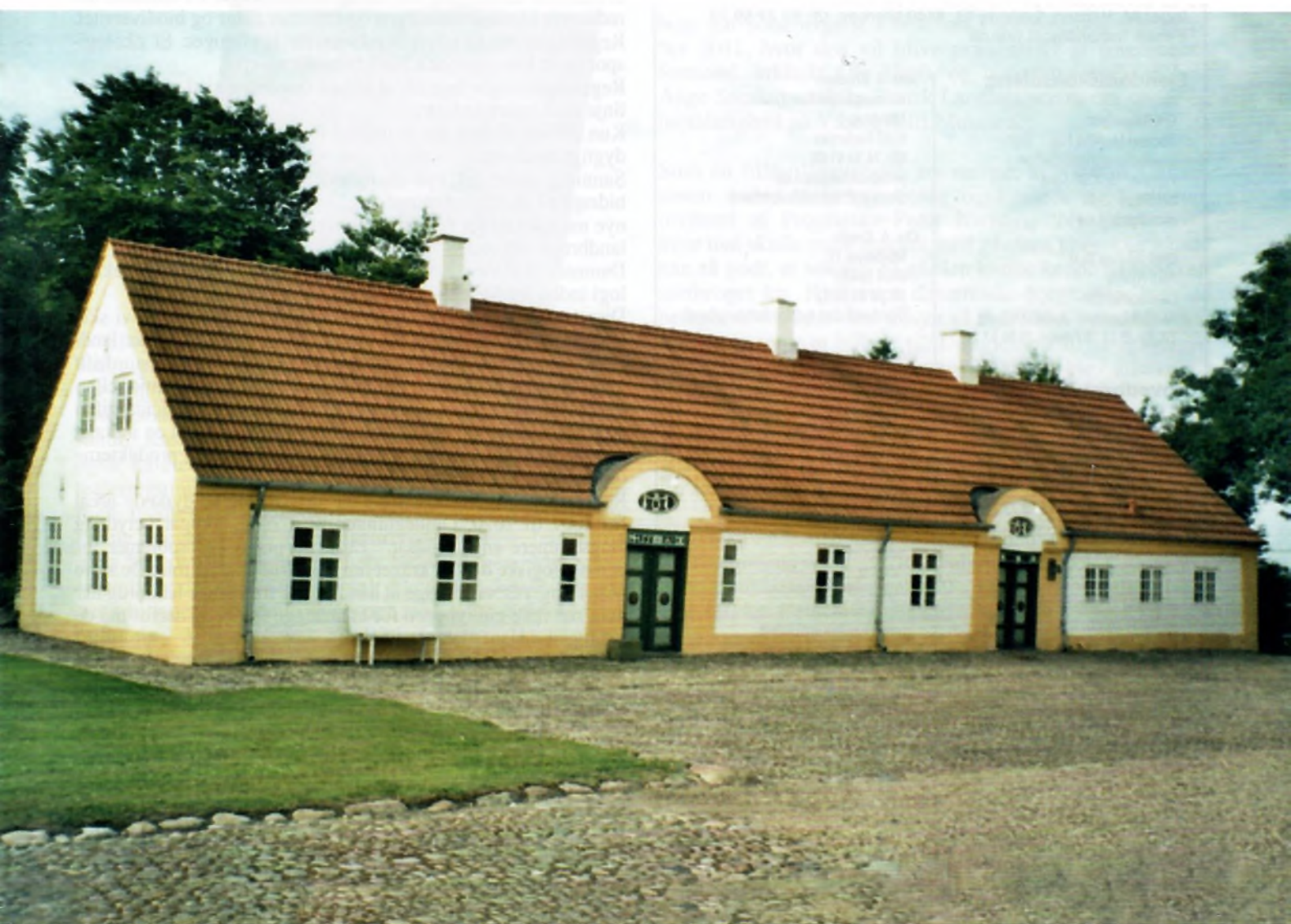
Sønderbygård ved Borris