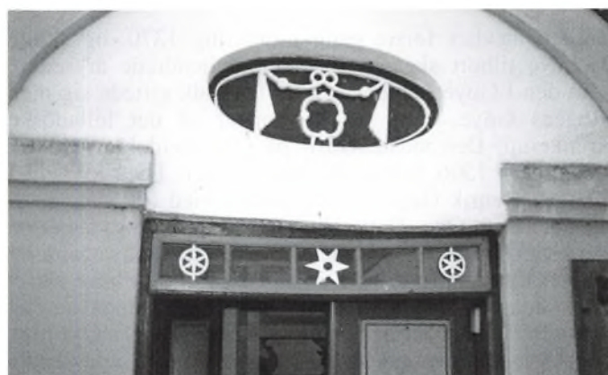
Stuehusets stilart er empire, hvilket ses i udsmykningen i frontonen. I 1890 erstattedes stråtaget af tegltag.