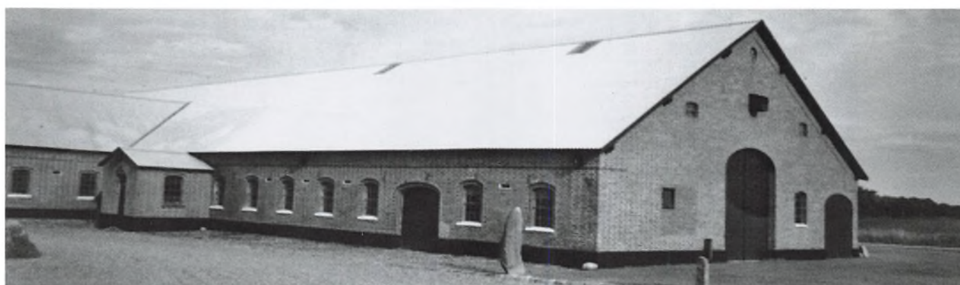
Avlslængerne er fra 1925.