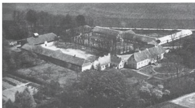
Lykkesholm ca. 1960. Bemærk de to sidefløje, der nu er fjernet.