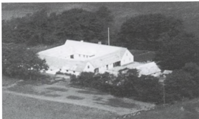
Maglehøjgård o. 1970.