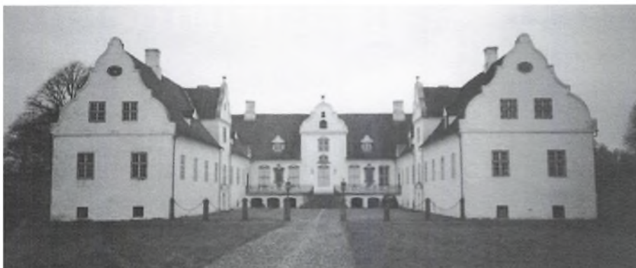
Hovedbygningen set fra vest.