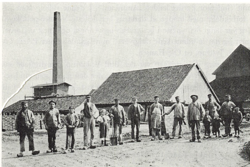
Tvindelstrup Teglværk ca. 1900