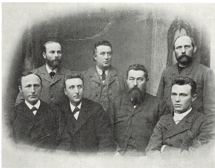
Ringsted Landborenings bestyrelse ca. 1890.

Efter at jeg i året 1886 var blevet ejer af Hyldegården, tog driften deraf i høj grad min interesse, men tiderne var vanskelige, indtægterne små, 3 a 4 kr. for en td. korn, 70 og 80 øre for et halvt kg smør o.s.v. gav ikke mange penge i passen. Udgifterne var også små, ja, set med nutidens øjne meget små, vi levede jo for en væsentlig del af gårdens