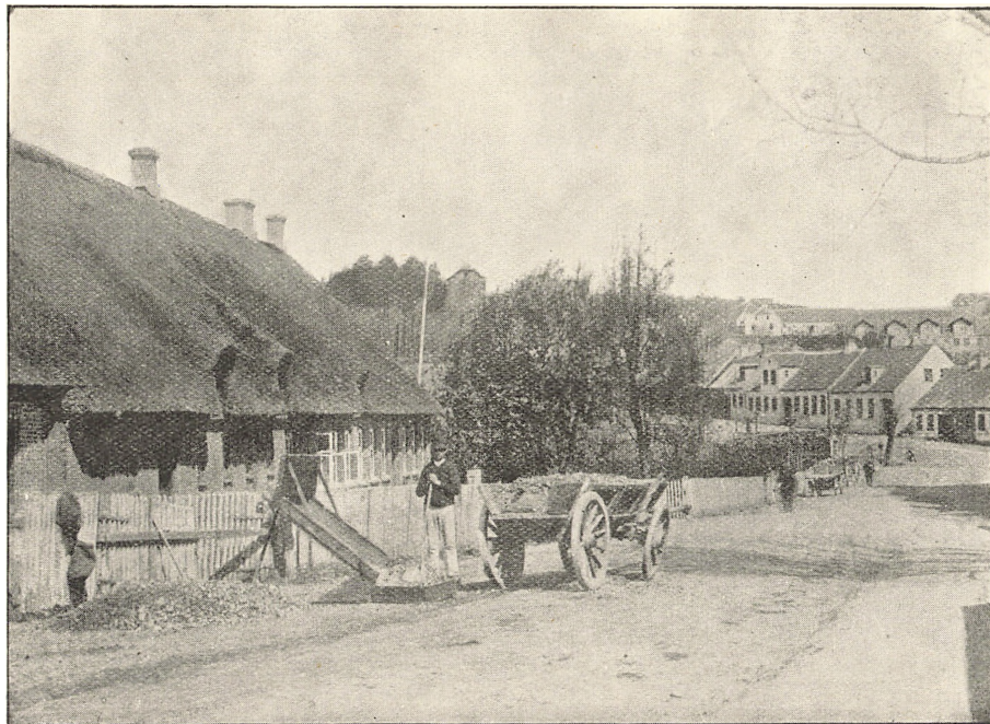
JØRGENSGAARDSLYKKE I KOLDING til Cathrinegade.