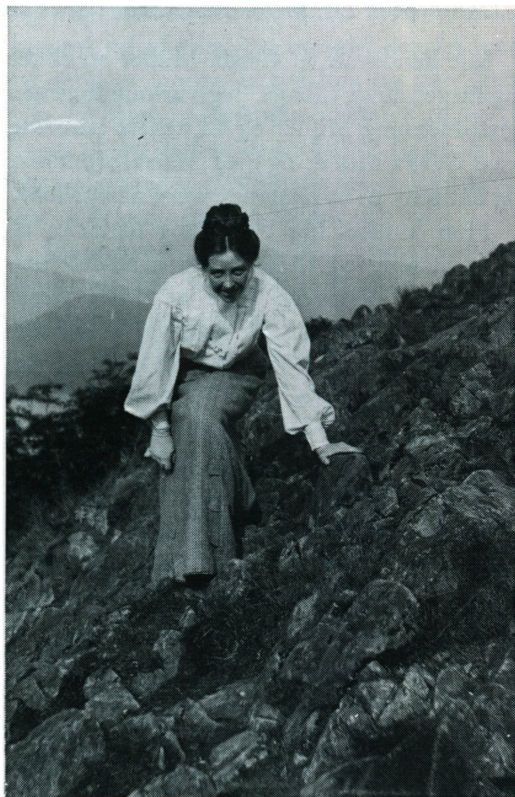
G. M. som bjergbestiger