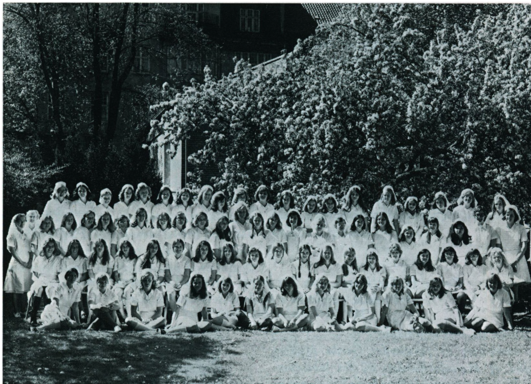
Mariehøns under Paradisæbletræet

»I er Danmarks fremtid af unge dygtige kvinder, der vil skabe hjem fulde af arbejds-