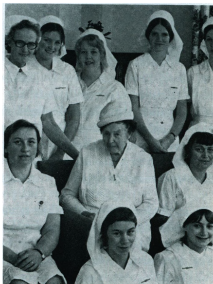
G. M. mellem lærerinder og elever

Det var vel disse egenskaber, der gjorde,