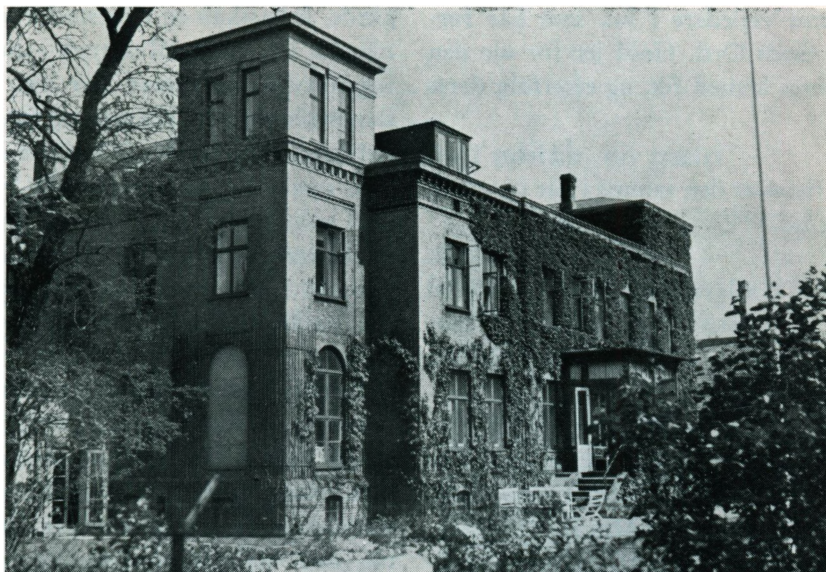
Det Wærnske Institut