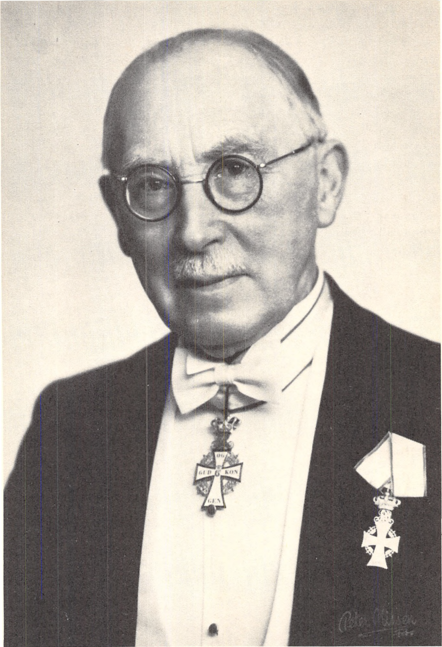
Nicolai Svendsen 1873–1966