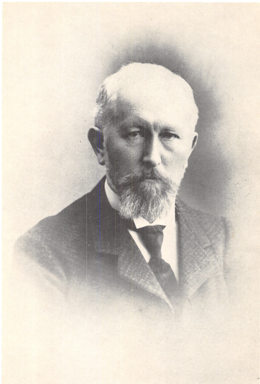
Jannik Bjerrum 1851–1920