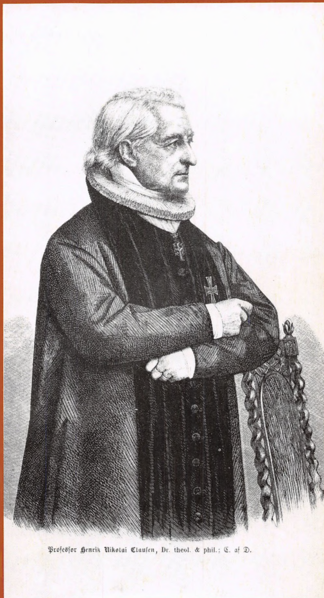
Professor Henrik Nikolai Clausen, Dr. theol. & phil.; C. af D.