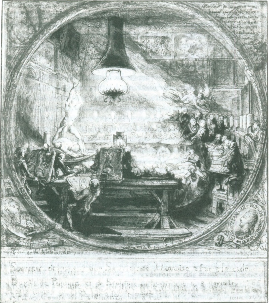
Gabriel de Saint-Aubin: Christian 7. besøger Maler- og billedhuggerakademiet på Louvre den 8. november 1768. Tegningen er blevet omarbejdet i 1777, da kejser Joseph II besøgte Paris inkognito som »greve af Falkenstein«.

formaliteter, men samtidig insistere på at blive standsmæssigt behandlet. Både i Christian V, Frederik IV og Christian VII's tilfælde gjorde det franske hof indvendinger mod denne inkonsekvens.