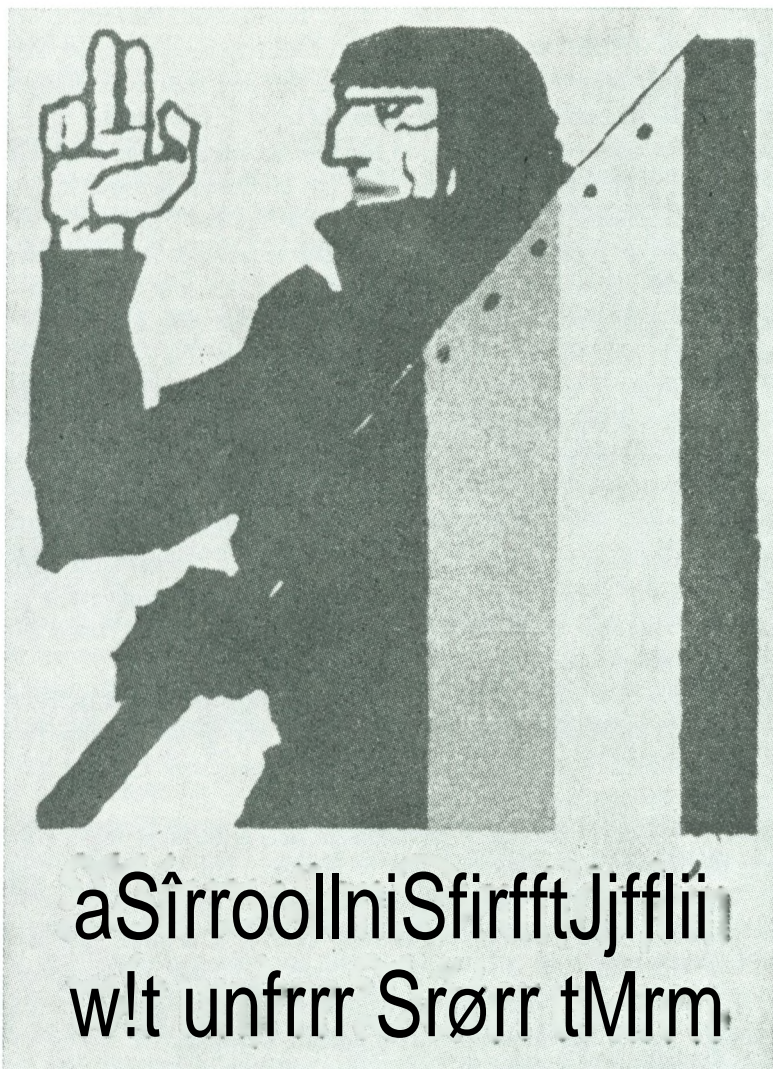
Plakaten der fik navnet »Der Dänenschreck«.

den 4. marts en længere indberetning, hvor han dels gengav den nærliggende opfattelse, som oven for nævnt om det agitatoriske formål, men han øjnede mere vidtrækkende muligheder. Han mente, at det ikke kunne være behageligt for Berlin at møde autonomikrav på et