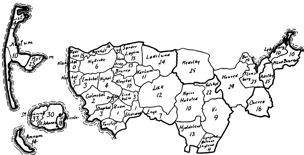
Kort over 2. afstemningszone. Tallene angiver den danske stemmeprocent i hvert enkelt sogn (på grundlag af det officielle danske afstemningskort). Efter Grænsevagten.

en ætling af det slesvigske hertughus, at skaffe sig fodfæste; han byggede bl.a. en borg ved Uphusum. Fogdens foresatte var lensmanden i Ribe, og medens Utlandene som helhed fra 1426 kom under hertugdømmet og under holstenernes kontrol og fik amtmanden i Tønder som nærmeste overordnede, så vedblev Vesterland Før og Amrum at være underlagt lensmanden på Riberhus. Efter en kort mellemfase under Christian I, blev denne tilstand 1484 genoprettet af kong Hans, dog således, at Vesterland Før blev lagt under godset Trøjborg i Vestslesvig. Ved reformationen kom dette gods sammen med Ribebispens øvrige godser til kongeriget Danmark, og derved skabtes forudsætninger for de kongerigske enklaver, der bestod til 1864[30]. I 1867 var der dansk flertal i Vesterland Før, men i 1920 kunne denne del af øen som helhed kun mønstre godt 30 % danske stemmer, medens Østerland Før kun havde 18 %, og hertil skal føjes at befolkningen var koncentreret på øens østside med byen Wyk som centrum. Som helhed viste Før et stort tysk flertal.