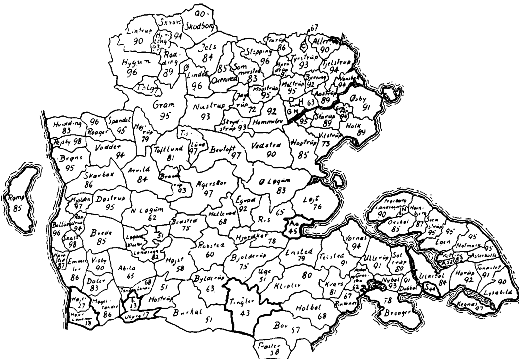
Kort over 1. afstemningszone. Tallene angiver den danske stemmeprocent i hvert enkelt sogn (på grundlag af det officielle danske afstemningskort). Forkortelser: Aa = Aabenraa, A = Augustenborg, C = Christiansfeld, H = Haderslev, G. H. = Gammel Haderslev, L = Løgumkloster, N = Nordborg, S = Sønderborg, T = Tønder. Efter Grænsevagten.

eller venner, og der blev efter omstændighederne sørget godt for dem, så godt at smørrationen den 17. febr. måtte reduceres fra 100 til 50 gr. pr. uge pr. person. De, der havde umiddelbar adgang til mælkeprodukterne, havde brugt så meget i dagene omkring den 10. febr., at der ikke blev nok til mejerierne.