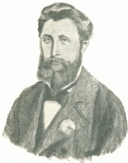
SOPHUS JULIUS GRANDJEAN