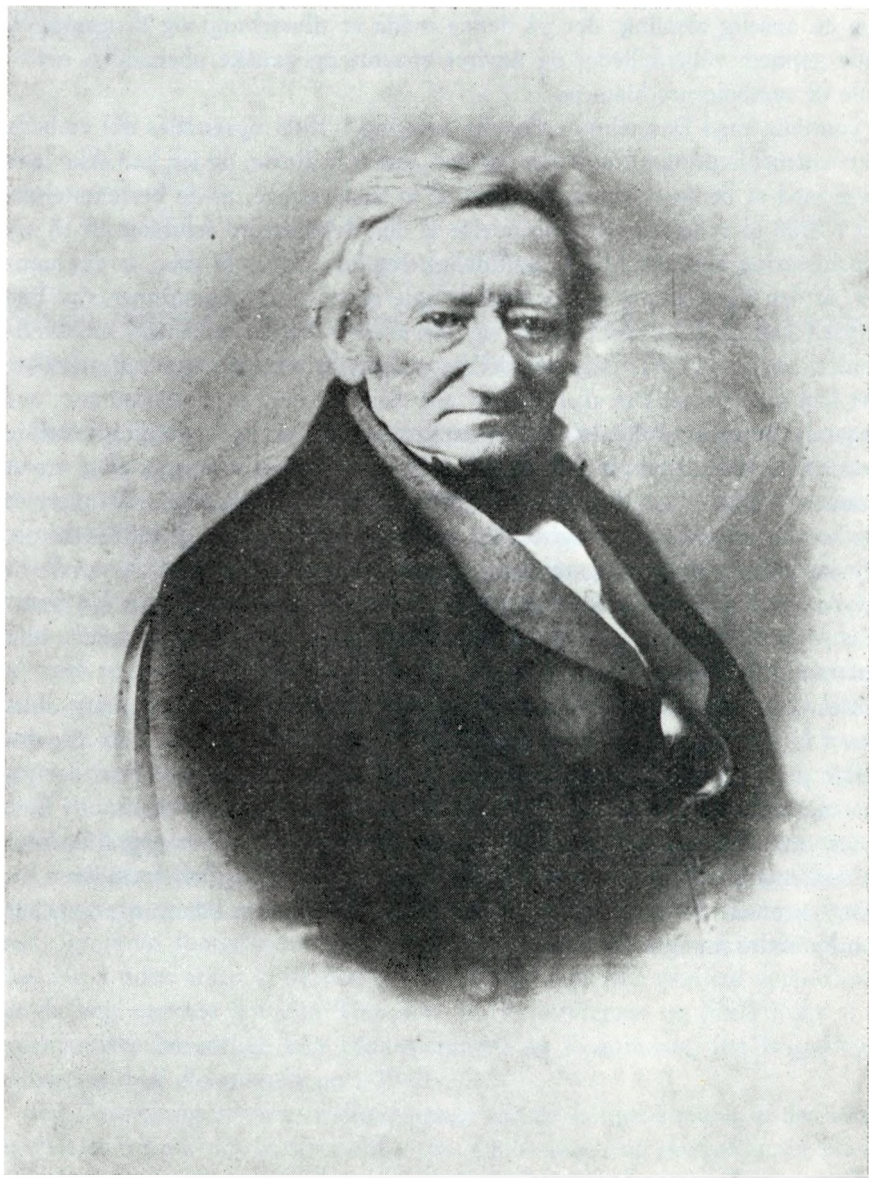
Jonas Collin (1776-1861). Billedet har dannet forlæg for Otto Baches tegning af Collin.