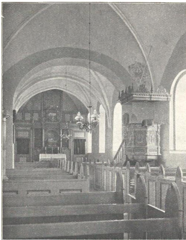
Kjærum Kirkes Indre.

Kalkmalerier kom til Syne 1886 1) ); men de vare vanskelige at restaurere, og der ses nu kun Spor af en Rytter paa