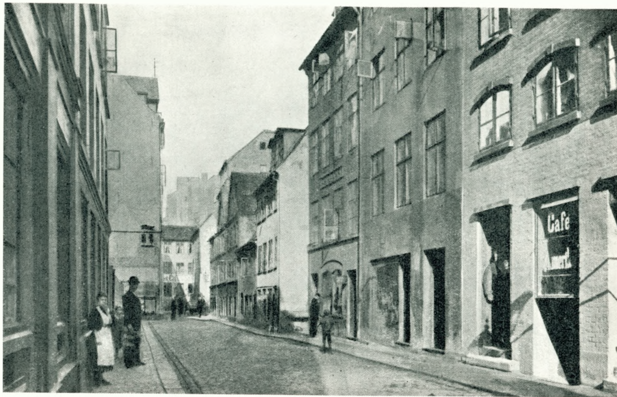
Holmensgade Numrene 1 til 19.