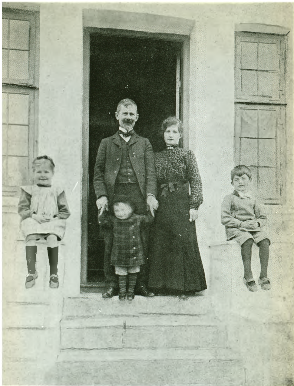
Nybagt husejerfamilie paraderer foran indgangen.