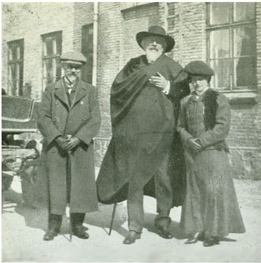
Holger Drachmann og Wied'erne i »Prinsen«s gård.