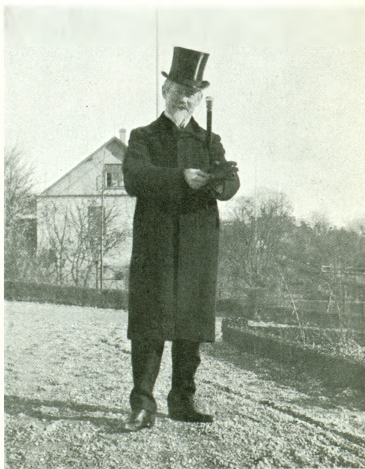
Berømt forfatter i højgalla.

I det lille, dengang meget ravnekrogsagtige Roskilde dukkede der i 1897 en mærkelig familie op: mand, kone og to børn. Pæne mennesker at se til, men alligevel afvigende fra normen. Manden havde fipskæg, og det gik ordentlige mandfolk ikke med, de havde et mere eller mindre veludviklet »cyklestyr« hængende ned i ølglasset. Og fru, hun var virkelig nydelig, men hvad var det dog for en vogn, hun trillede sin yndige lille pige rundt i. Jo, mærkelig var familien, og den søgte slet ikke at gøre bekendtskab med nogen, ville bare passe sig selv. Nok havde et par mennesker, der som man siger fulgte lidt med, hørt noget om, at det vistnok var en væmmelig uanstændig forfatter, som tilmed skulle have siddet i fængsel for sit skrivi. Flertallet anede