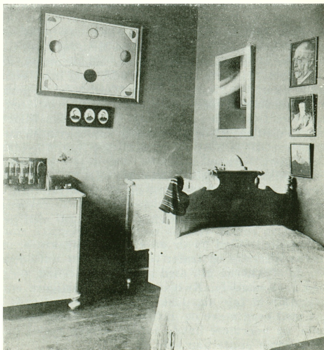
Ydmygt pigekammer med barske husguder.

Mindelunden blev ikke berørt og findes endnu. Det er en firkantet plads hegnet af en høj bøgehæk, en ligeledes hækindrammet sti fører derind. I hækkene er indfældet godt meterhøje steler eller mindestøtter støbt i cement, ialt 28, på een nær alle forsynet med navne, ialt 35. Dels en række personer fra litteraturens og teatrets verden, dels navne, der tilhører privatlivet, endelig er der et par stykker, hvor satyren har været på spil. Og godt det samme, for så smuk en tanke, der ligger bag mindelunden, må den til sidst have været som en mare for sin