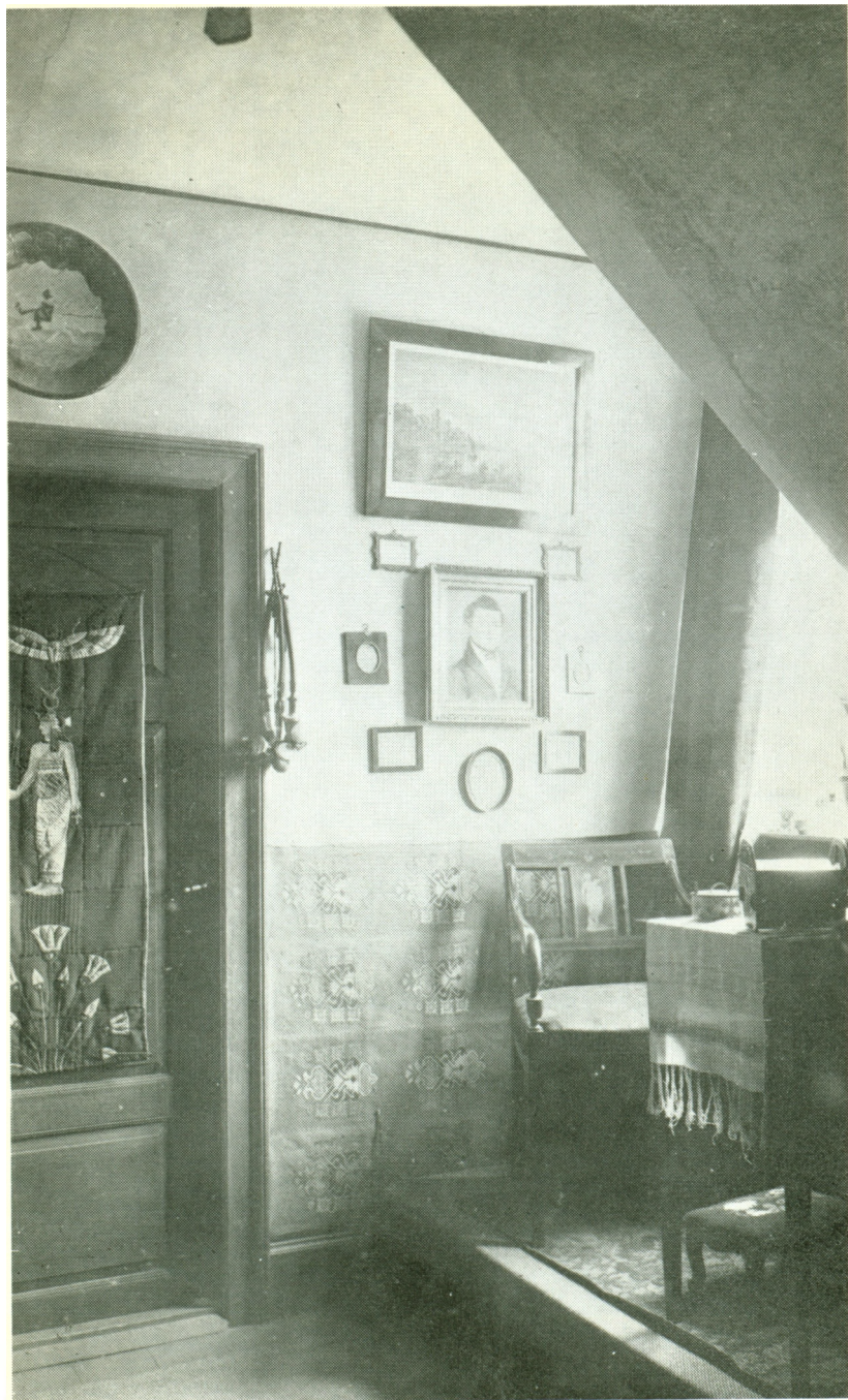
Fra kvisten på Frederiksborgvej