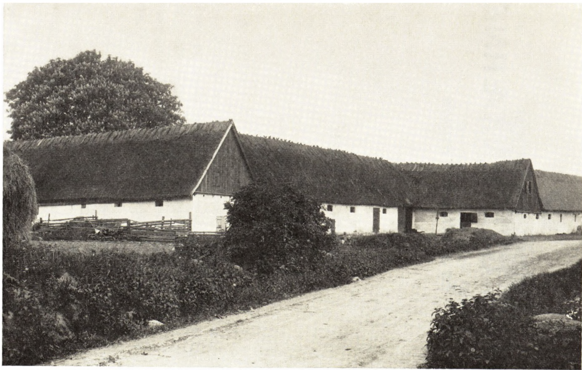
„Gyldenkærnegård“ (omkring år 1909)