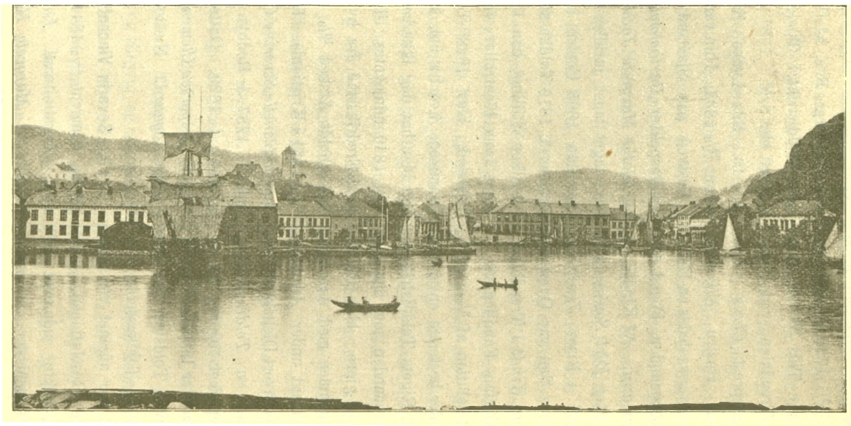
* Den sydvestlige Del af Risør By som den er efter 1861. Ret over Stjernen sees Toldboden, en malet Stenbygning.