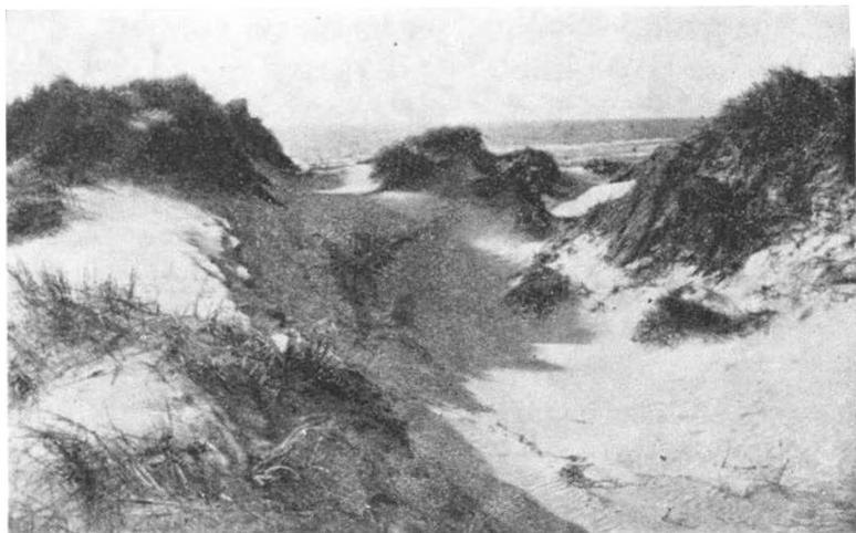
Klitter ved Harboøre.

en særlig solid Rengøring af Stuen. — Alt dette er nu heldigvis paa det nærmeste borte, siden Kutterdriften med Brug af Snurrevod kom blandt Fremskridtene for Stedet. —