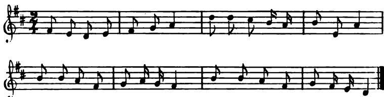
Hovvisen fra Herningsholm.

Dæ bu'er en fi Mænd' i Hanning Bøj', men di æ næstn åld'ti nøj', for deres Håw' den æ så stræng', dæ'for blyw'er di dæ et' læng'.