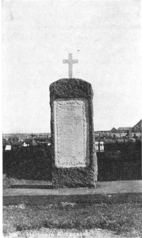
Mindesmærke over de 26 Harboørefiskere, som druknede ved den store Ulykke i November 1893.

svandt fra Egnen. Samtidig dukkede nye Klagepunkter over hele hans Væremåde op, og Enden blev, at Biskoppen beordrede en Provsteret nedsat til Bedømmelse af alle hans Forhold.