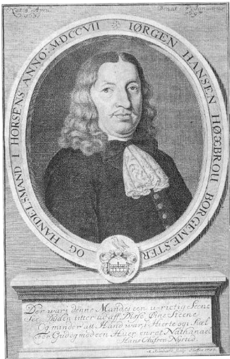
EFTER KOBBERSTIK (formindsket omtr. 3:2).