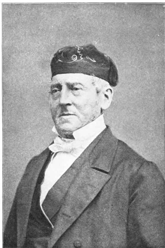
ELIAS ABRAHAMSEN 1800—1889