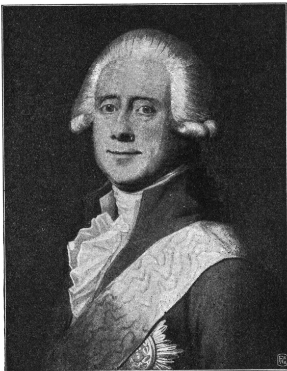
J. G. Moltke. Efter maleri af Jens Juel.

ved vi altså, at han blev opdraget i Danmark og som Vidnesbyrd om, at han var en god Dansksindet mand meddeles der, at han rådede kongen til kun at anvende Danske i de højere embeder, ligesom han også lod de Danskes hovedorgan „Den patriotiske tilskuer“ være fri for censur. Hans stilling medførte