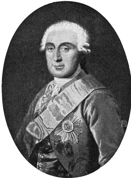
Schack-Rathlou. Efter maleri paa Ravnholt.

storff vilde lægge al sin indflydelse i vægtskålen for at hindre indfødsretten. Da indtræffer noget ganske mærkværdigt. Blandt de Danske statsråder var Schack-Rathlou den mest ansete, men han var utvivlsomt en afgjort modstander af „kabinetsregimentet“. Ikke destomindre ser man det særsyn, at han går sammen med Guldberg ved udarbejdelsen af indfødsretsloven og lader den gennemføres ved en kongelig kabinetsordre . Den har nemlig