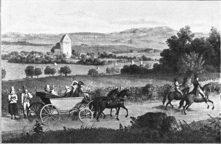
Eckersberg: Køretur på Møn. Efter maleri på Vilhelmsborg 1) .