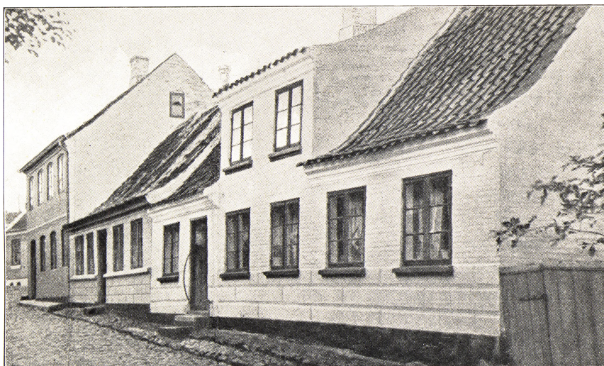
DET GAMLE SLÆGTSTED I MARSTAL, de nuværende Numre 4, 6 og 8 i Skovgyden. Se Fortalen. Fotograferet i Sommeren 1934.